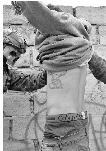
Se sumaron una treintena de detenidos.

Por su parte, la canciller argentina, Diana Mondino, mantuvo el jueves una conversación con su par Ecuador, Gabriela Sommerfeld, a quien le reiteró "el respaldo