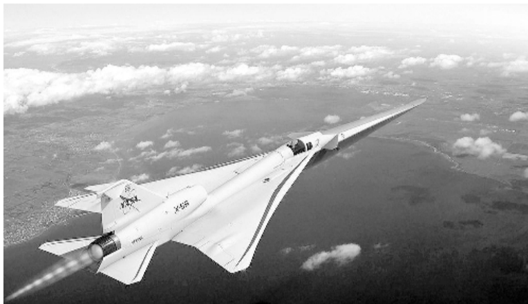
Innovador. Mide 29 metros de largo y tiene capacidad para un piloto.

Además, alguno de los objetivos que esperan que pueda tener este tipo de nave "revolucionaria en la aviación", en base a los comentarios de sus ingenieros, es que sirva, entre otras cosas, para el transporte de suministros de manera inmediata como respuesta