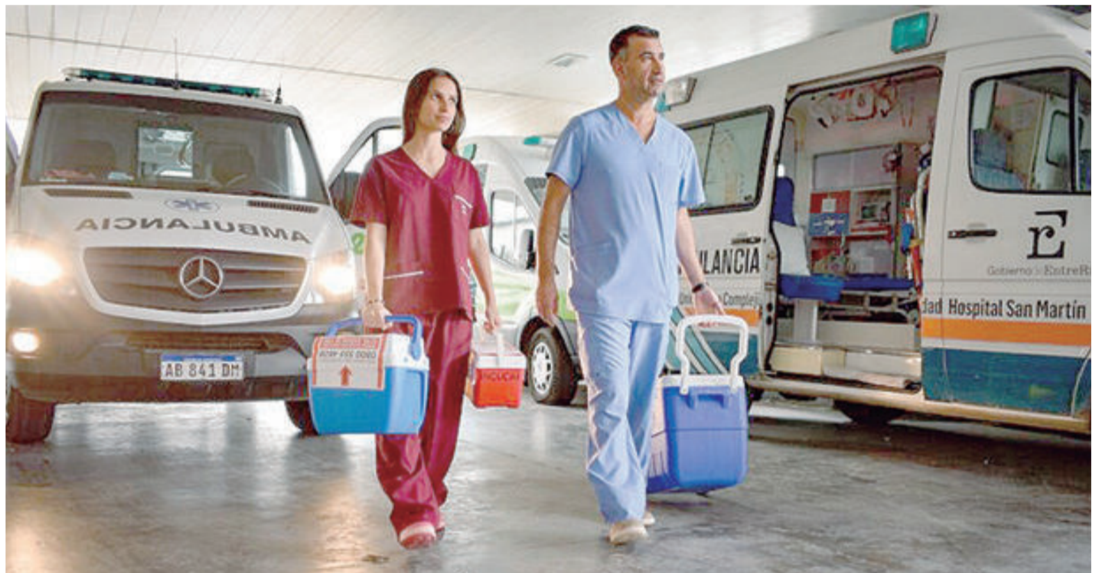
El Incucai destacó que entre los pacientes que recibieron un trasplante el año pasado, 331 fueron pediátricos. ILUSTRACIÓN

Del total de trasplantes de médula ósea, 52 fueron con donantes argentinos y 130 con donantes de los siguientes países: Alemania, Estados Unidos, Chile, Israel, Polonia, Inglaterra, Turquía, España, Brasil, Suiza, Italia, Holanda, Eslovenia, Gales (Reino Unido), Canadá, Arabia, Australia, Luxem-