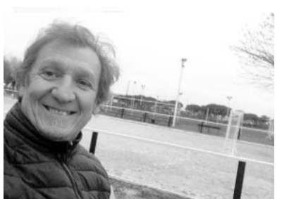
El exdeportista tenía 58 años.

El exrugbier fue hallado asesinado el 12 de enero de 2022 en el acceso al paraje La Choza, en el límite entre Luján y General Las Heras, en el noroeste del Gran Buenos Aires, dentro de