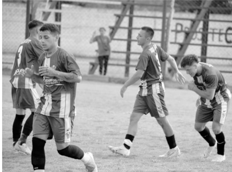
Doce jugará su primer amistoso ante Belgrano.

Los primeros equipos de la Liga Nicoleña en tener actividad oficial este año serán 12 de Octubre y Belgrano, que vienen entrenando desde hace un par de semanas, luego de un receso tras quedar eliminados del Torneo Clausura local. Y pensando en el debut de la Copa Federación, que ambos tendrán en la segunda fecha de sus grupos (en la jornada inicial quedarán libres), este sábado disputarán un amistoso en Soler y América. En el certamen de la Federación, Doce integrará la zona 9 junto a los sampedrinos de Defensores Unidos y América. Belgrano compartirá la zona 11 con Independencia de San Pedro y Villa Sanguinetti de Arrecifes. Será una edición récord del torneo, que contará con 55 clubes divididos en 16 zonas de 3 y 4 equipos cada una, clasificando los dos mejores a los 16avos. de final.