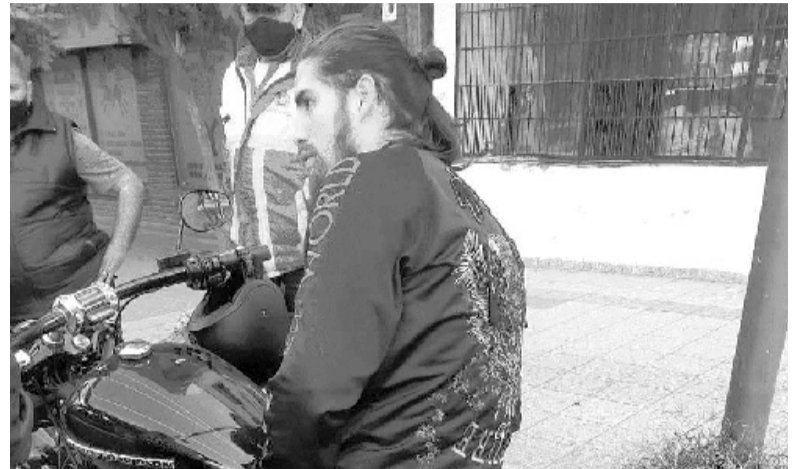
Arresto. El exjugador de Lanús y Boca tenía muchas denuncias por violencia de género.

Por este motivo, la familia Ayala presentó ante las autoridades judiciales la tablet que utilizaba Anabelia para comunicarse cotidianamente con el futbolista y un teléfono celular que la mujer escondía en su baño, los cuales serán peritados en los