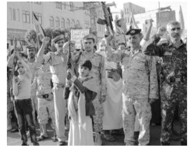
Protestas en ciudades yemeníes ante la ofensiva occidental.

Joe Biden, lo describió como una "acción defensiva" en respuesta "a los ataques sin precedentes de los hutíes contra buques internacionales en el mar Rojo" que amenazan el comercio global.