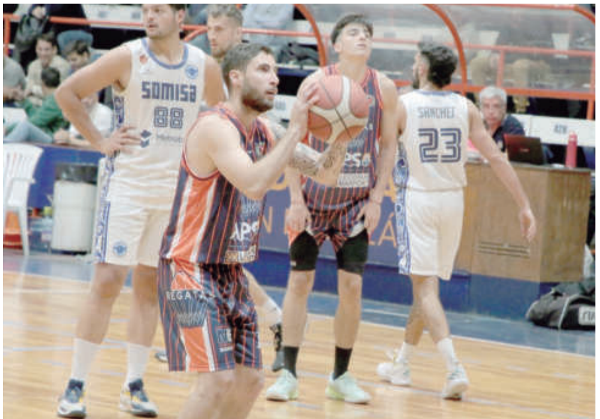
Regatas y Somisa, armados para ser protagonistas.

A partir de allí, por ejemplo, los nicoleños se podrían cruzar con rivales del Sur, que podrían ser Centro Español de Plottier, Pacífico de Neuquén, Del Progreso de General Roca, Independiente de Neuquén, Deportivo Roca, Perfora y El Biguá.