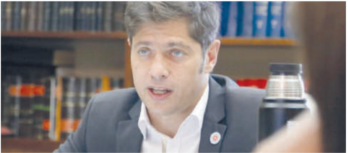
El gobernador bonaerense busca diferenciarse del presidente, sin confrontar

Al respecto, advirtió que las denuncias son “tanto de gente de organizaciones sociales como de personas que les dicen ‘Tenés que venir a trabajar y a las 12 te subís al micro o te subís al tren, y te vas al paro porque te vamos a estar mirando’”, por lo que criticó que “todo está organizado para que a la gente la lleven como si fuera ganado”.