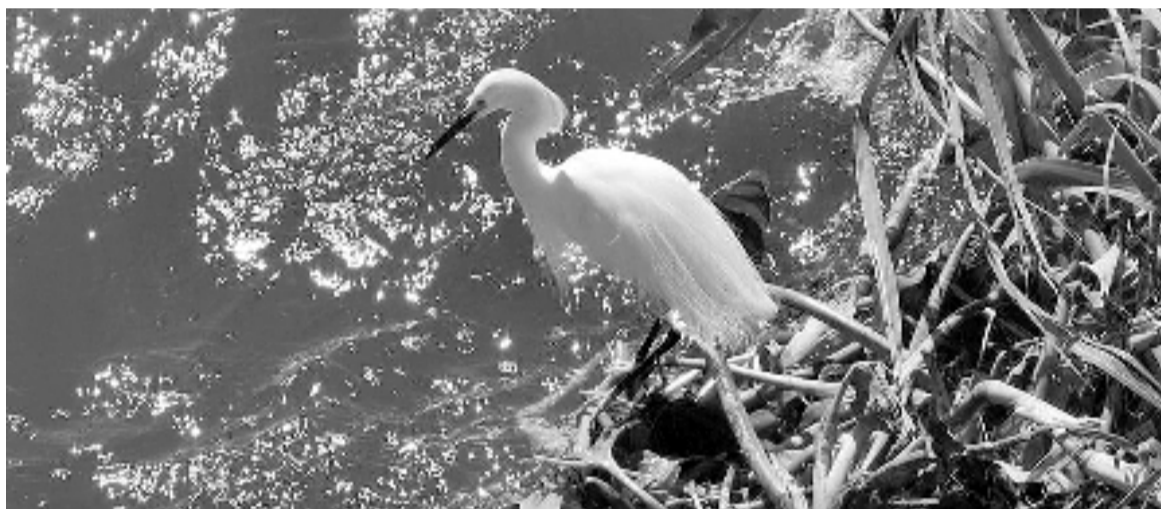
En la medición de ayer, el río Paraná alcanzó un registro de 3,38 m en San Nicolás. El 21 de enero de 2023, es decir 366 días atrás, la altura era de 0,36 metros.

El nivel del río Paraná en el tramo Corrientes-Goya continúa con tendencia general descendente, con oscilaciones acopladas. Por otra parte, sobre el tramo La Paz-Santa Fe se lo observa oscilante/estable, en respuesta al incremento del aporte en ruta debido a las últimas lluvias. Aun así, se prevé que pronto se extinga el efecto de este aporte y retorne a la tendencia de gradual descenso, en aguas medias altas. Finalmente, en el delta del Paraná se lo observa con oscilaciones acopladas sobre la tendencia de gradual descenso en las secciones