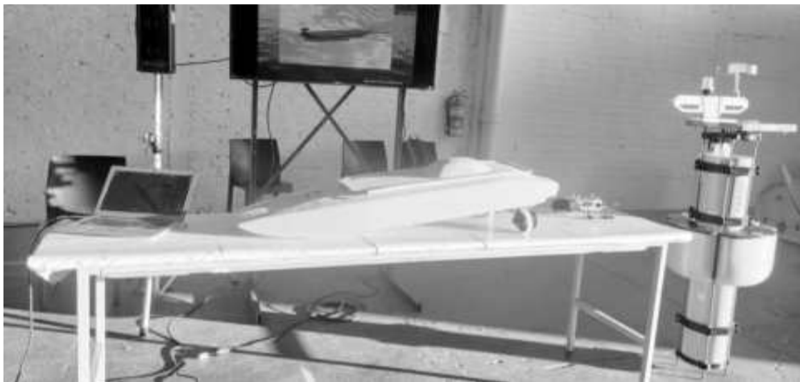
La embarcación que sirve para verificar el estado del agua

En ese contexto sostuvo que fue diseñado “en un 100% en el Instituto Argentino de Oceanografía con el objetivo