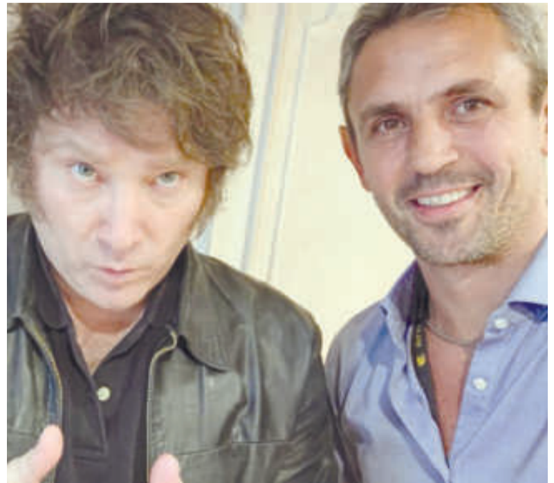
Martín Menem, presidente de Diputados

En relación al Fondo de Garantía de Sustentabilidad, se establece como requisito que el Poder Ejecutivo para poder liquidar dichos activos (luego de ser transferido al Tesoro), "deberá contar con un dictamen previo favorable de la