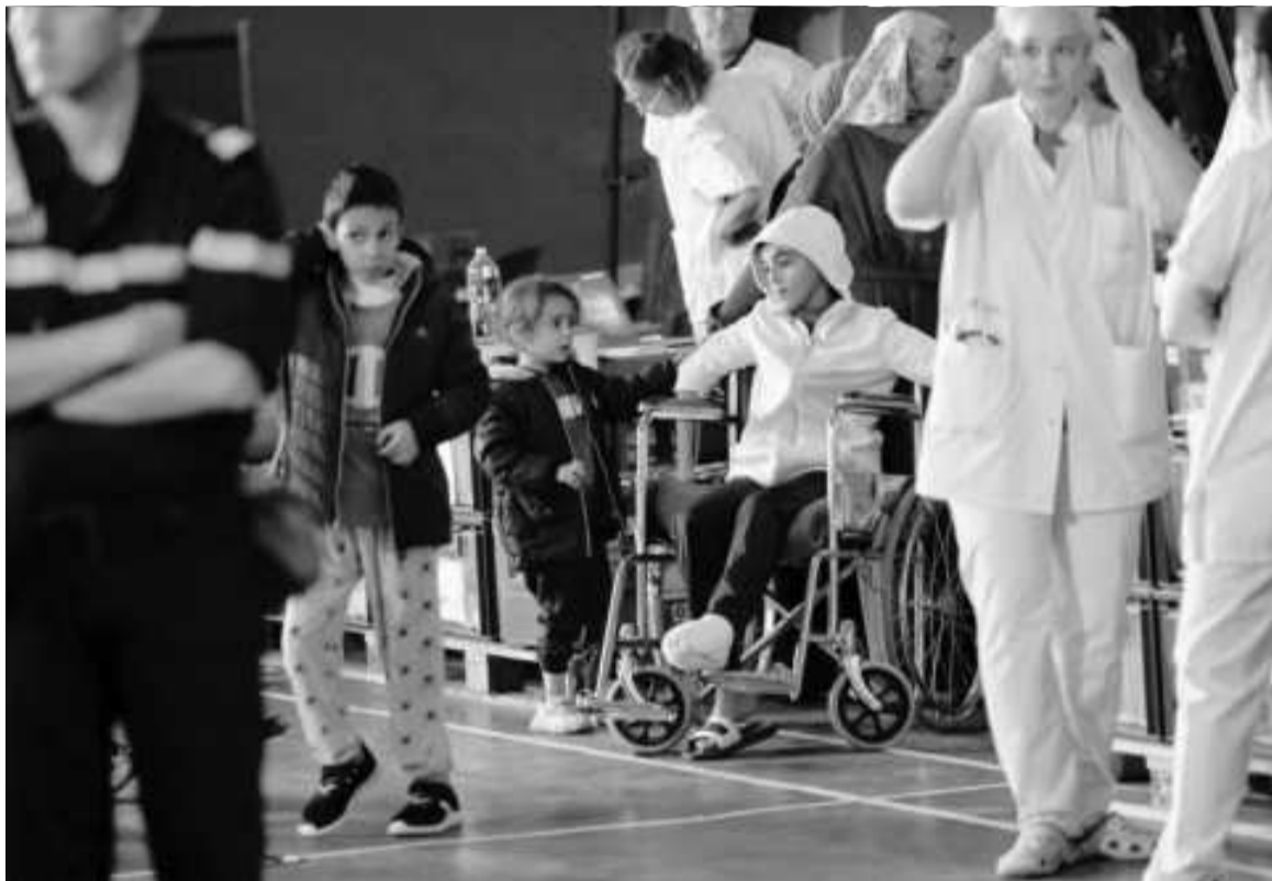
Un niño palestino sentado en silla de ruedas a bordo del barco militar francés LHD Dixmude

Netanyahu respondió de ese modo a un documento emitido por Hamas, el primero desde el 7 de octubre, en el que el movimiento islamista palestino sostuvo que su ataque de ese día a Israel fue una “etapa necesaria” y reclamó el fin de la guerra