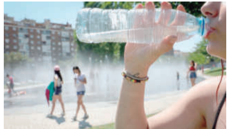
Los días de mayor temperatura serán desde el jueves hasta el sábado. ILUSTRACIÓN

mayores; evitar las bebidas con cafeína, con alcohol o muy azucaradas y prescindir de comidas muy abundantes. Además, se aconseja ingerir verduras y frutas; reducir la actividad física; usar ropa ligera, holgada y de colores claros; sombrero, anteojos oscuros y permanecer en espacios ventilados o acondicionados. Ante sed intensa y sequedad en la boca, temperatura mayor a 39° C, sudoración excesiva, sensación de calor sofocante, piel seca, agotamiento, mareos o desmayo, dolores de estómago, falta de apetito, náuseas o vómitos, dolores de cabeza, entre otros, se deberá solicitar asistencia médica de inmediato, trasladar a la persona afectada a la sombra, a un lugar fresco y tranquilo e intentar refrescarla, mojarla