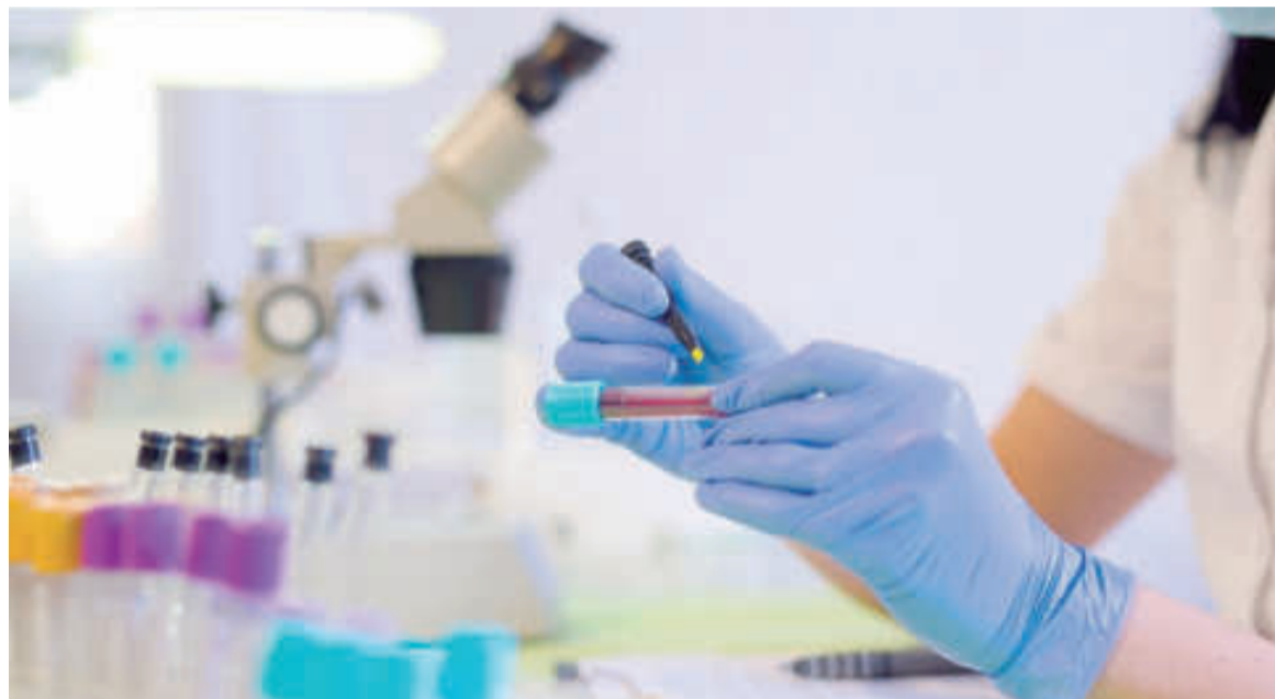
"No podemos seguir trabajando para cobrar de acá a cuatro meses y con aranceles que no alcanzan", manifestaron los profesionales. IMAGEN ILUSTRATIVA

"En este mismo lapso, las empresas de medicina prepaga otorgaron a los prestadores bioquímicos de la provincia de Buenos Aires un incremento de aranceles de 131%, monto claramente insuficiente para hacer frente al servicio que brindamos a sus beneficiarios", añadió el dirigente.