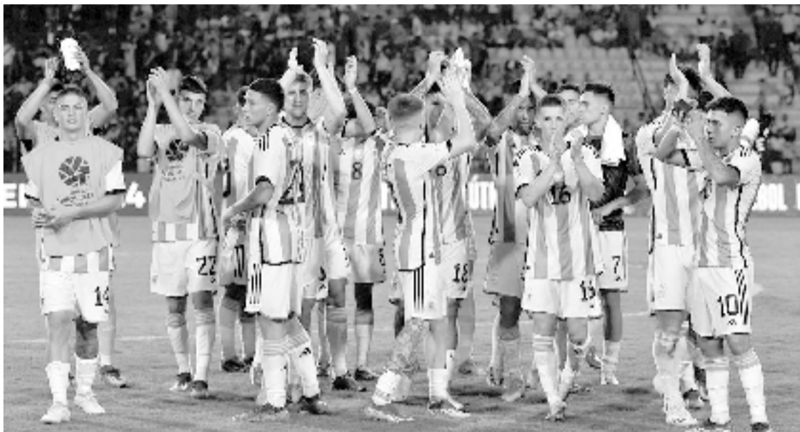
La selección se salvó de la derrota en el final.