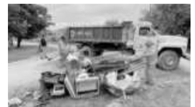
El mosquito que transmite la enfermedad se cría en casas. - Archivo -

en el fuero federal intentó sobornar a la policía de Santa Fe, al ofrecerle 20 millones de pesos para que lo dejen circular, aunque quedó detenido, informó hoy el Ministerio de Seguridad de provincial. El hecho se registró en la tarde de ayer, alrededor de las 15, en el cruce de las rutas 42S y 40S, a la altura de la localidad santafesina de Gálvez, ubicada a 116 kilómetros al noroeste de Rosario. - Télam -