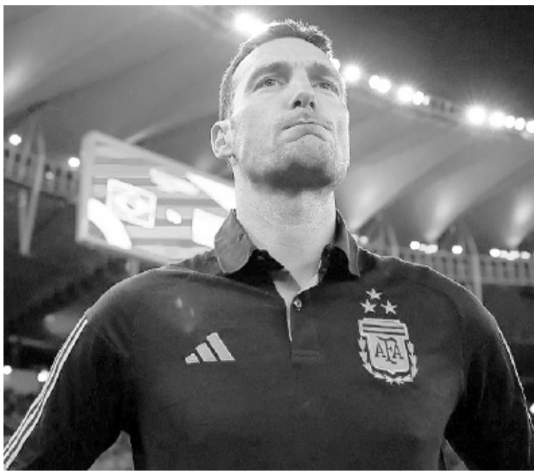
Scaloni seguirá al menos hasta después de la Copa América.

Además, el oriundo de Pujato se refirió al futuro del astro y capitán argentino, Lionel Messi: "Continuará hasta que diga lo contrario. Yo no seré el que diga que no va a venir más", expresó el entrenador.