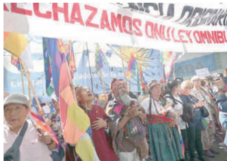
Rechazo. Representantes de Pueblos Originarios marcharon ayer con consignas contra el DNU y la Ley "Bases".