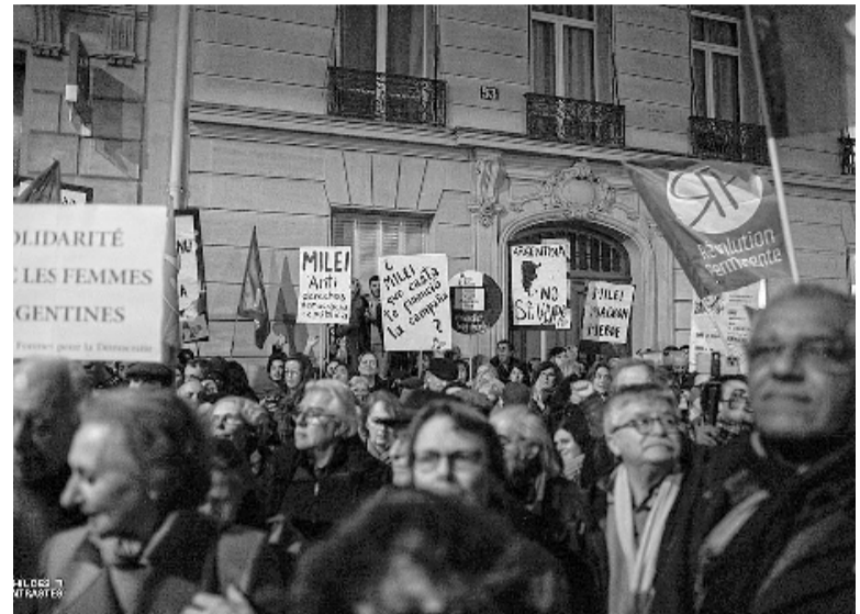
En Francia. París reunió a una de las principales concentraciones. -X-

En tanto, en Londres la protesta se llevó a cabo en la sede de la Federación Internacional de Trabajadores del Transporte, sindicato que expresó su apoyo a