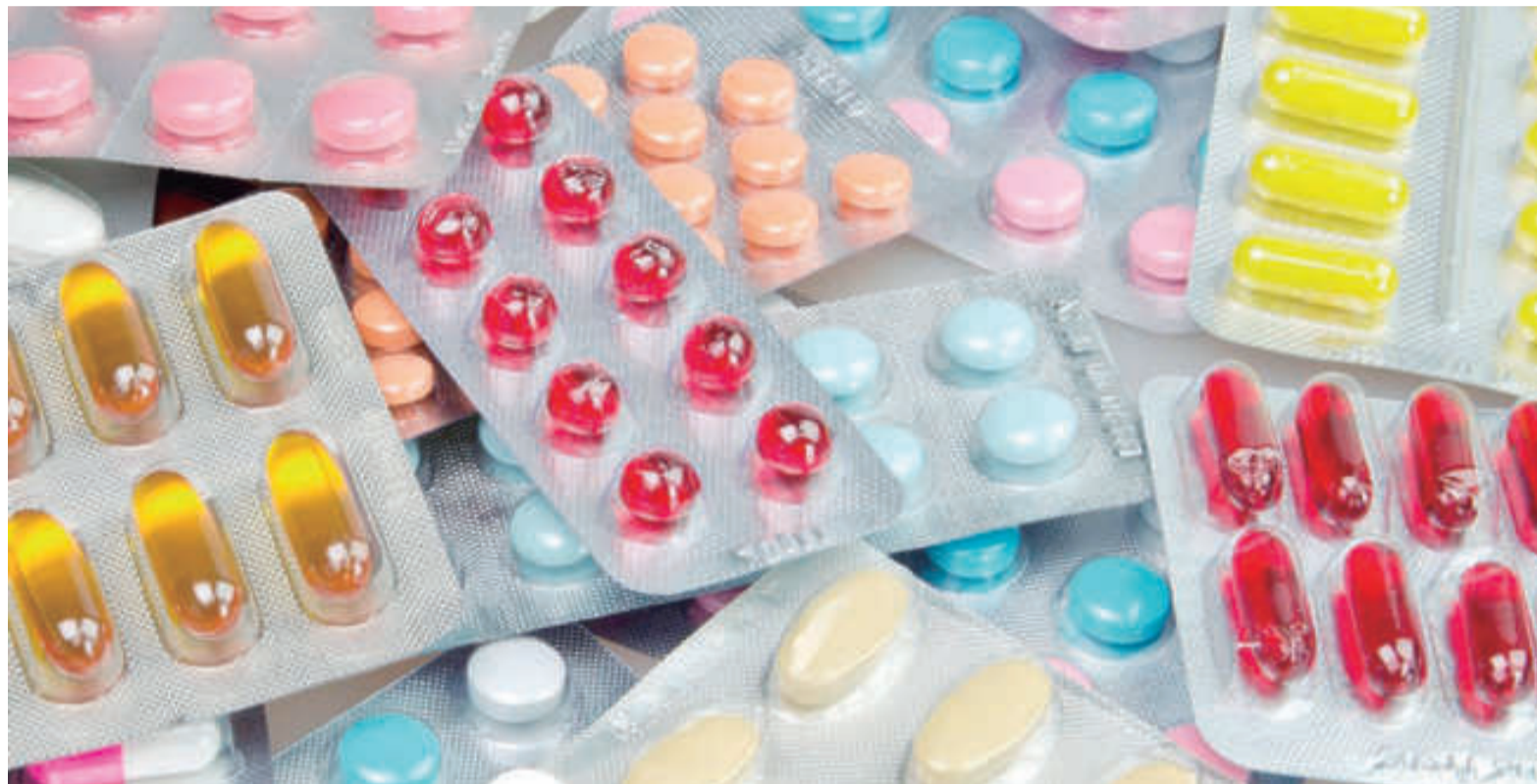
Pese a los cambios en medicamentos establecidos por DNU, en provincia de Buenos Aires se mantiene la prescripción por nombre genérico. ILUSTRACIÓN

"El médico tiene que prescribir el nombre genérico y la farmacia puede darle la marca que el paciente requiera de acuerdo a su condición, necesidad o conocimiento. A veces prefieren una marca porque ya lo