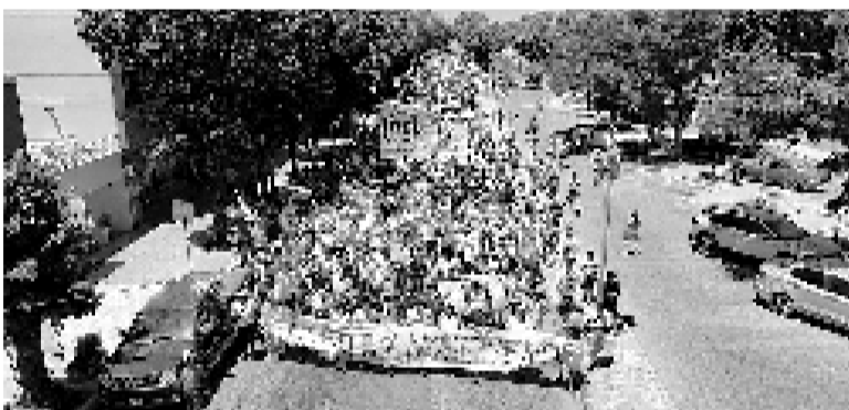
El paro en las calles de Necochea. - Ecos Diarios -

El paro nacional tuvo también su réplica en localidades del interior bonaerense, además de Mar del Plata (ver aparte).