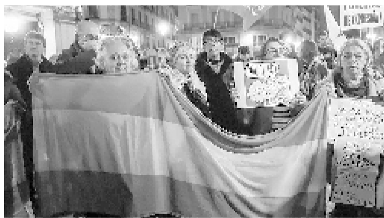
En Madrid los gremios llamaron a movilizarse frente a la embajada. - ABC -

● MALI. - Más de 70 personas murieron a causa del colapso de un túnel en una mina de oro en el suroeste. La cifra de muertos asciende a 73 y más de 200 buscadores de oro estaban trabajando en el lugar al momento del accidente. - Xinhua -