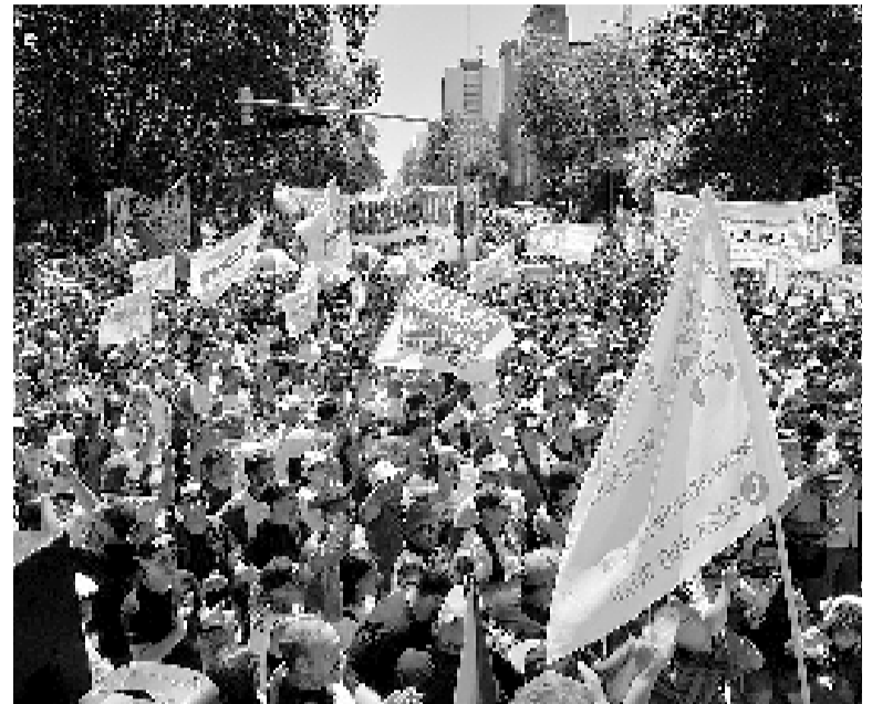
En temporada. Una multitud se concentró en Mar del Plata.

de la calle Mitre, a cien metros de la Catedral local. En plena temporada de verano, el centro marplatense dejaba ver el acatamiento de la medida de fuerza, con comercios y restaurantes cerrados desde que el paro se puso en marcha a las 12. En Villa Gesell, incluso, hubo una marcha por las playas de ese balneario bonaerense, donde grupos de turistas caminaban mientras aplaudían y cantaban a viva voz "la patria no se vende", según lo reflejado por el intendente Gustavo Barrera en su cuenta en X.