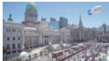
Extenso cordón policial protegiendo el Congreso. - Télam -

Rodríguez. Y añadió que "lo que queda ahora es que los diputados y senadores rechacen la derogación". - DIB -