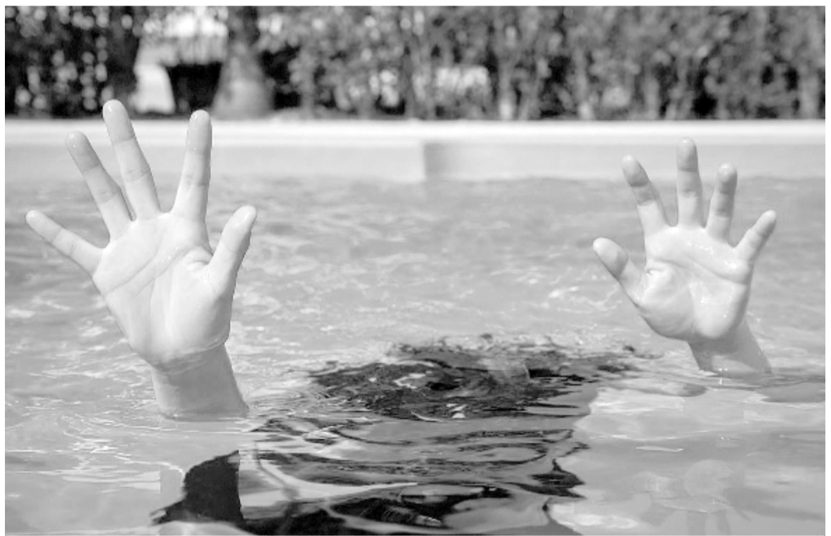
Los ahogamientos tienen como principal motivo el aumento de las actividades acuáticas.

Los accidentes vehiculares aumentan en el receso de verano debido al incremento de vehículos que circulan en las rutas con fines turísticos. Si se presencia un ac-