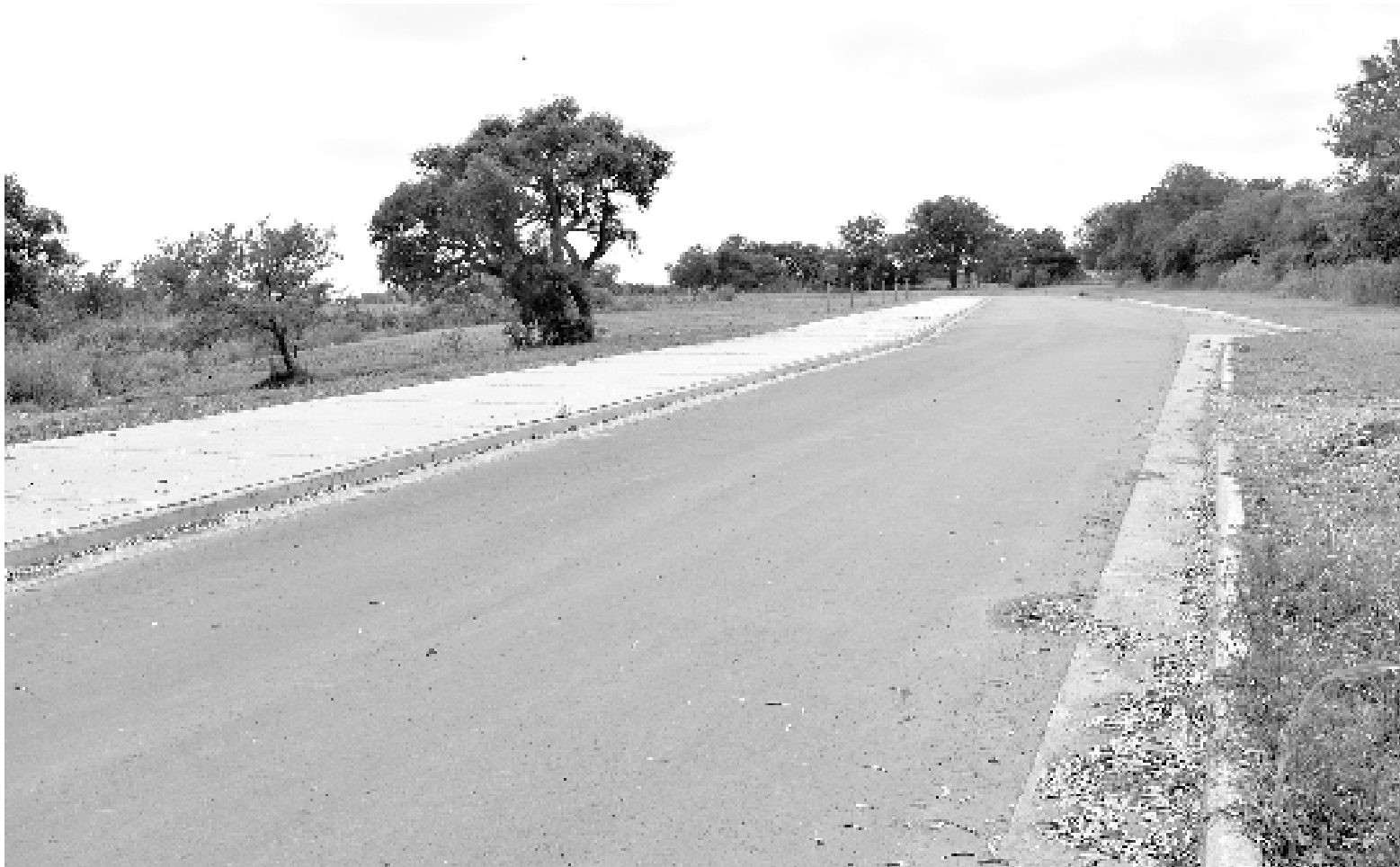
La de costanera norte es uno de las obras que se concluirán en este 2024.

El intendente manifestó que sus principales desafíos irán por el lado de la transformación digital y la continuidad de la obra pública. "Quiero darle continuidad al trabajo realizado, potenciarlo y seguir haciendo crecer a la ciudad", dijo.