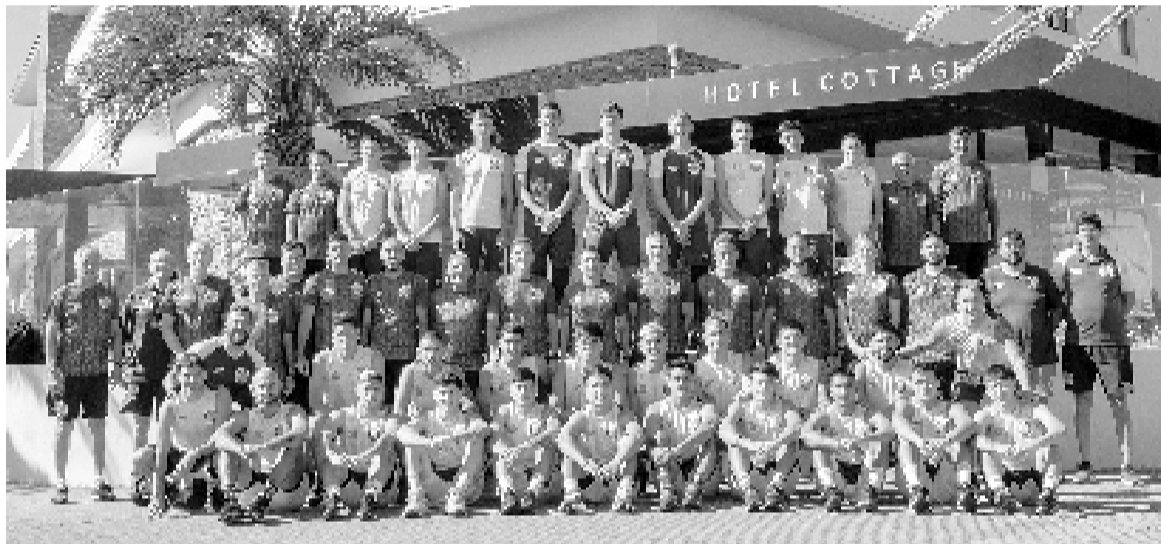
El plantel de Central que viene de completar la pretemporada en Uruguay, sin el colombiano Campaz, ausente hoy.

Balbo dirigió a Central Córdoba en el segundo semestre de 2022, durante 18 partidos (ocho victorias, dos empates y ocho derrotas), lo salvó del descenso cuatro fechas antes del final del