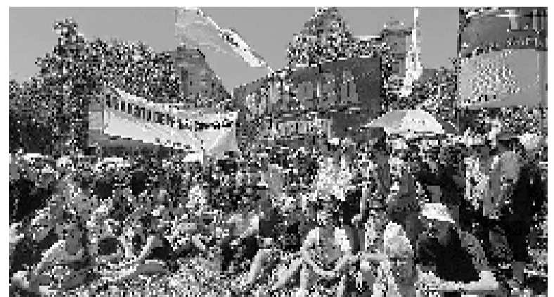
Los gremios de prensa en el Congreso.

Mientras, la CGT de San Juan realizó en la ciudad capital una multitudinaria movilización que confluó en la Plaza 25 de Mayo, el principal paseo público, bajo el lema "La Patria no se vende".