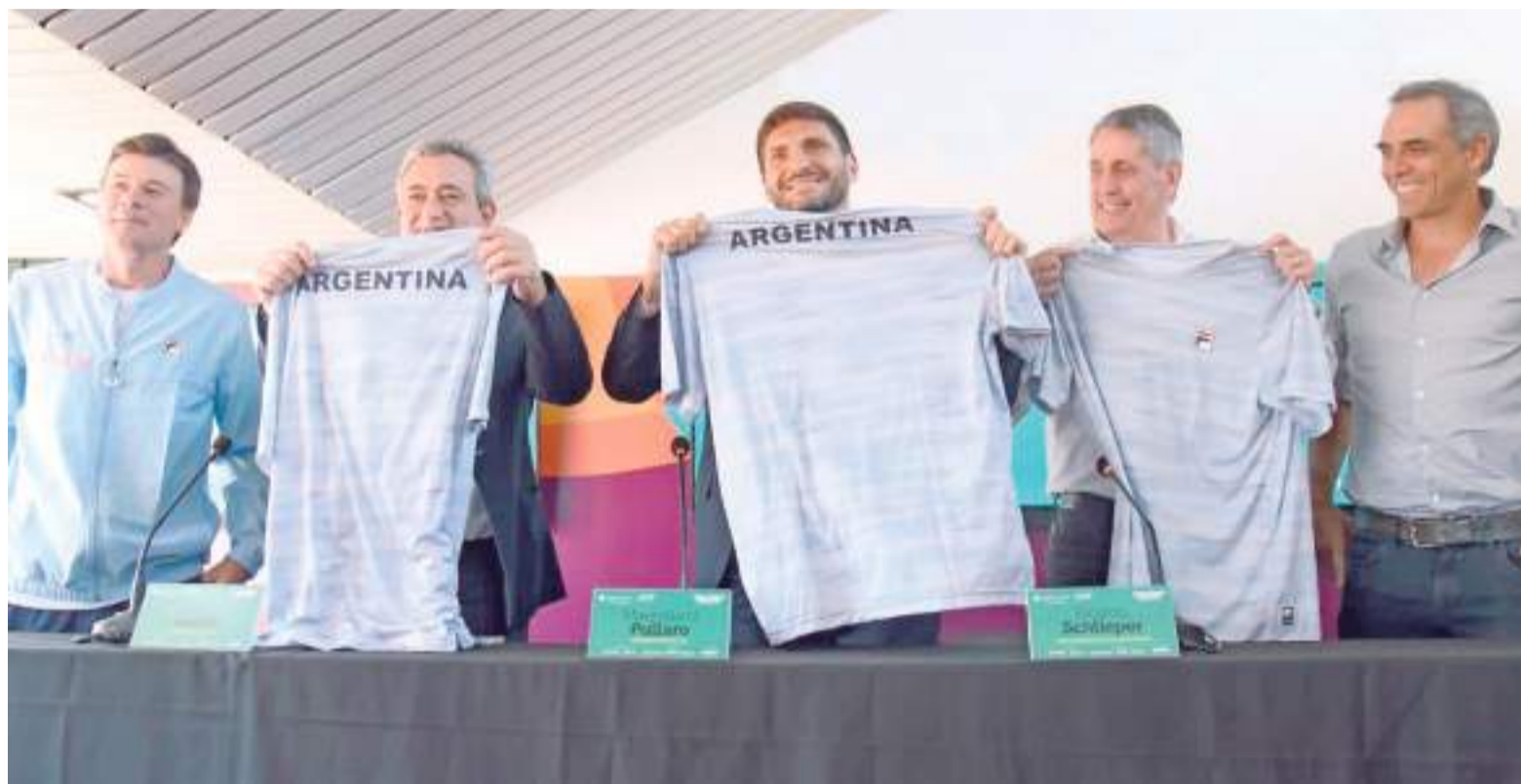
El gobernador Pullaro encabezó la presentación de la serie entre Argentina y Kazajistán.

Cabe recordar que la actividad de este año se pondrá en marcha en El Calafate el 25 de febrero. Estás confirmadas como sedes a su vez las ciudades de Viedma, Centenario, Toay y Buenos Aires. En consecuencia, hay todavía diez pruebas sin autódromos confirmados.