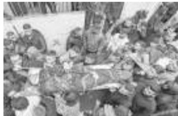
Ataque camuflado.

La incursión en el hospital de la ciudad de Jenín evidenció una vez más cómo la violencia se ha extendido a los territorios palestinos de Cisjordania desde que Israel lanzó su ofensiva en Gaza tras los ataques de Hamas del 7 de octubre. Estados Unidos, Qatar y Egipto tienen en curso negociaciones por separado con Israel y Hamas para intentar convencerlos de detener el enfrentamiento, pero el grupo palestino y el Gobierno