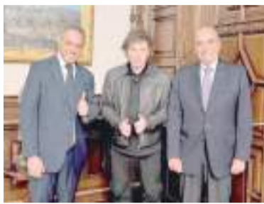
El posteo en la red social. - X -