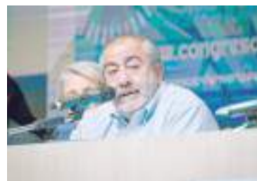
Héctor Daer, secretario General de la CGT.

Asimismo, señala "que los propios considerandos de dicho DNU traducen -al menos en lo que respecta a la materia laboral- que no se evidencia objetivamente la 'necesidad' de adoptar tan nume-