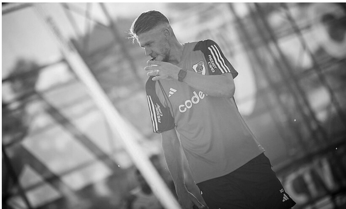
El Millonario irá por su primera victoria. WEB

Racing inició el certamen lleno de expectativas. Fue uno de los equi-