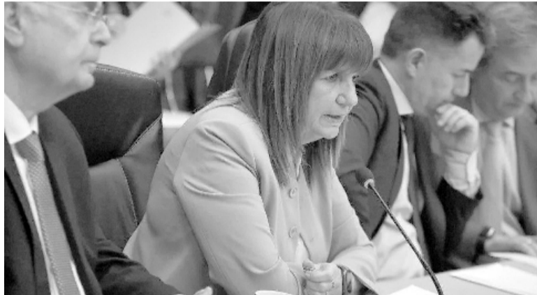
Patricia Bullrich anunció protocolo para incomunicar a presos de alto riesgo.

Lo anunció Patricia Bullrich. Es parte de un "protocolo" para controlar más las comunicaciones entre las cárceles y el exterior.