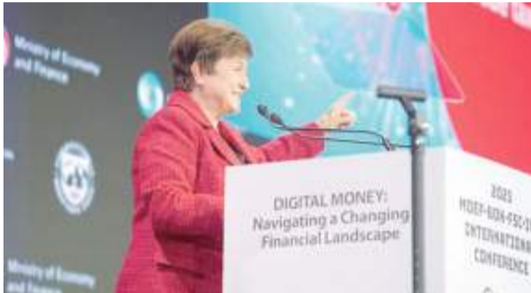
Anticipo. La titular del Fondo Monetario Internacional, de buen vínculo con Milei. - FMI -

Con esta caída, el país será el que más retrocederá en 2024 entre los 30 países seleccionados por