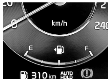
La flecha junto al marcador de nivel de combustible indica de qué lado del auto está la tapa para cargarlo.

Se trata de una flecha que se encuentra al lado del dibujo de un surtidor que suele acompañar la marcación del nivel de combustible en el cuadro de instrumentos del conductor. Y gracias a esa flecha, hacia la derecha o hacia la izquierda, se consigue una respuesta instantánea a ese momento de duda. Inicialmente, cuando algún fabricante