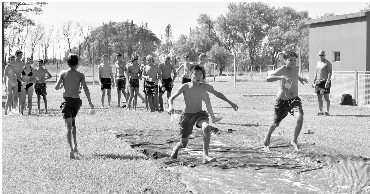
Entre juegos, compañerismo y aprendizajes, estudiantes nicoleños se despiden de las “Escuelas abiertas de verano” 2024.

Quien sostuvo que las tareas de garantizar la limpieza de los espacios utilizados, proveer la comida en el desayuno y cocinar el almuerzo “fueron cumplidas”, para lo cual se involucra-