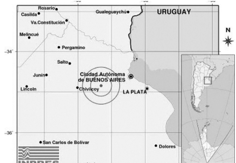
Registro. El sismo con epicentro en la provincia de Buenos Aires.

Y retoma Irene Pérez: "En 1848 aparentemente también ocurrió un sismo con epicentro tentativo en el Río de la Plata, porque afectó a al-