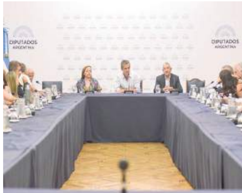
Diferencias. Discuten algunos puntos del debate en particular, como las privatizaciones y la delegación de facultades.