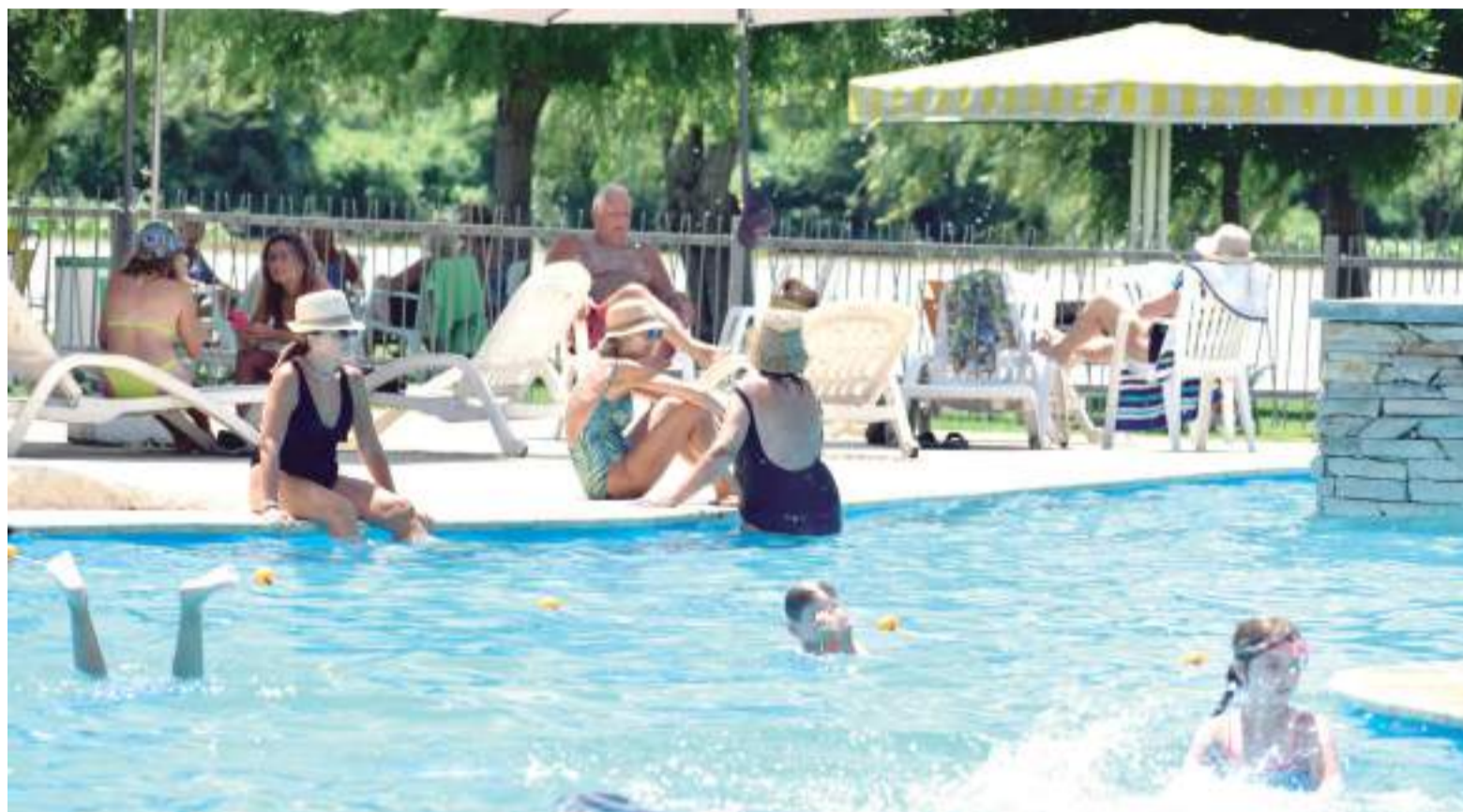
La pileta es lo más parecido a un oasis para sobrevivir a las altas temperaturas.

A partir del viernes, de cara al fin de semana, si bien la temperatura desciende unos grados, aquellos fanáticos del verano podrán disfrutar de días soleados. El viernes la temperatura máxima será de 38 grados, mientras que el sábado y domingo se espera que lle-