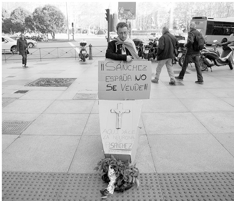
"España no se vende". Mensaje para el presidente.

to de dicha norma clave llegó ayer, pero no hubo conformidad entre todos los aliados del oficialismo para su aprobación.