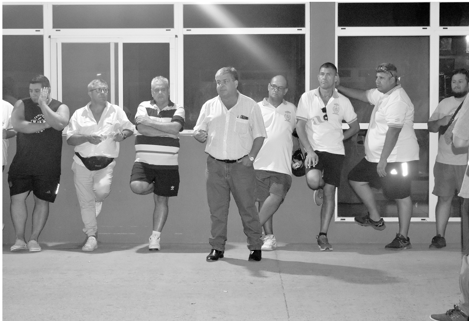
Los choferes se reunieron ayer para informarse de la situación, y decidir los pasos a seguir.