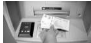
El hecho ocurrió en la periferia de La Plata. - PBA -

A raíz de ello, el hombre fue trasladado malherido al Hospital de Melchor Romero, donde murió el