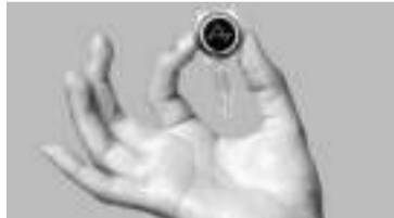
El dispositivo que instaló Neuralink, la empresa de Musk. - Tetam -

Este hito para la compañía fundada por Elon Musk y dirigida por Jared Birchall llega después de la aprobación (Administración de Fármacos y Alimentos de Estados Unidos (FDA). Cabe señalar que este organismo federal rechazó la primera petición de la empresa, realizada a principios de 2022, pero dio el visto bueno en mayo