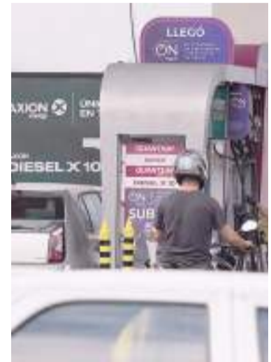
Estiman un ajuste entre el 11% y el 25%.

11%, el litro de nafta súper pasaría de $699 a $775 en la Ciudad de Buenos Aires, mientras el valor de la premium subiría de $862 a $956. Está claro que en el interior el litro está más alto.