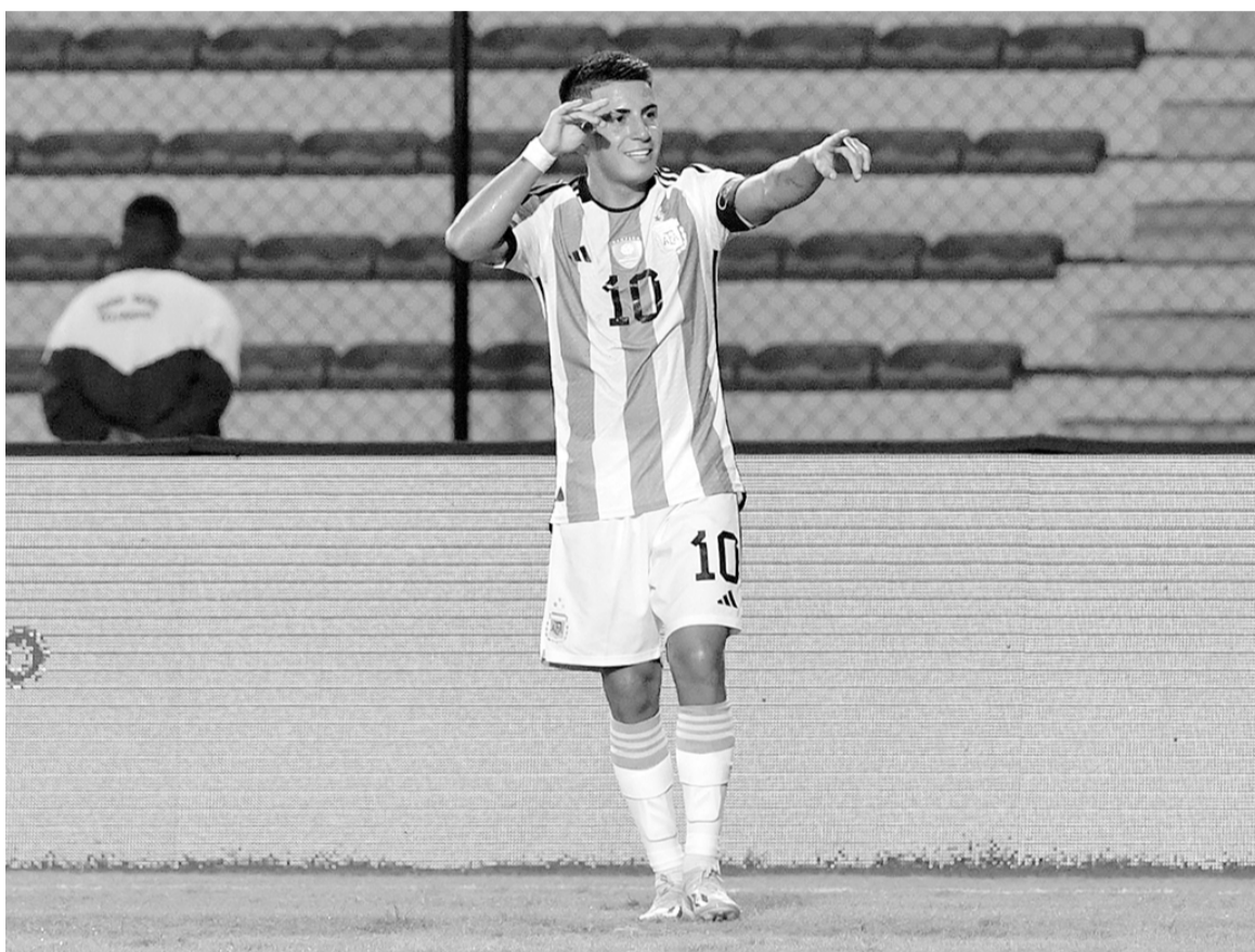
Argentina ya está en la fase final.

En el estadio Polideportivo Misael Delgado, la "Albiceleste" venció a su par trasandino por 5 a 0 con un doblete de Thiago Almada y los restantes de Santiago Castro, Aarón Quiros y Luciano Gondou.