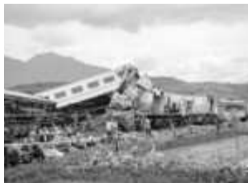
Los equipos de búsqueda trabajando en el lugar. - AFP -

"Escúchenme claramente. Diré lo que Donald Trump no dirá: la violencia política nunca, jamás, es aceptable en el sistema político de Estados Unidos. Nunca, nunca, nunca. No tiene lugar en una democracia", señaló Biden. - Telam -