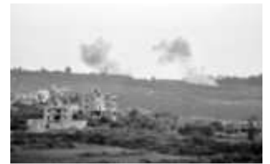
Advierten una respuesta "inevitable".