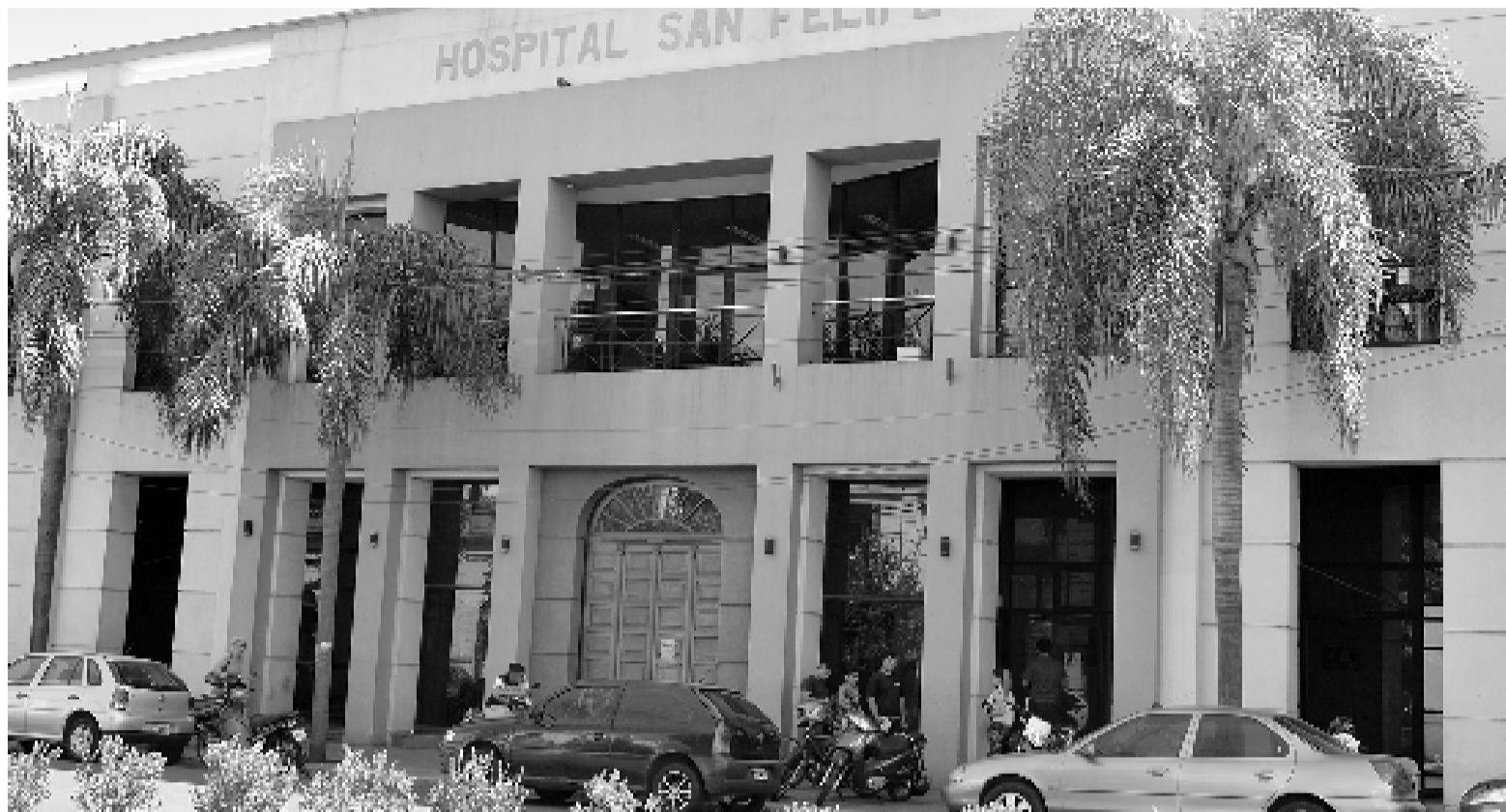
En San Nicolás la donación de sangre se puede hacer en el hospital San Felipe.