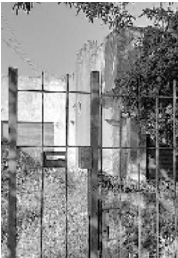
La mujer llevaría una semana fallecida.