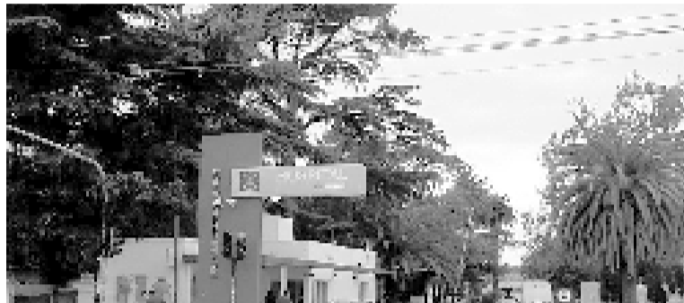
Atendido. El joven fue trasladado al sector Sanidad de la Unidad 34 de Melchor Romero, en La Plata.