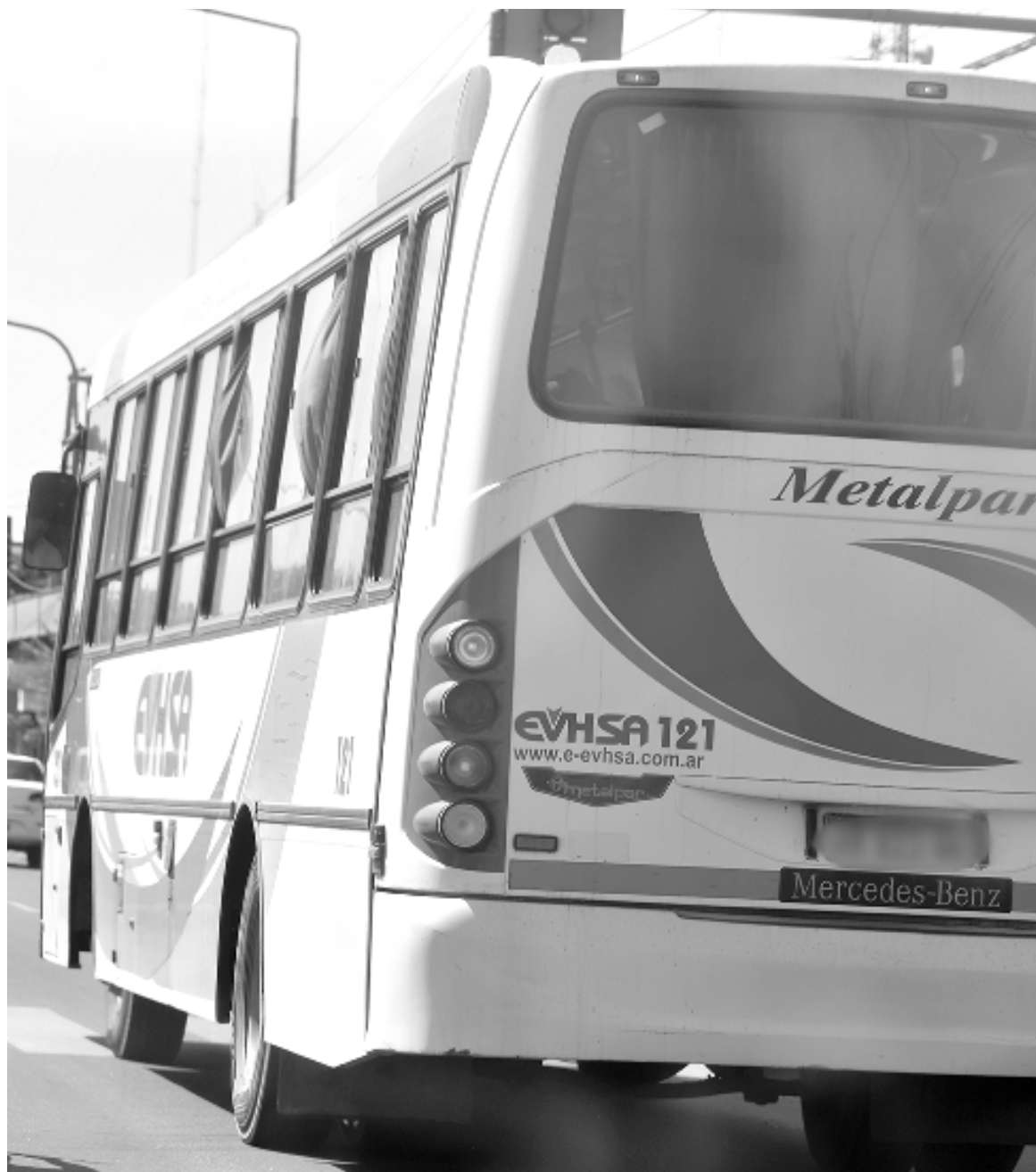
Las actuales tarifas entraron en vigencia el 6 de diciembre; 28 días más tarde, el miércoles la empresa solicitó una nueva revisión con un aumento sugerido del 121 %.