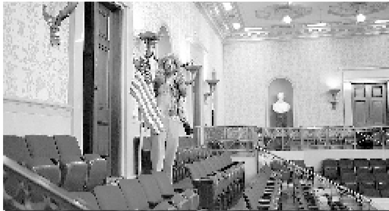
Aniversario. Uno de los seguidores de Trump que irrumpió en la cámara del Senado el 6 de enero de 2021.

El 6 de enero de 2021, un grupo de seguidores del magnate irrumpió en la sede del Congreso en Washington para detener la sesión que confirmaba el triunfo de Biden en los comicios de 2020, luego de semanas en las que el entonces mandatario denunció fraude, aunque sin aportar