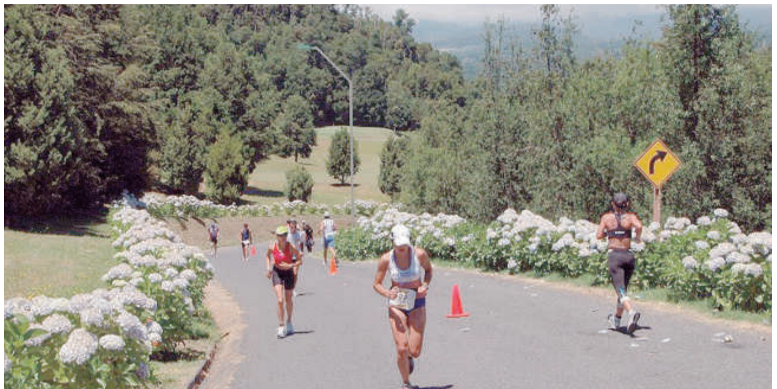
La etapa de pedestrismo en Pucón es tan linda como difícil.