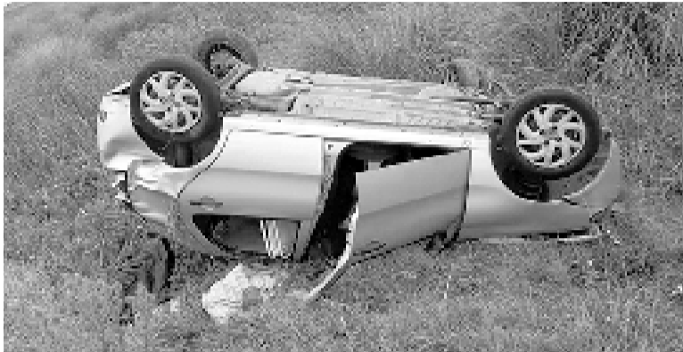
Uno de los vehículos siniestrados.

Ocurrieron en las cercanías de Pinamar y Necochea. Tenían 6 y 8 años.