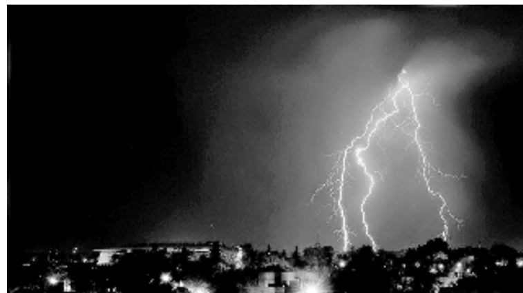
médico. La tormenta eléctrica con viento también provocó daños en algunas estructuras poco sólidas de la zona.

"El paciente está estable y controlado. De continuar así, se evalúa el pase a sala común en las próximas 24 o 48 horas", indicó el parte