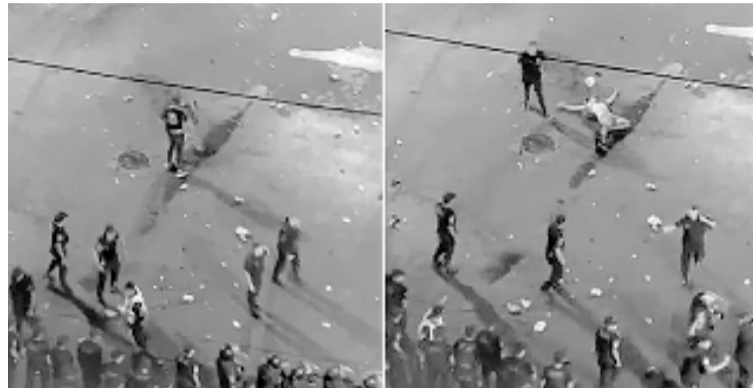
En la secuencia, el seguridad se acerca al hombre y lo golpea en el rostro, dejándolo tendido en el asfalto.

Un joven fue internado en grave estado de salud en Avellaneda tras ser golpeado por un empleado de seguridad privada en cercanías del estadio de Racing Club, cuando intentaba ingresar al lugar para el recital que la banda de rock La Renga dio el sábado.