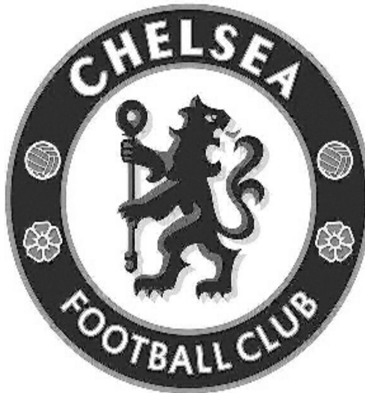
Los blues quieren invertir millones de dólares.

"Sabía que me iban a mandar gente a insultar en La Bombonera. Yo tenía esa información.