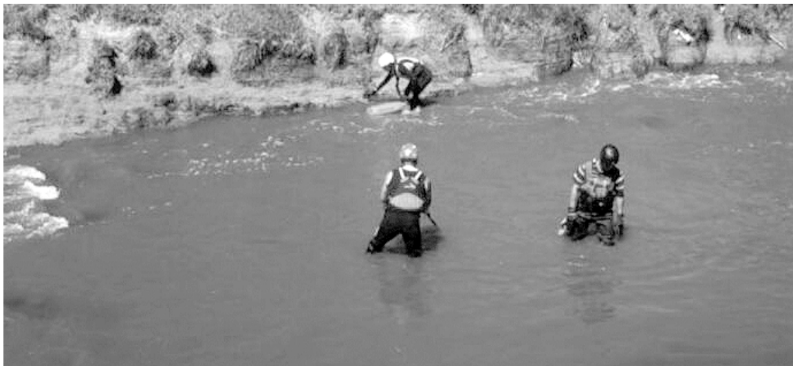
Se hicieron intensas búsquedas durante tres días

El jefe comunal explicó que la noticia represente "un dolor muy fuerte para toda la comunidad" que se había involucrado fuertemente en la búsqueda y por eso "vamos a tener dos días duelo y asueto por el día de