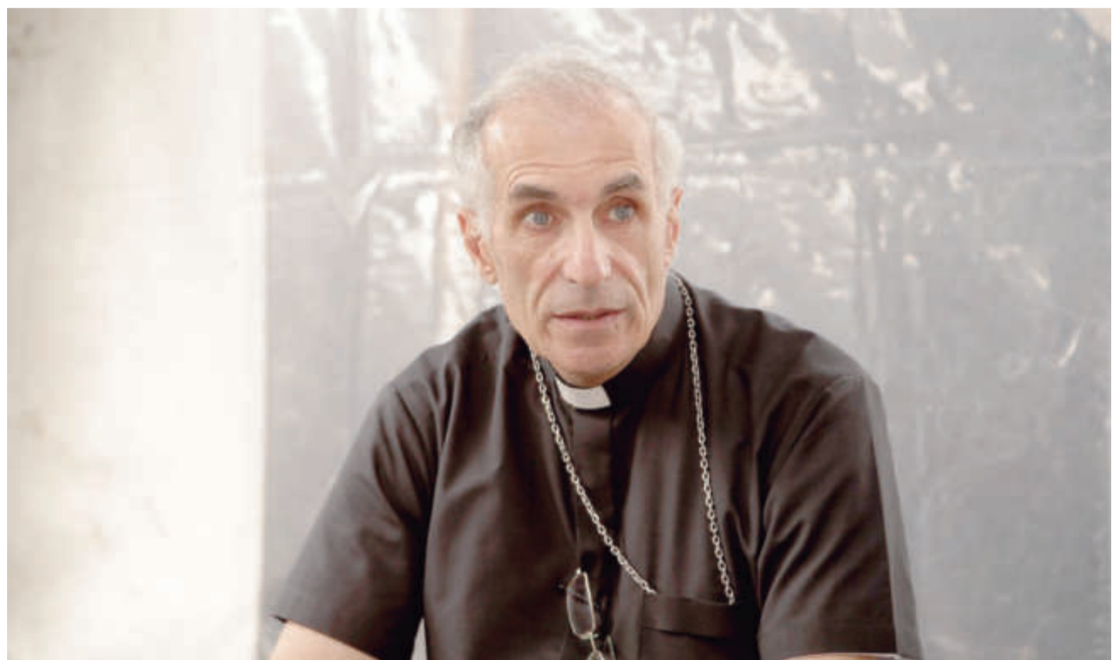
El Presupuesto 2023 destinaba $188,7 millones, a repartirse entre 153 arzobispos y obispos, 640 sacerdotes y 1100 seminaristas.

Sin embargo, el obispo de la Diócesis San Nicolás ratificó que el cese de asignaciones se debe exclusivamente a una decisión de la institución