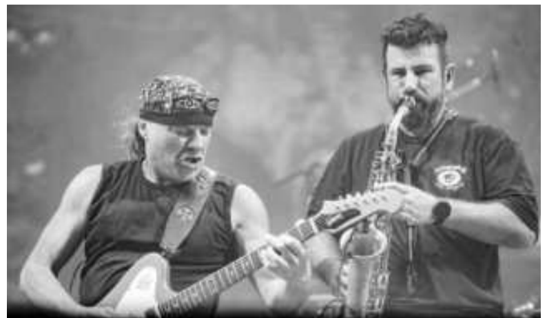
La Renga se presentó en Racing

La fiesta tomó color definitivo cuando a las 22 el trío conformado por Nápoli, Tete y Tanque Iglesias puso a funcionar su demoledora maquinaria de rocanrol sin medias