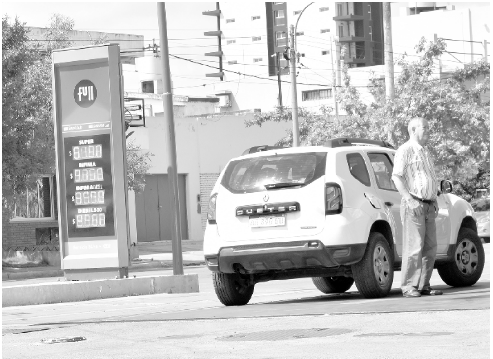
El litro de nafta súper de YPF costaba hace un año $182,60; al cabo de un total de 15 sucesivos incrementos, el mismo combustible cuesta hoy $818. IARA CERASI / EL NORTE

Llenar el mismo tanque con nafta Infinia, que se expende a $978 el litro, tiene actualmente un valor de $39.120. Hace un año