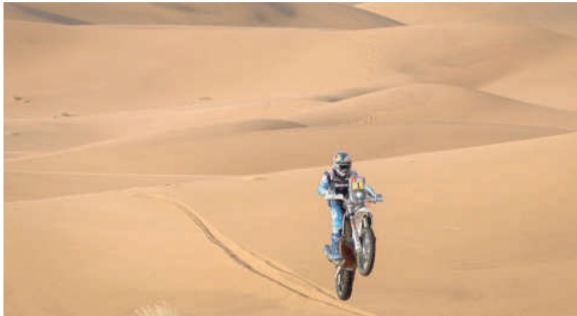
El salteño ahora está quinto en la General.

El corredor de la escudería Red Bull, octavo en las posiciones globales antes de la segunda etapa, salió del