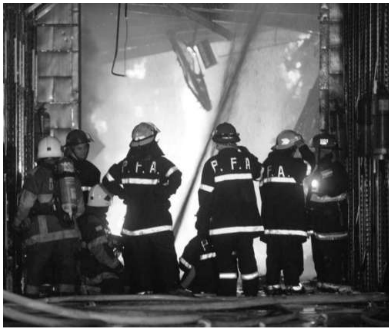
El fuego en Iron Mountain

A diez años de la muerte de los ocho bomberos y dos rescatistas de Defensa Civil por el derrumbe de una pared mientras combatían un incendio desatado en el interior de un depósito de la empresa Iron Mountain, en Barracas, las familias de las víctimas exigen el inicio del juicio oral que condene a los responsables, aunque reconocen que su lucha es “contra molinos de viento”.