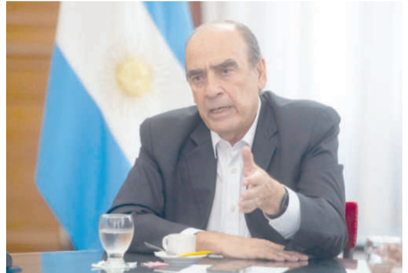
Guillermo Francos, ministro del Interior