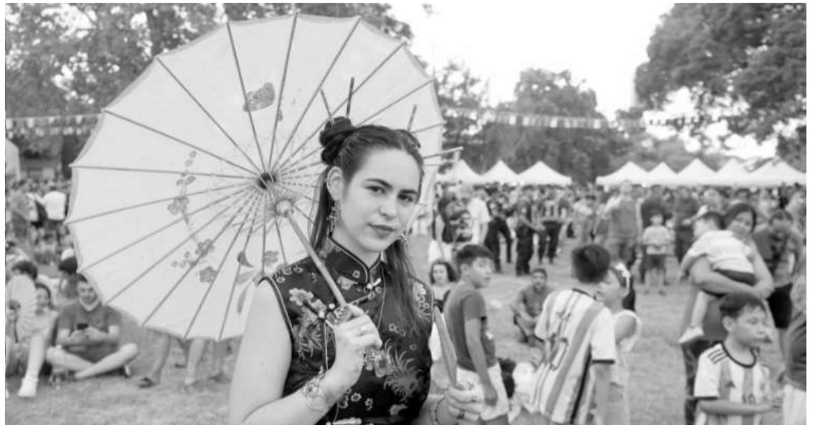
Festejos anticipados en Buenos Aires, por el Año Nuevo Chino

"Al principio, me metí por lo deportivo y lo social, pero después fui aprendiendo sobre la cultura (china) y eso le da un trasfondo