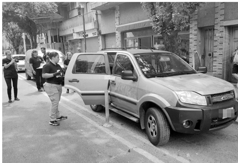
El vehículo robado fue hallado en zona oeste.

La víctima fue abordada por un sujeto aún no identificado mientras estaba junto a su pareja en Río de Janeiro y Mendoza. Fue derivado en grave estado al Heca donde falleció horas más tarde. El vehículo fue encontrado en zona oeste y se investiga la mecánica del hecho.