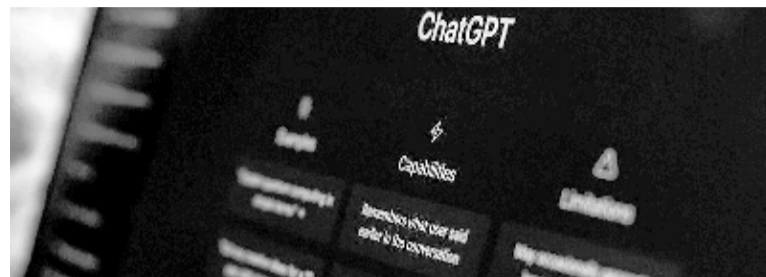
ChatGPT recibe en promedio 1.500 millones de visitas mensuales

después había alcanzado los 100 millones de usuarios activos. Para ponerlo en perspectiva, Instagram tardó dos años y medio en alcanzar esa cifra, mientras que TikTok, una de las redes sociales más populares del mundo, lo hizo en 9 meses. Durante noviembre de 2023, a un año de su debut, recibió 1.700 millones de visitas, siendo actualmente una de las 50 webs más consultadas del mundo. Su capacidad de responder preguntas complejas sobre prácticamente cualquier tema y generar contenido similar al humano inmediatamente llamó la atención de profesionales fuera del mundo de la tecnología, quienes encontraron en este poderoso instrumento un recurso invaluable para ahorrar tiempo y esfuerzo en sus tareas y proyectos, entre ellos, estudiantes de todo el mundo, que rápidamente comenzaron a utilizarlo. Algunos, como recurso enriquecedor. Otros, como herramienta para resolver