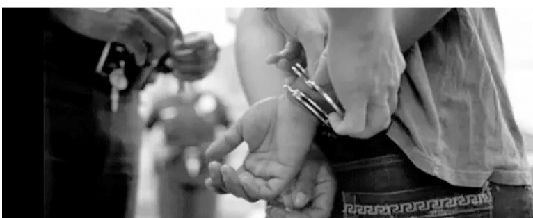
El sujeto intentó evadirse pero pudo ser reducido por los agentes policiales.

Efectivos de la División de Comando de Patrulla Pergamino en forma conjunta con personal de la Comisaría Tercera y del Grupo Departamental Motorizado (GDM), detuvieron en la noche del pasado jueves a un sujeto de 32 años que era intensamente buscando en el marco de una causa por abuso sexual.