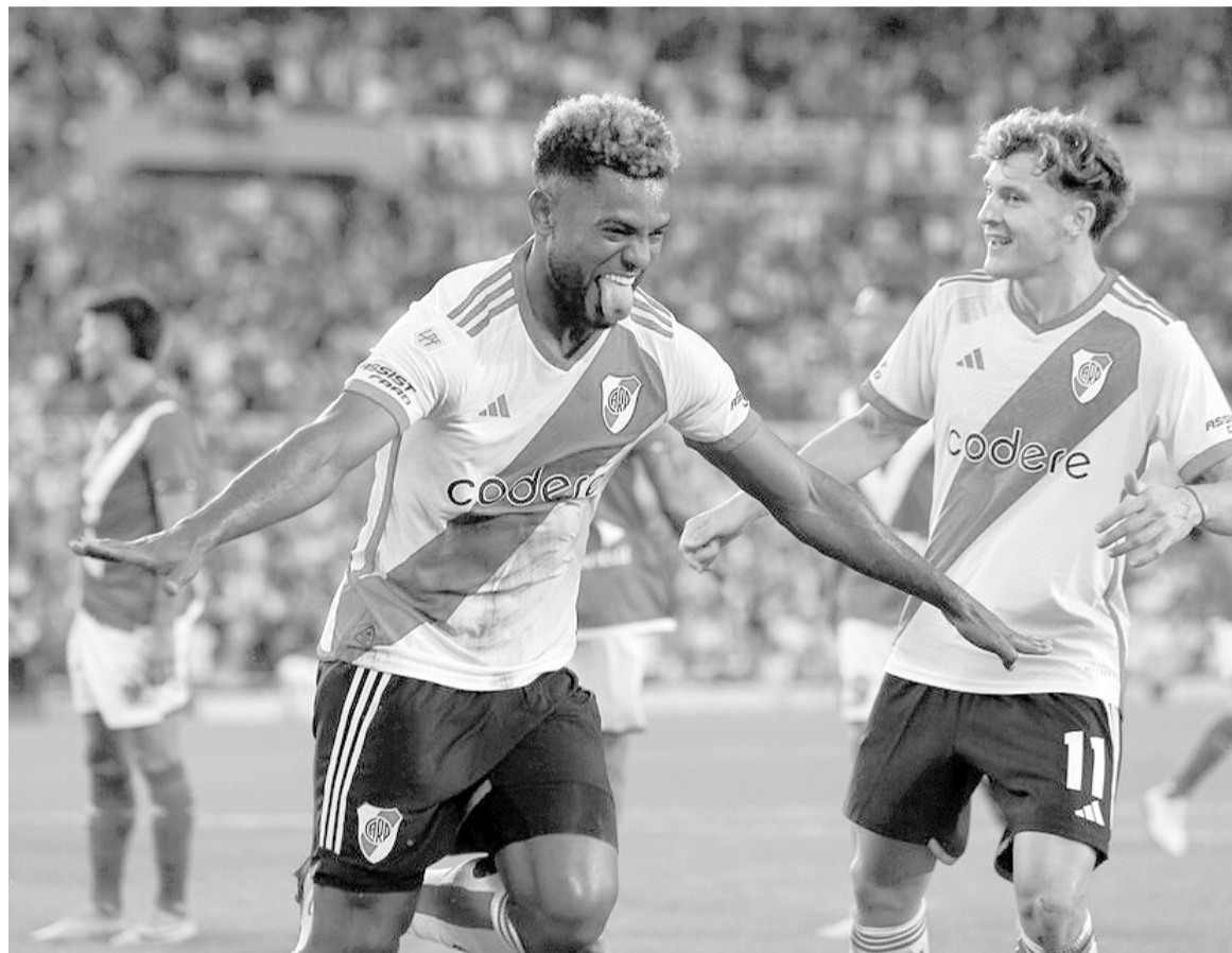
El millonario tuvo una actuación memorable. WEB

El Millonario le propinó un 5 a 0 a Vélez para la historia en el estadio Monumental. Hat-trick de Borja y doblete de Colidio para el triunfo.