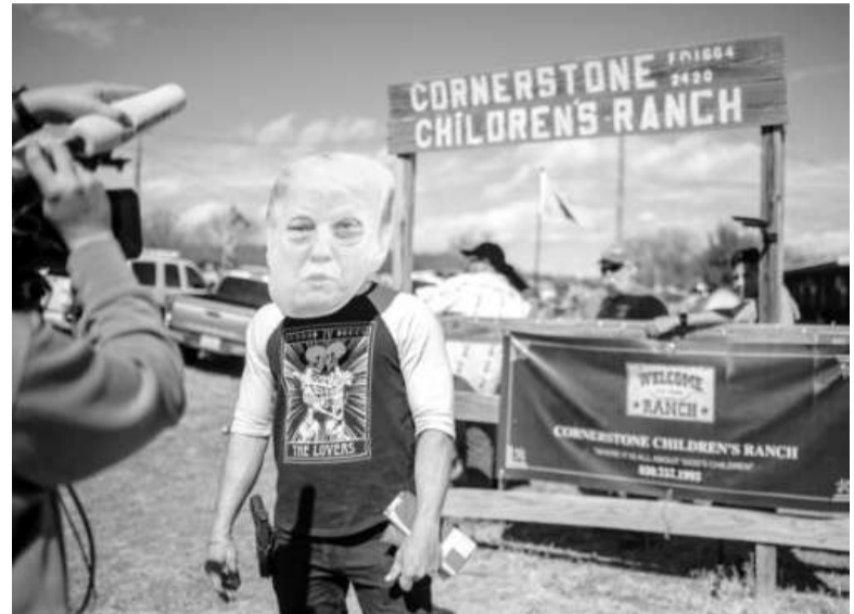
Donald Trump enfrenta un nuevo problema judicial

Los problemas legales de Trump exceden la cuestión de Colorado. Desde el 4 de marzo enfrenta un juicio penal por interferencia en las elecciones de 2020, y el 25 de marzo comienza otro proceso en su contra