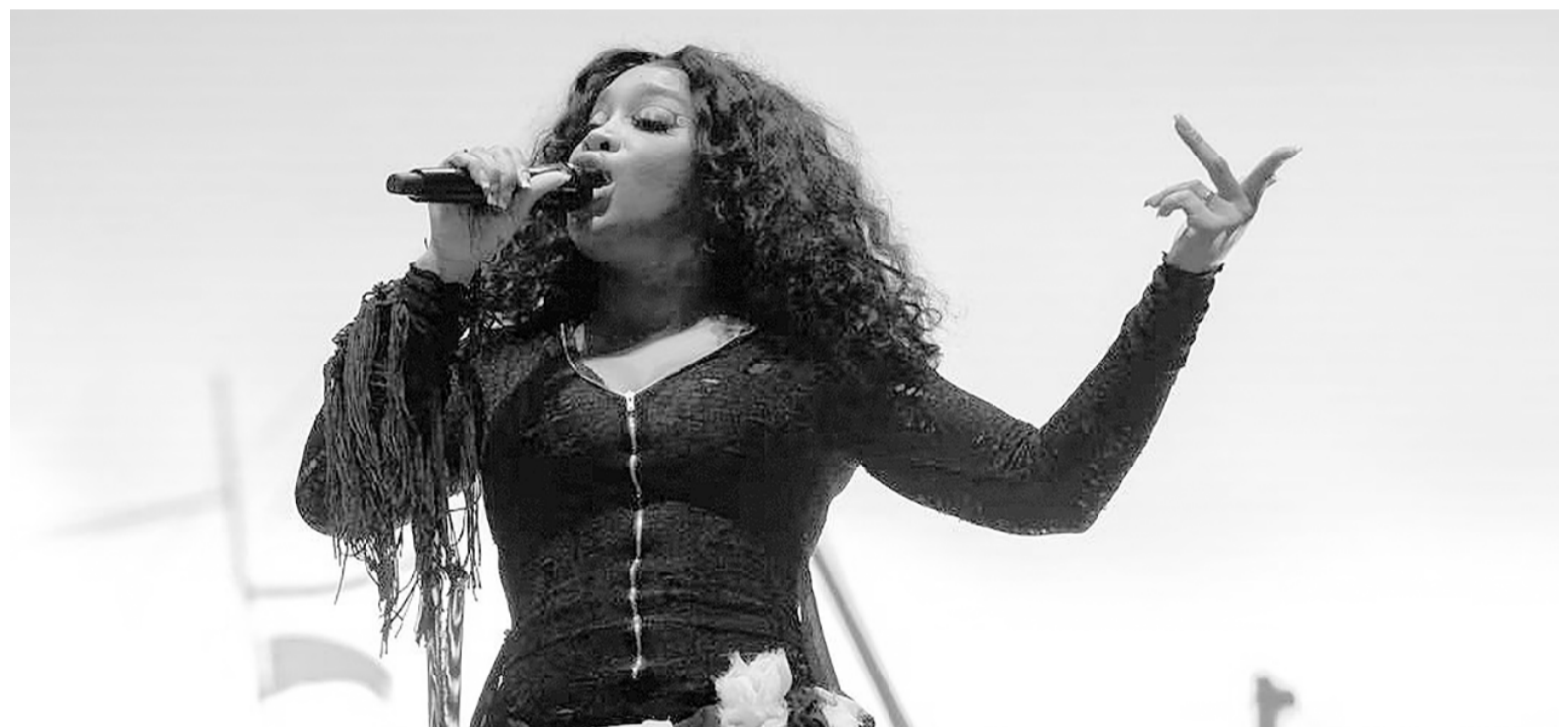
Solána Imani Rowe, conocida como SZA, está nominada en nueve categorías. ILUSTRACIÓN WEB

Con nueve nominaciones, Sza es quien se ubicó primera en el podio de las aspirantes a más premios Grammy. Le siguieron