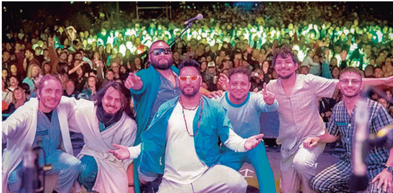
Libertinaje, una de las bandas nicoleñas con seguidores muy fieles.

Sus interpretaciones son un tributo a 'Bersuit Vergarabat', de quienes son fanáticos y profundos admiradores. "Nos transporta a la mejor época de nuestra vida. Nos emociona poder revivirla en cada canción", comentó Ba-