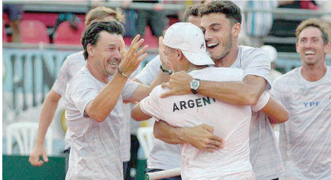
El festejo argentino en Rosario.

el dobles, pero siempre los chicos tuvieron una gran actitud. Estaba claro que la presión la teníamos nosotros y estoy orgulloso además de cómo se comportaron en la cancha, sin faltarle el respeto a nadie. Esto es para todos los que rodearon esto, para que saliera todo bien acá en Rosario, como a los que hicieron un esfuerzo enorme para comprar su entrada. Todo salió redondo", dijo a su vez muy feliz el conductor del equipo nacional, Guillermo Coria.