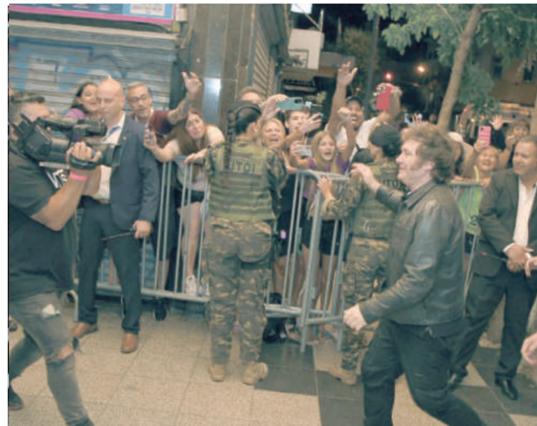
Javier Milei inicia una gira oficial, tras su visita a Fátima Flores