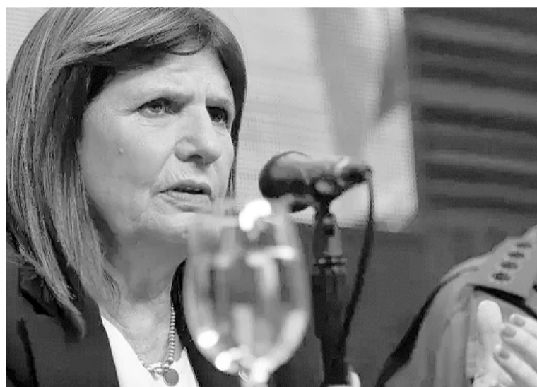
Fuerte defensa de Bullrich al operativo de seguridad en el Congreso por las protestas.

La ministra de Seguridad se refirió a los operativos desplegados durante la votación de la Ley de Bases y Puntos de Partida para la Libertad de los Argentinos.