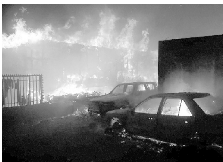
El fuego consume todo a su paso

noroeste de Santiago, fue una de las zonas más castigadas por los peores incendios forestales que vivió Chile en su historia reciente.