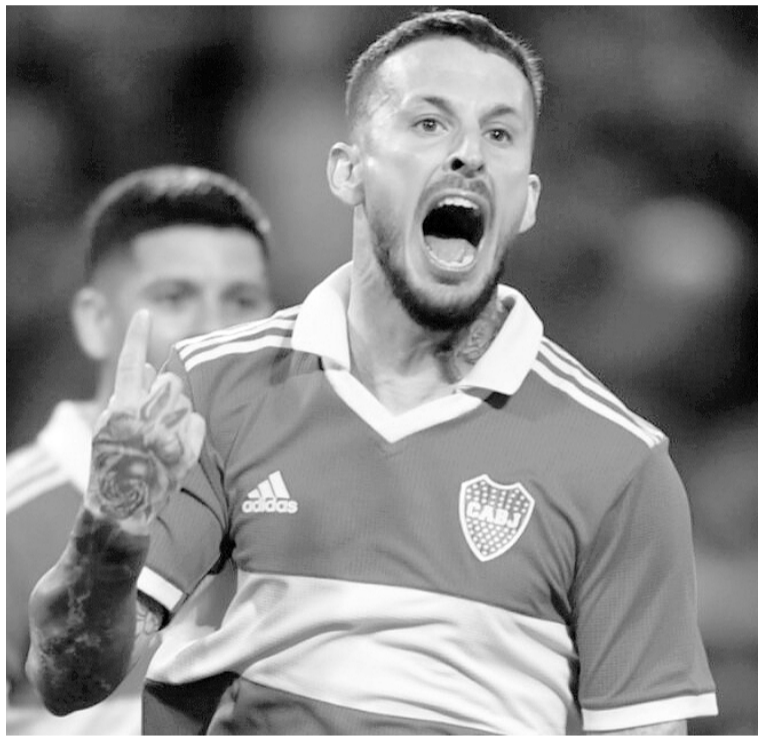
El Xeneize irá por los tres puntos en Victoria. WEB

La ausencia del goleador ex Napoli, París Saint-Germain y Manches-