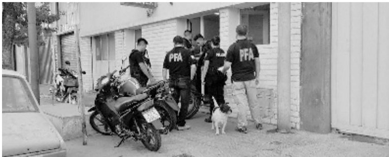
El evadido fue recapturado y trasladado a la misma comisaría de la que escapó, por razones de jurisdicción.

Un llamado de vecinos ayer domingo al mediodía al 911 dio cuenta de que se encontraba merodeando en el barrio Vía Honda uno de los evadidos de la comisaría 21ª el pasado 21 de diciembre, y se aportaron datos de cómo iba vestido.