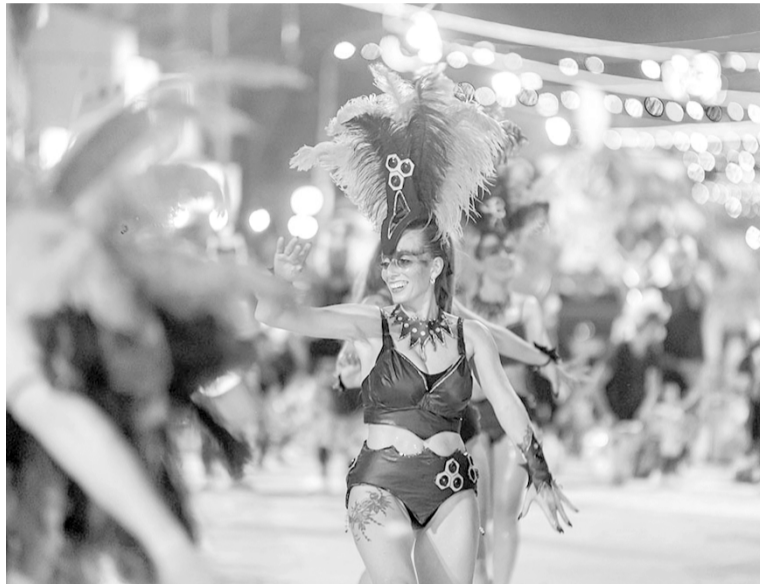
Tradición. Los carnavales de Lincoln, un clásico bonaerense que cada año atrae a miles de personas.

También en la provincia de Córdoba hubo una alta demanda