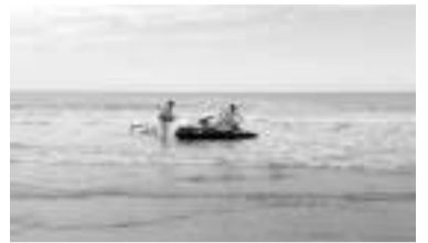
Axel Malvar se perdió en el mar. - DIB -