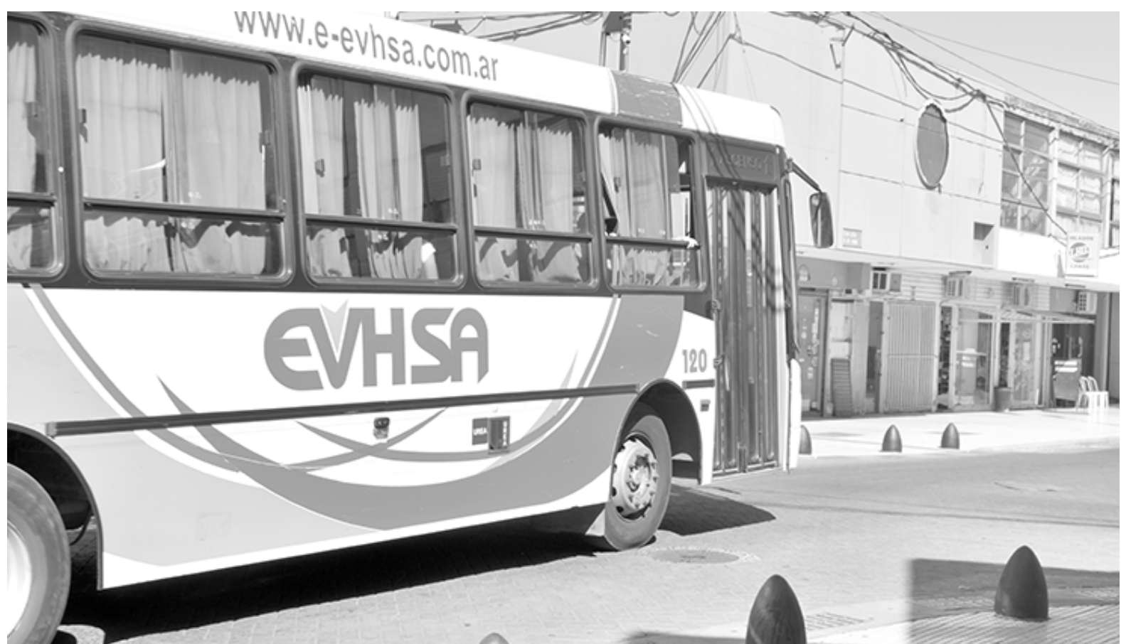
Las empresas de transporte urbano del interior del país emitieron un comunicado rechazando la “intempestiva” eliminación del Fondo Compensador.

Más allá de hacer foco en la reciente decisión del actual Gobierno, el escrito también responsabiliza a