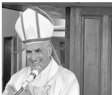
La alegría del Evangelio combate el aislamiento social

Los fieles se testimoniaron mutuamente la Fe por las calles del barrio donde los altavoces entonaban cánticos a la Virgen mientras se re-