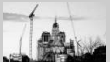
La histórica catedral se incendió en 2019.

El descubrimiento de la aguja es un simbólico hito dentro de los trabajos de reconstrucción que aún no están concluidos, consignó la agencia DPA.