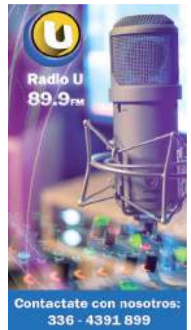
Contactate con nosotros: 336 - 4391 899

LG indica además que la participación de las provincias en la recaudación bajará porque la suba de impuestos será liderada por tributos no coparticipable, mientras que Ganancias, que es coparticipable, está afectado por la elevación del mínimo no imponible dispuesta por Massa. - DIB -