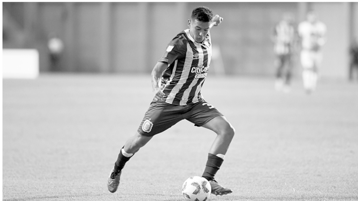
El Estadio San Nicolás recibió tres veces a Central. La cuarta se hará esperar.

Finalmente, el equipo rosarino no volverá a presentarse en nuestra ciudad, en donde el jueves pasado le ganó a Independiente Rivadavia de Mendoza 1 a 0. El Canalla regresará a su cancha para recibir a Gimnasia de La Plata el sábado.