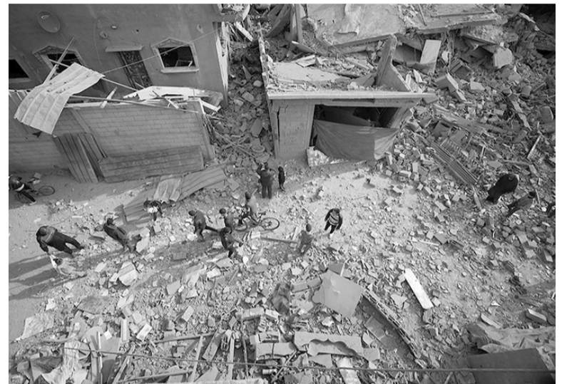
Destrozos. Zonas enteras hechas escombros.

mitirá evacuar la zona. No es correcto decir que los ciudadanos y las familias quedarán en la zona de combates. ¿Cuándo sucederá? ¿Cómo sucederá? Lo decidiremos cuando llegue el momento”, manifestó sin dar precisiones sobre la eventual ofensiva terrestre.