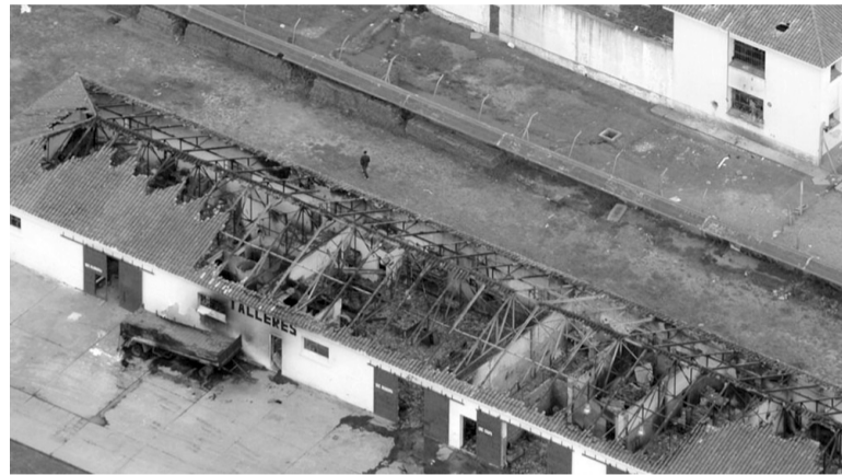
Tragedia. El fuego consumió el pabellón 16 del penal y murieron 33 presos.

El juez Soria expresó que "no se explica por qué también Santamaría, quien era, conforme a su rol, el garante especial de ese quehacer (dado que el tribunal ha asumido tal deber de garantía en todos los inter-