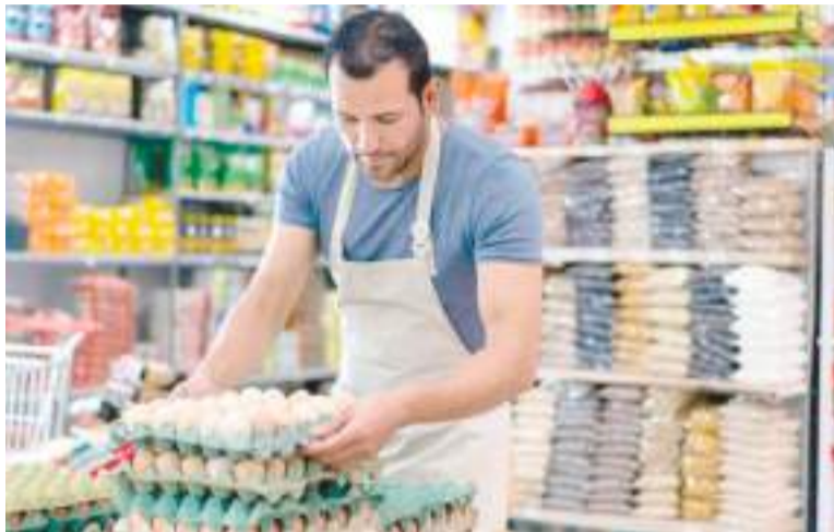
En descenso. La venta de alimentos en pequeños comercios experimenta una fuerte retracción.

Mientras las compras con dicho medio de pago generaron un movimiento de $5.966.247 millones, lo que implica una suba de un 11,1%