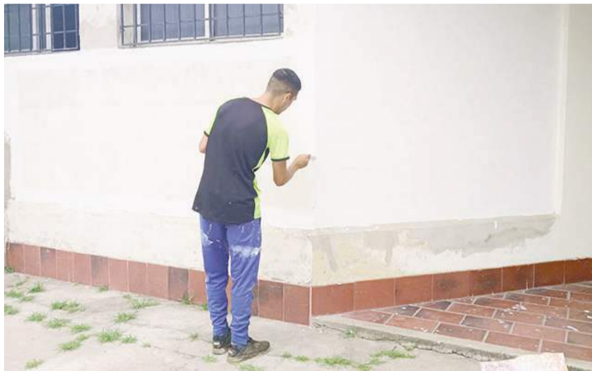
En el Hogar San Luis Gonzaga, actualmente, se encuentran realizando tareas de refacción.

Además, como parte de esta iniciativa, se está acondicionando el Hogar San Luis Gonzaga, ubicado en barrio 9 de Julio, a fin de am-