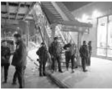
Ocurrió en una estación de subte.