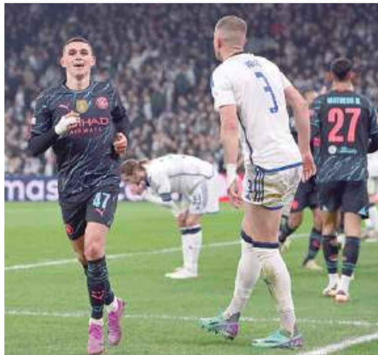
La Champions League se reanudó con los duelos de mano a mano.

Hoy jugarán desde las 17.00 PSG-Real Sociedad y Lazio-Bayern Múnich.