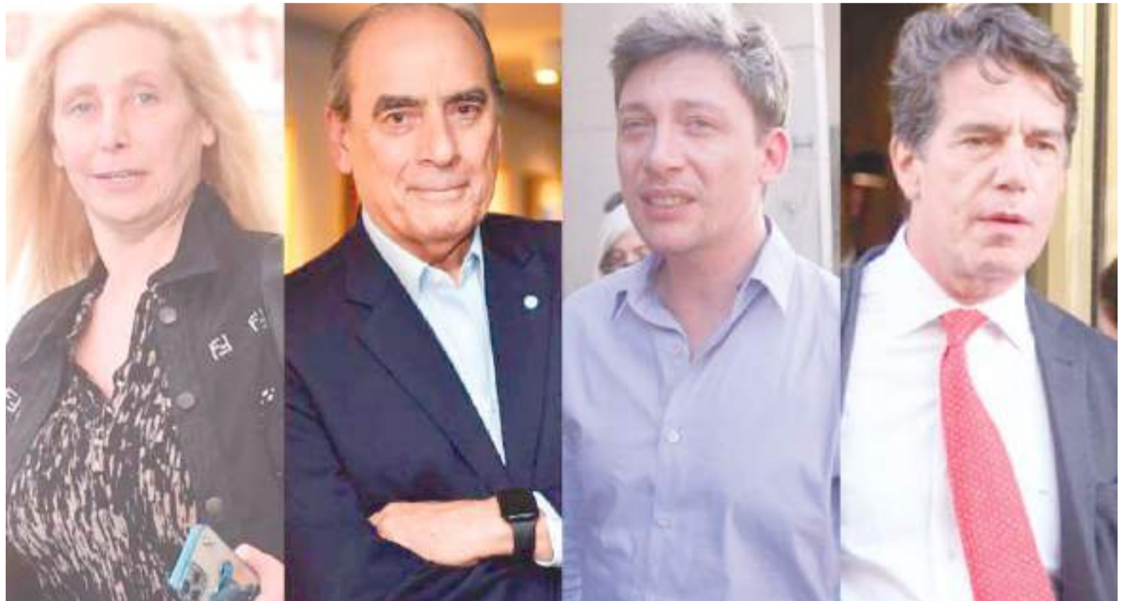
Los intocables de Milei

El plan político de Milei tiene, de movida, dos obstáculos. El primero es que, pese a que todavía no habló de cargos ni con Mauricio Macri ni con Pa-