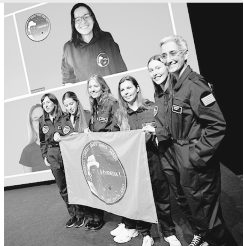
Las representantes de Hypatia han explicado que habrá una segunda edición de su proyecto, que se llevará a cabo en 2025 en el Mars Desert Research Station.

Por su parte, el alcalde de Barcelona, Jaume Collboni, ha recalado que «Hypatia se establece como un proyecto con