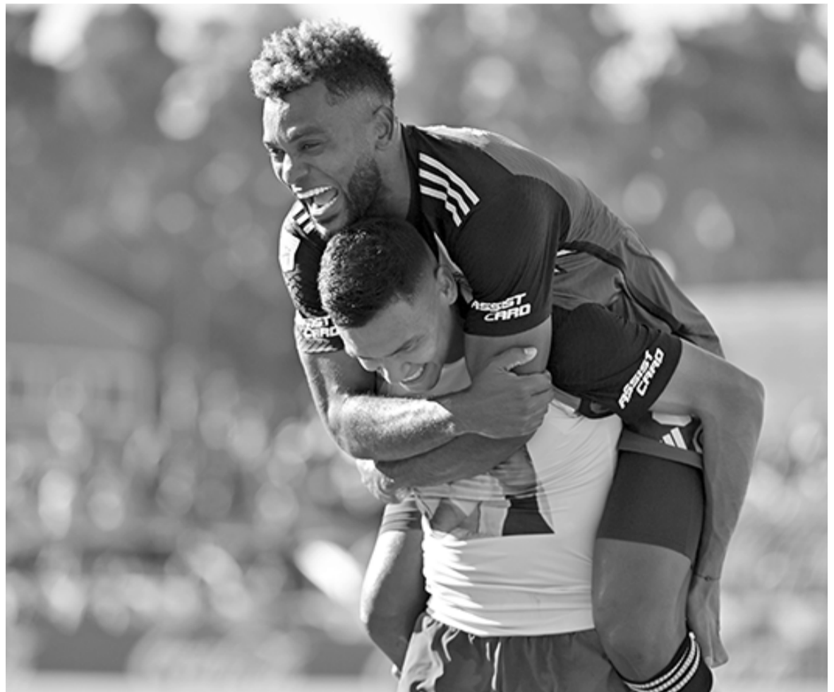
River es uno de los equipos de mejor rendimiento hasta aquí en el torneo.