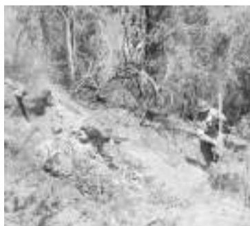
336 personas combaten el siniestro.

Los incendios comenzaron el jueves 25 de enero por la noche, con dos focos muy próximos uno del otro, en cercanías del arroyo "El Centinela" sobre la parte alta de la cordillera chubutense y se extendió hasta superar los límites del Parque Nacional Los Alerces, lo que transformó al siniestro en