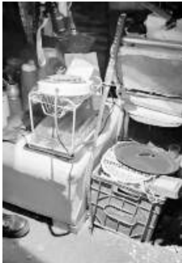
El arma utilizada para cometer los crímenes.

De acuerdo a lo recogido por los pesquisas, el agresor huyó en una de las tres bicicletas que había en la casa y ayer era intensamente