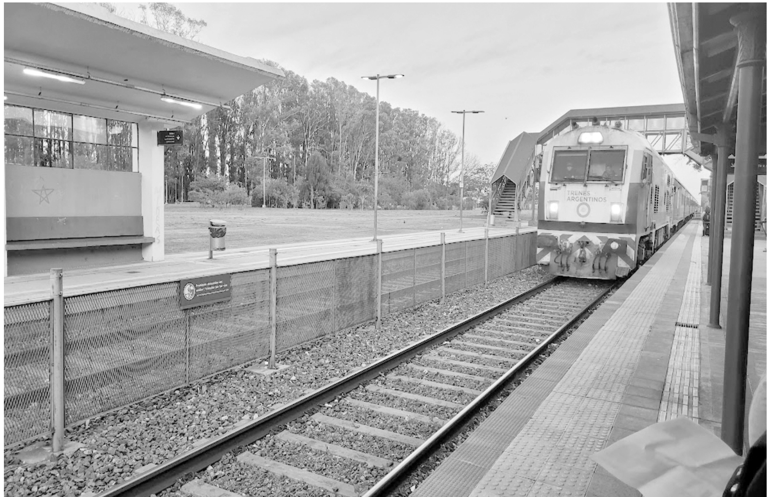
La estación San Nicolás es punto de partida para un importante número de nicoleños que viajan en tren a Buenos Aires y Rosario.

La gestión anterior había hecho bandera de los trenes de larga distancia, aunque sólo pudo realizar