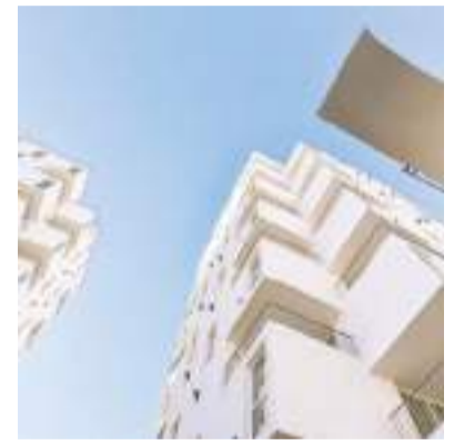
La vivienda, otra preocupación para la clase media.

"La gente puede hacer el contrato por el tiempo que quiera, con la moneda que quiera, con la cláusula de indexación que quiera. Entonces en las tres o cuatro semanas posteriores a la emisión del DNU, el precio de los alquileres cayó 20%, volvieron a aparecer las propiedades y se volvió a armar el mercado", manifestó Sturzenegger hace una semana en un encuentro del Foro Panamericano de la