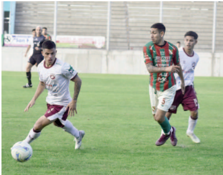
El Granate viene de empatar ante Las Parejas en San Nicolás.