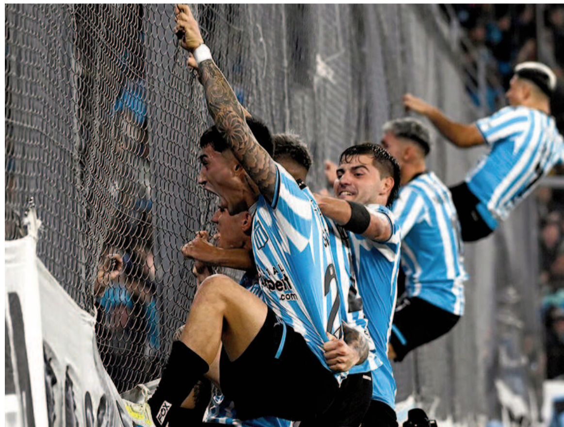
El equipo de Gustavo Costas consiguió una sufrida victoria como local.

En el estadio Juan Domingo Perón de Avellaneda, la "Academia" le ganó al "Malevo" con gol de Santiago Solari en tiempo adicional 1 a 0 y por ahora es único líder con diez puntos.