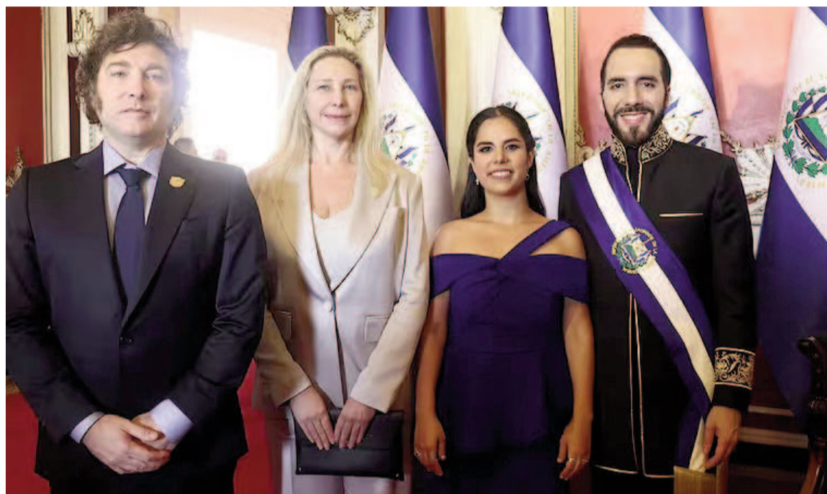
Javier y Karina Milei en El Salvador junto a Nayib Bukele y su esposa.

A lo largo de la jornada, el mandatario argentino se encontró con los diferentes líderes internacionales que asistieron a la juramentación. Entre ellos el rey de España, con quien tuvo un breve gesto de cordialidad en medio de la crisis diplomática con el país, que se desencadenó a partir de una pelea con su par Pedro Sánchez. A pesar de la tensión, el monarca hizo un contacto visual con Milei antes de sentarse y, al verse, ambos se sonrieron y sa-