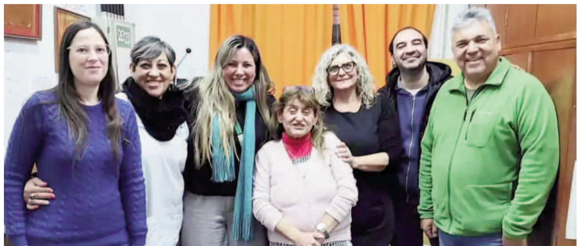
Organizadores de las ferias junto a la directora de Cultura.