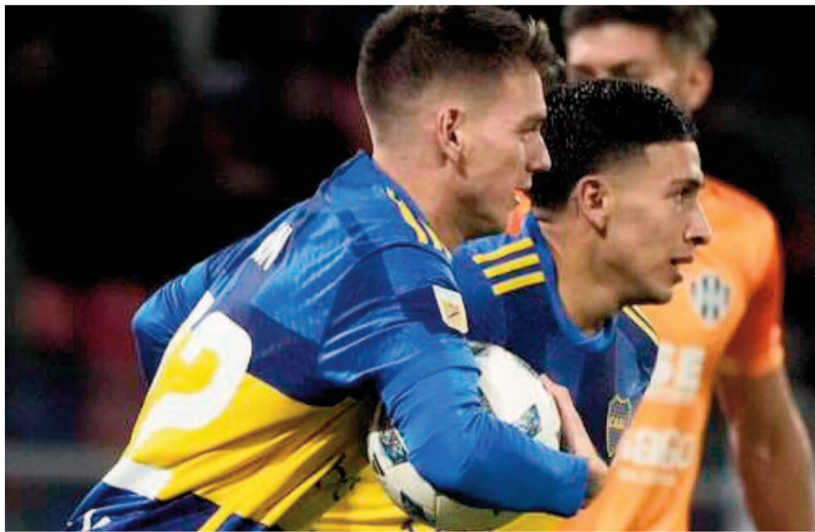
Boca irá por un triunfo ante el Calamar en rodeo ajeno.