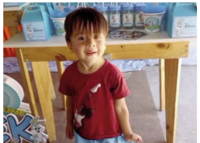
Nueva jornada de rastrillajes por la desaparición de Loan.

La Justicia también ordenó una cámara Gesell a la hija de 14 años