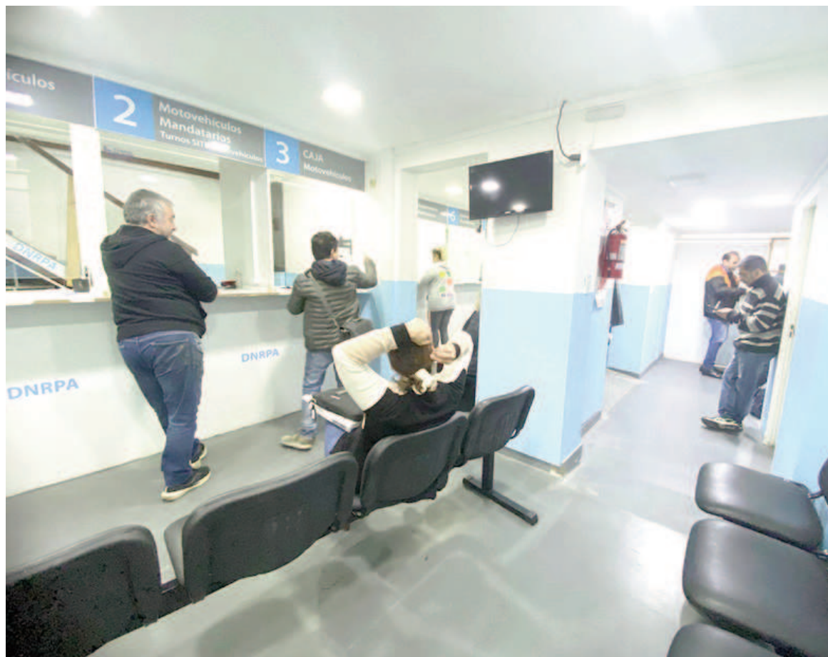
Ninguno de los dos registros operativos en San Nicolás integra la lista de las dependencias disueltas.

“La medida propuesta obedece en principio a la necesidad de reorganizar la estructura de los Registros Seccionales en razón de que existen distintas jurisdicciones territoriales en las que, existiendo Encargados Titulares de Registros Seccionales en sus distintas competencias, al mismo tiempo esos funcionarios revisten el carácter de Interventor de uno o dos de los Registros Seccionales de las restantes competencias”, indica la resolución entre sus considerandos.