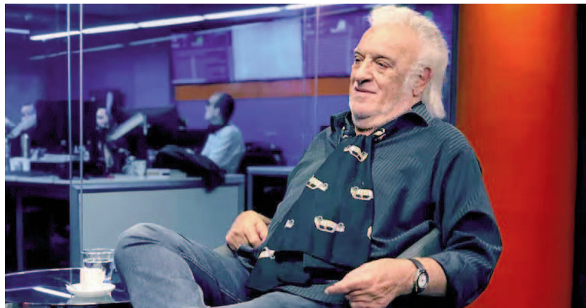
Coco Basile, gloria de Racing y exentrenador de la selección argentina.

El exentrenador de la Selección argentina y gloria de Racing debió ser atendido el pasado viernes. Actualmente se encuentra compensado en una clínica especializada en neurología.