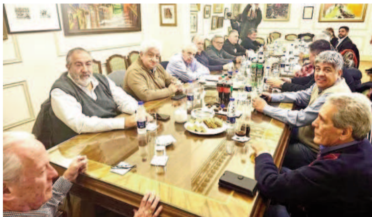
La mesa chica de la CGT deliberó en la sede de UPCN luego de un largo paréntesis.

El encuentro tuvo lugar luego de largas semanas de intrigas y peleas entre el sector dialoguista y la fracción dura por la posición ante la Ley Bases y la movilización del 12 de junio organizada por el kirchnerismo y la izquierda ante el Congreso, que terminó con incidentes. Curiosamente, una decena de dirigentes que integran la mesa chica cegetista criticaron esta tarde al periodismo por informar sobre esas diferencias y coincidieron en destacar que "no existen divisiones" en la central obrera. El moyanismo está asociado al sindicalismo kirchnerista dentro de la CGT y busca profundizar el enfrentamiento con la Casa Rosada, en la misma sintonía que el barrionuevo. Sin embargo, el sector dialoguista, que es mayoritario e integra "los Gordos" y los independientes, fue el que negoció el recorte de 42 artículos de la reforma laboral en la Ley Bases y busca una instancia de diálogo con el Gobierno para atenuar el ajuste y la reforma del Estado.