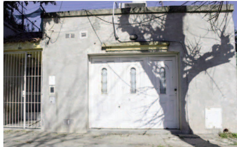
Frente de la vivienda baleada en zona sur.

El caso quedó en manos de la Fiscalía en turno.