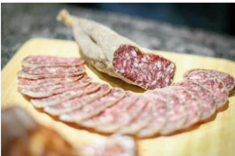
Tres brotes de triquinosis confirmados en lo que va del 2024.

El segundo brote corresponde a Mar del Plata, partido de General Pueyrredón, registrado el 25 de junio.