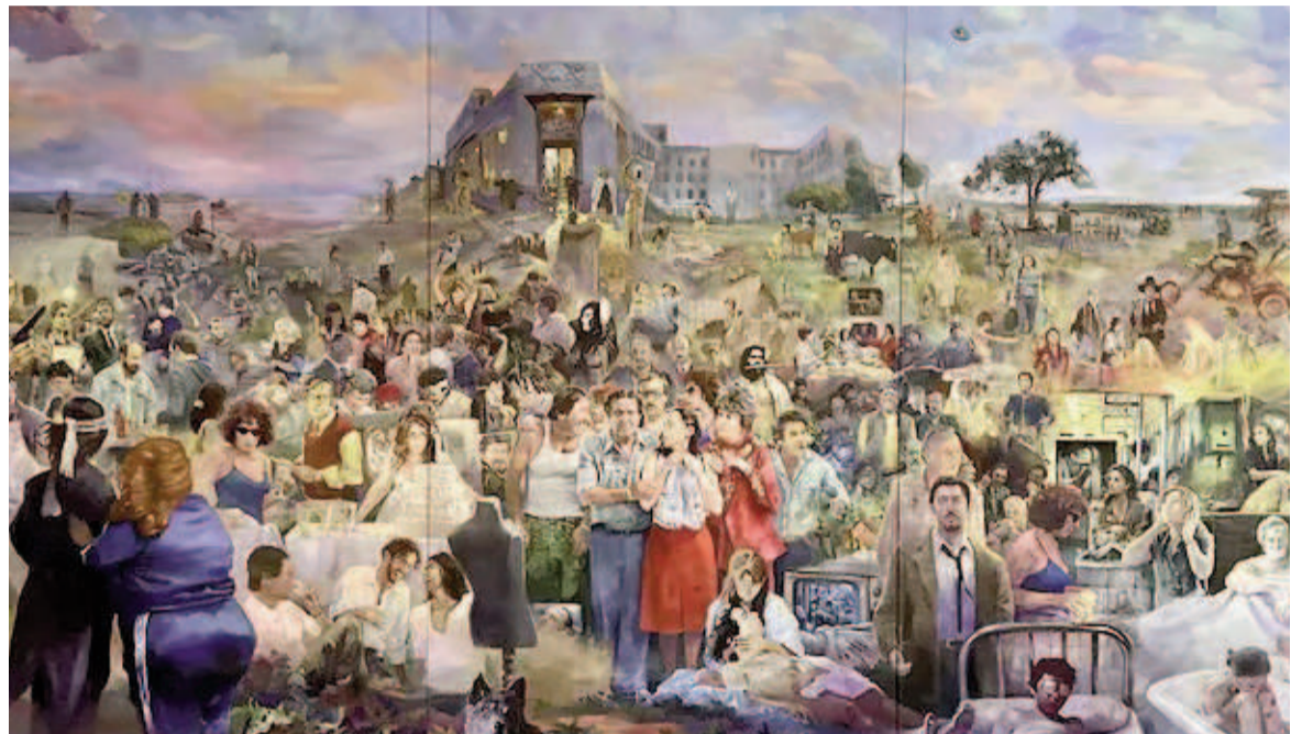
Un mural retrata más de cien películas argentinas, en un homenaje del artista Andy Riva al cine nacional.

Uno de los criterios para elegir las películas fue que hayan sido estrenadas después de 1970. Desde DAC, le sugirieron entre 12 y 15, pero Riva pasó un mes y medio investigando para ampliar la selección, que terminó abarcando más de cien. El diseño estuvo inspirado en obras como los murales de Diego Rivera, o la famosa tapa de "Sgt. Pepper's Lonely Hearts Club Band" de The Beatles, donde se combinan múltiples personajes y escenas en una sola imagen. Andy tiene 43 años y además de