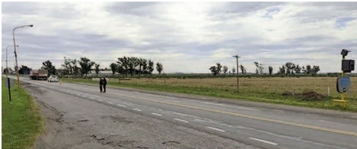
En la Ruta 34 a la altura de Luis Palacios suele haber controles de Gendarmería.

Delinquentes simulaban llevar adelante un control vehicular en la Ruta Nacional 34, a la altura de la localidad de Luis Palacios: frenaron un colectivo que se dirigía a Jujuy y al subir asaltaron a los 19 pasajeros que se encontraban a bordo. El chofer aseguró ante la policía que se detuvo porque creyó que se trataba de un