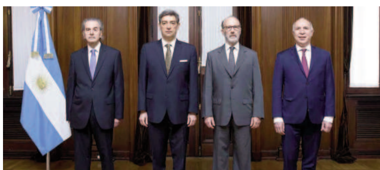
El Gobierno trabaja en la ampliación del máximo tribunal.

En junio de 2022, un grupo de mandatarios provinciales peronistas y aliados presentaron al aquel entonces presidente Alberto Fernández la propuesta para conformar un tribunal supremo de 25 miembros (uno por provincia más un representante nacional y que cumpla con la paridad de género). Algunos meses después, la Cámara de Senadores le otorgó media sanción al dictamen de mayoría, pero con modificaciones acordadas previamente que reducían a