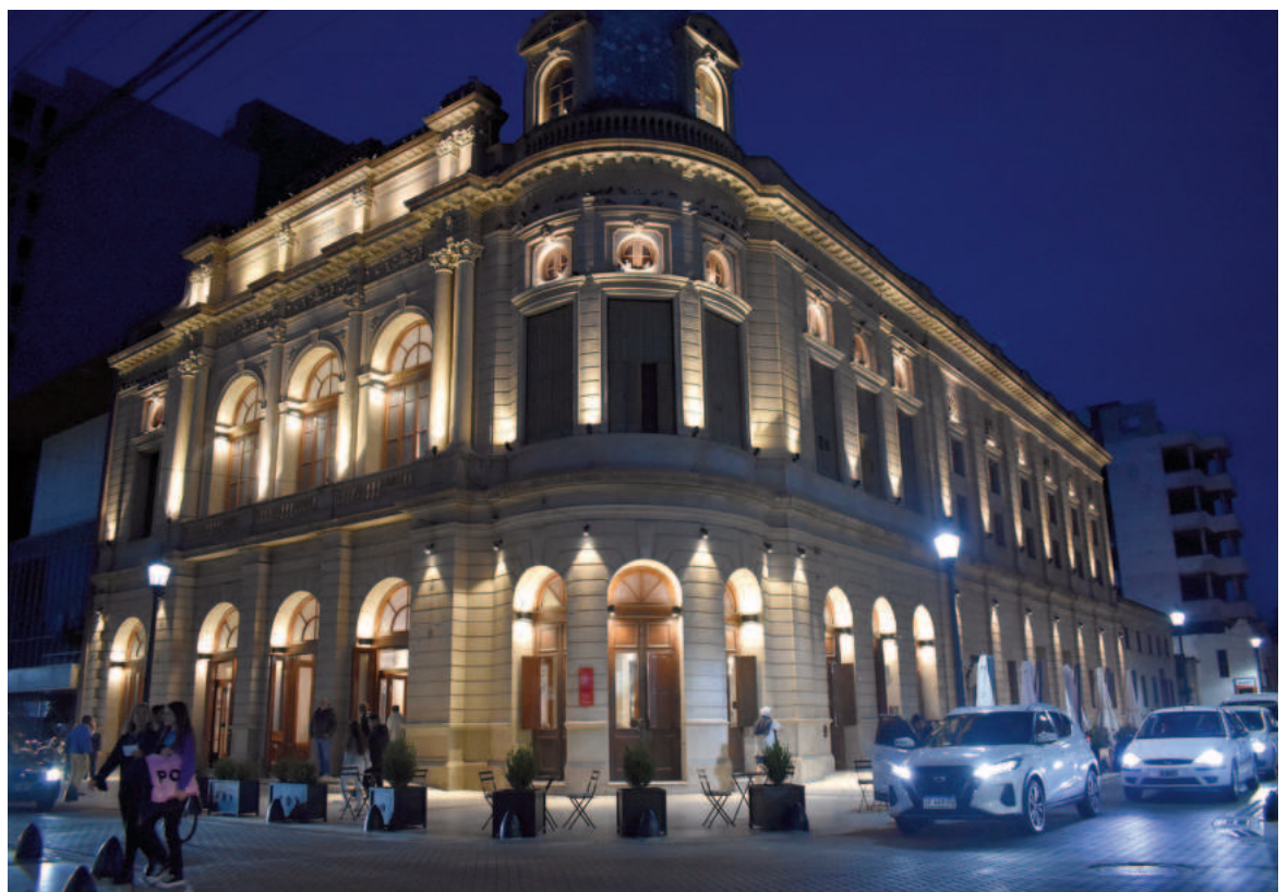
Las ventas de entradas, disponibles en la boletería del Teatro, serán a beneficio de Manos que Dan.

De ese modo, se invita al público a disfrutar de un recorrido por las obras más destacadas de Carlos Gardel y Astor Piazzolla, entre otros, estilizadas en la formación de cuar-