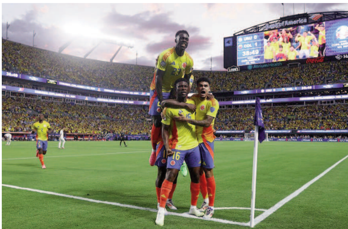
El conjunto cafetero resistió con uno menos y se clasificó finalista.