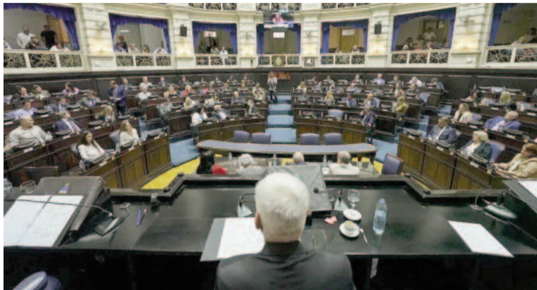
UP dio media sanción a la creación de una empresa de emergencias de salud.

La Cámara de Diputados provincial sesionó esta tarde y Unión por la Patria dio media sanción a la creación de una empresa de emergencias de salud, una de las propuestas de Axel Kicillof y su ministro Nicolás Kreplak que más controversia generó en los últimos meses. La sesión estaba prevista para las 15:00 pero dio inicio alrededor de las 17:00. En ese ínterin, el oficialismo terminó de pulir el acuerdo con el sector de Unión Renovación y Fe, uno de los sectores libertarios que se diferencian de los más ortodoxos por su vocación de diálogo con otros actores del arco político. Vale recordar que la propuesta tuvo dictamen favorable de Unión por la Patria en las tres comisiones por las que pasó, pero tanto el PRO como la UCR+Cambio Federal y la izquierda presentaron dictámenes de minoría. Tras la negativa de todos los bloques, UP dependía de las voluntades del bloque libertario dialoguista, desde donde dieron un ultimátum y exigieron una serie de propuestas para cambiar en el texto original en relación a los organismos