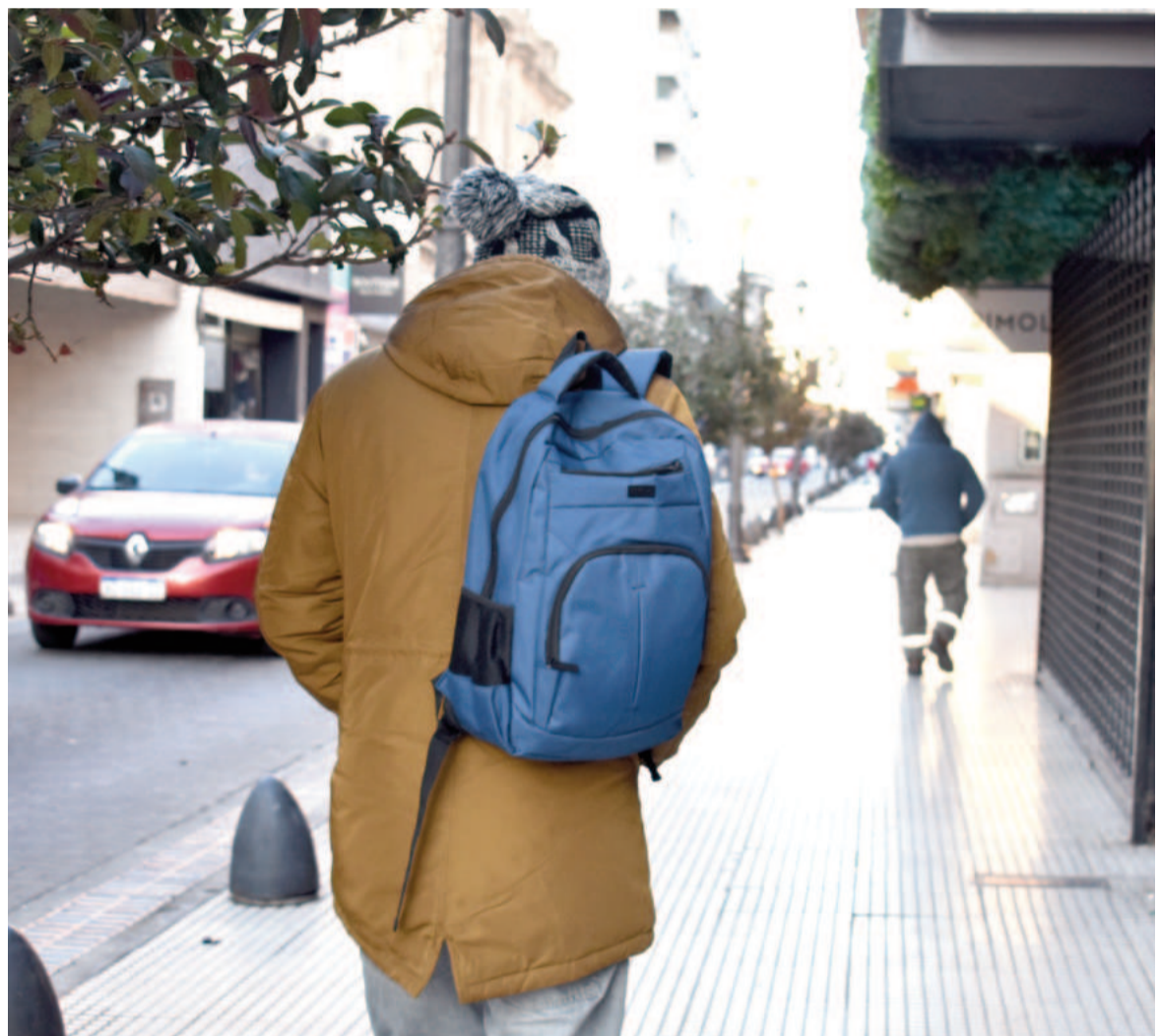
En cuanto a lo que resta de la semana, hasta el domingo inclusive todas las mínimas que se esperan están por debajo del cero.

El frío puede ser peligroso para la salud. Es importante tomar medidas para protegerse y cuidar a los más vulnerables.