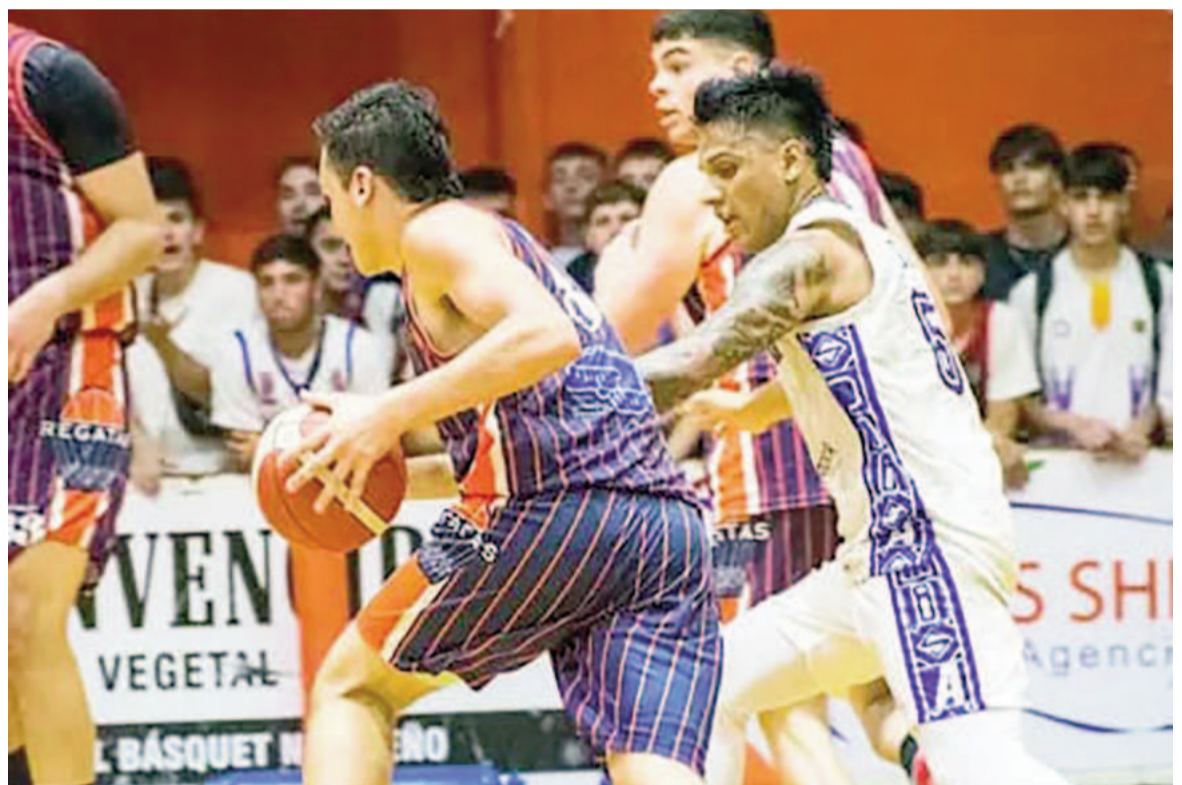
Regatas y Somisa definieron el Prefederal de la Región CAB 1 en la temporada pasada.

El viernes 26 de este mes cerrará la inscripción, la que tendrá un costo de $150.000. En cuanto al formato de juego, se adelantó que el campeonato se dividirá en dos zonas, Norte y Sur. La Norte estará conformada por equipos de las asociaciones afiliadas a las Regiones Deportivas CAB 1, 8 y 9. Allí estarán incluidos, en consecuencia, los de la Asociación de San Nicolás, junto a las de Junín, Pergamino, La Plata, Chivilcoy y Zárate-Campana, entre otras. En el Sur, en tanto, se ubicarán los competidores de las asociaciones