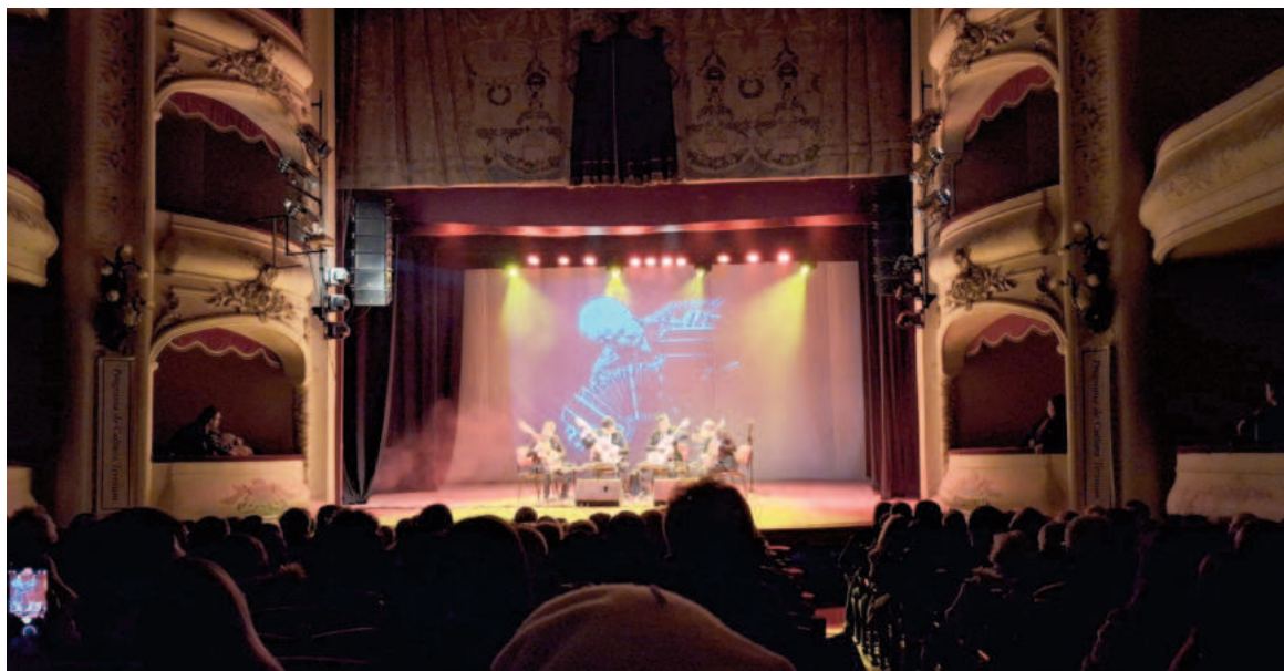
“La noche porteña” llenó la sala con las emblemáticas melodías de Carlos Gardel y Astor Piazzolla.

Con la participación de 460 espectadores, “La noche porteña” llenó la sala con las emblemáticas melodías de Carlos Gardel y Astor Piazzolla. Este espectáculo de tango interactivo, combinó las presentaciones del