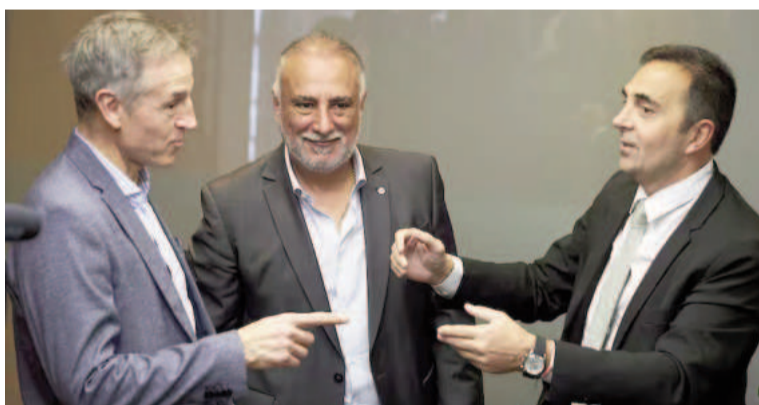
El secretario de Trabajo recibió a un grupo de dirigentes de la CGT.

El Gobierno intentará que el nuevo impuesto a las ganancias, que cambia las escalas y restituye la cuarta categoría, sea reglamentado en lo que queda de esta semana, según señalaron distintas fuentes oficiales. La modificación del tributo, que afectará a más de 800.000 trabajadores, es una prioridad de la gestión de Javier Milei que -pese a hablar de los impuestos como un "robo"- necesita robustecer la recaudación. Se trata del capítulo más controvertido de la ley fiscal que sancionó el Congreso el 28 de junio. La cúpula de la CGT le reclamó ayer a la administración libertaria que subiera el mínimo no imponible para morigerar el impacto sobre los ingresos. Y hay gremios y gobernadores que ya advirtieron que planean judicializar el impuesto. Pese a estos planteos, el Gobierno avanzaría igual con los pisos que están previstos en la ley. "Se está trabajando, debería salir esta semana", dijo una fuente muy al tanto de los movimientos del Ministerio de Economía y la AFIP. La reposición de la cuarta categoría obligará a tributar Ganancias a los trabajadores en relación de dependencia que sean solteros y tengan ingresos desde $1.800.000 brutos; y los empleados casados y con dos hijos desde $2.340.000. En tanto, las alícuotas