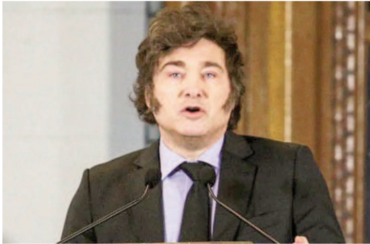
Javier Milei se refirió al atentado a la AMIA acusando a Irán.

“Nosotros hoy elegimos la palabra, no el silencio; elegimos alzar la voz, levantar los brazos. En definitiva, elegimos la vida, porque no le hacemos el juego a la muerte. Estamos impulsando una ley para extender el juicio en ausencia a delitos de extrema gravedad, entre los que se encuentra el financiamiento del terrorismo, lo cual per-