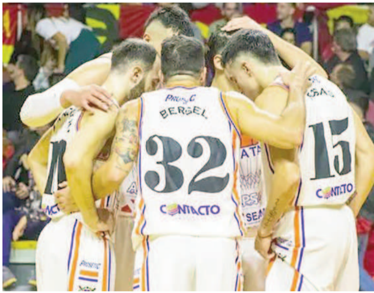
Regatas se quedó sin la invitación a la Liga Argentina.

En la nota que le envió a Regatas y que lleva la firma de Sergio Guerrero, la AdC informó: "Luego de un análisis preliminar por parte de la Mesa Directiva de esta Asociación de Clubes, se determinó que (Regatas) no cumple con las condiciones mínimas requeridas para los equipos que participarán en dicha temporada, lo que no permite autorizar la con-