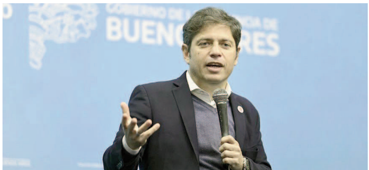
Aumenta el rechazo a la gestión del gobernador Axel Kicillof.

Cuando la consultora cruzó las respuestas de apoyo (36%) y rechazo (55%) de las variables consultadas sobre Kicillof, es evidente la fuerte polarización política bonaerense, con sus núcleos duros muy marcados y una relativa-