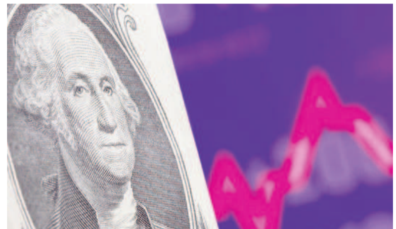
El dólar, en todas sus variantes, volvió a subir.

El dólar tarjeta o turista, y el dólar ahorro (o solidario) se ubicó a $1.505,60. El dólar cripto o dólar Bitcoin operó a $1.335,99.