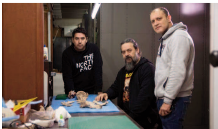
Investigadores del Museo Ciencias Naturales de la Universidad Nacional de La Plata (UNLP) participaron del descubrimiento.

Este descubrimiento y los resultados obtenidos representan un