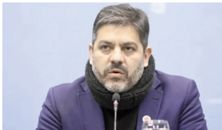
Carlos Bianco, ministro de Gobierno provincial.

En esa dirección, el ministro Carlos Bianco se refirió a la reacción de «los mercados» financieros pero apuntó principalmente al impacto de las políticas macroeconómicas en la industria y el empleo: «Los mercados, no sé si decirlo impersonal o decir aquellas personas que manejan la timba financiera, en la mayoría de los casos, se han dado cuenta que las promesas que hizo el gobierno nacional sobre la solidez del esquema financiero no es tal y han tenido una reacción negativa» dijo. «No son