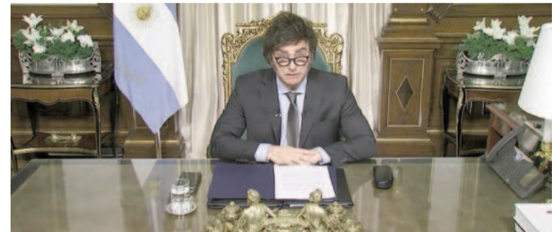
El presidente Javier Milei promulgó ayer la Ley de Bases.

A través de los Decretos 592 y 593, la administración libertaria promulgó la ley y el paquete fiscal en la previa de la firma del Pacto de Mayo.