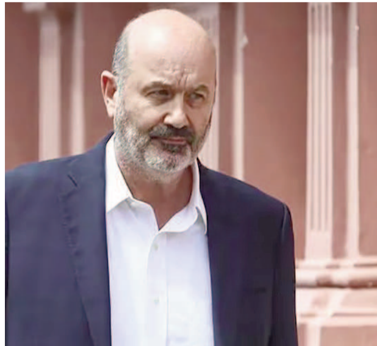
Federico Sturzenegger se retira de la Casa Rosada.

Además hubo espacio para hablar de otra propuesta reciente que hizo Sturzenegger, la de implementar un "examen de ingreso para poder trabajar en el Estado", que también tuvo impacto y generó adhesión y rechazos: "Hoy hay un proceso de selección, digamos que son "concursos". Pero yo quiero que sea un examen objetivo, donde lo superas y estás habilitado para entrar a la administración pública; debe ser anónimo y objetivo, para que no pueda ser manipulado ni de un lado ni del otro".