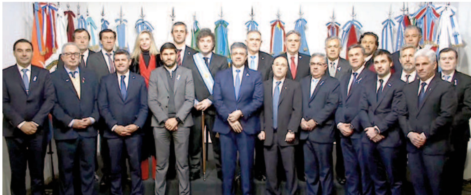
El primer mandatario Javier Milei junto a gobernadores y funcionarios, con quienes rubricarán el Pacto de Mayo.

Estaba previsto para el 25 de Mayo, aniversario de la revolución