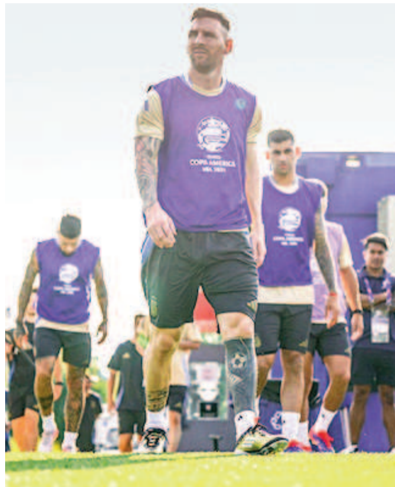
Messi encabezará el ataque de Argentina ante Canadá esta noche.

Este será el tercer cruce entre ambas selecciones, con un saldo totalmente positivo para los argentinos. El primer antecedente se remonta a 2010, cuando la Argentina dirigida por Diego Maradona ganó 5 a 0 antes del Mundial de Sudáfrica y el último fue en el partido inaugural de esta Copa América, con victoria 2 a 0 para los de Scaloni.