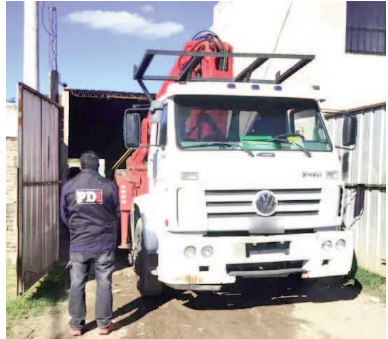
Los transformadores se sacaban en grúas y con equipos especializados.

La Fiscalía continúa trabajando en la identificación de otros posibles implicados en esta red criminal, cuyo modus operandi ha causado un notable impacto en la comunidad y en el servicio de energía eléctrica en la región.