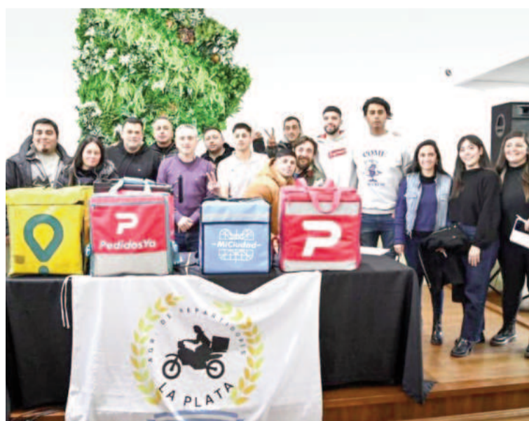
Encuentro entre trabajadores de aplicaciones de reparto de alimentos y funcionarios.

En el encuentro escuchamos las necesidades que plantearon y pusimos a disposición las herramientas del Estado que permitan consolidar su organización y avanzar en mejorar las condiciones de trabajo.»