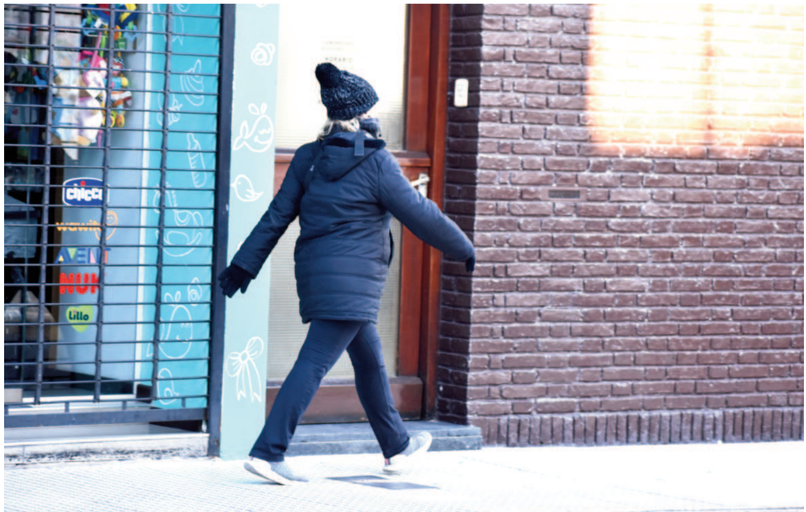
Para este martes los pronósticos para San Nicolás indican que durante la madrugada la mínima se ubicará en los -2 grados centígrados.

La llegada del frío no da tregua y las marcas térmicas recolectadas hasta el momento ya dictan un nuevo hito. Sucede que las temperaturas vividas en las últimas semanas se establecieron en repetidas ocasiones bajo los cero grados centígrados, acompañados de heladas y la entrada de aire polar. Esta combinación de factores lleva a que los vecinos y vecinas de la ciudad estén vivenciando el invierno más frío en años. Según informó el sitio especializado, "Avisos Meteorológicos San Nicolás" (AMSN), las estadísticas marcan que el piso anterior se produjo en julio de 2021 cuando la mínima se estableció en los -1,9 grados. Un registro que sería menor en los próximos días. Vale resaltar que en la misma estación, pero de 2022 y 2023, los termostatos llegaron a denotar "suelos" de -1 y 1,1 grados, respectivamente.