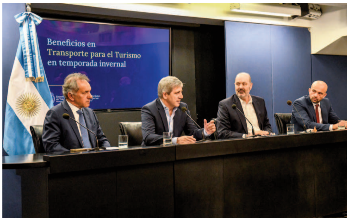
“Argentina Emerge”: las claves del programa para fomentar el turismo que reemplazó al Previaje.

Entre las promociones más destacadas del programa se encuentran descuentos de hasta el 50%, promociones del tipo “4x3” en alo-