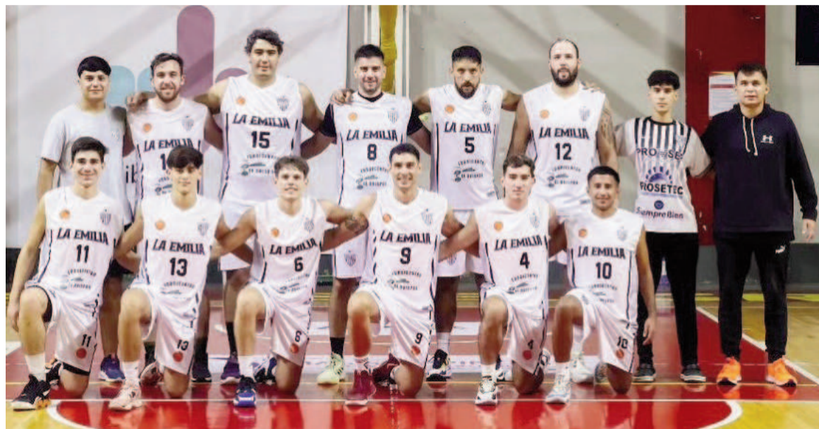
La Emilia está a una victoria de lograr su primer campeonato en la Primera local.

Ya Los Andes completó su participación en el torneo y por ahora está en lo alto de la tabla. Si La Emilia supera a Mitre, lo alcanzará,