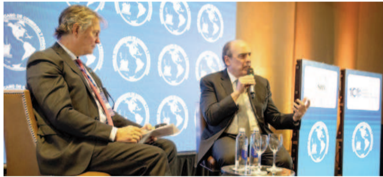
Francos, junto a empresarios.

El ministro coordinador destacó que "es la primera vez que veo a un presidente con la convicción clara de lo que hay que hacer y con el coraje para hacerlo. El pueblo argentino abra-