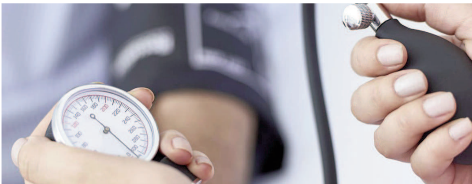
La ola de aire frío puede afectar la salud de las personas de diferentes maneras. Un efecto es la suba de la presión arterial. ILUSTRACIÓN

Una ola prolongada de frío intenso está golpeando gran parte del territorio de la Argentina. Nueve de las 24 jurisdicciones que conforman el país está bajo alerta roja, un indicador que significa que las bajas temperaturas pueden impactar en la salud de las personas, incluso las que están sanas. Uno de los efectos negativos de las bajas temperaturas es que hay más chances de que suba la presión arterial, que es la fuerza de la sangre al empujar contra las paredes de las arterias. Cada vez que el corazón late, bombea sangre hacia las arterias. Lo ideal es tener la presión arterial por debajo de 135/85 mmHg, y hacerse controles periódicos.