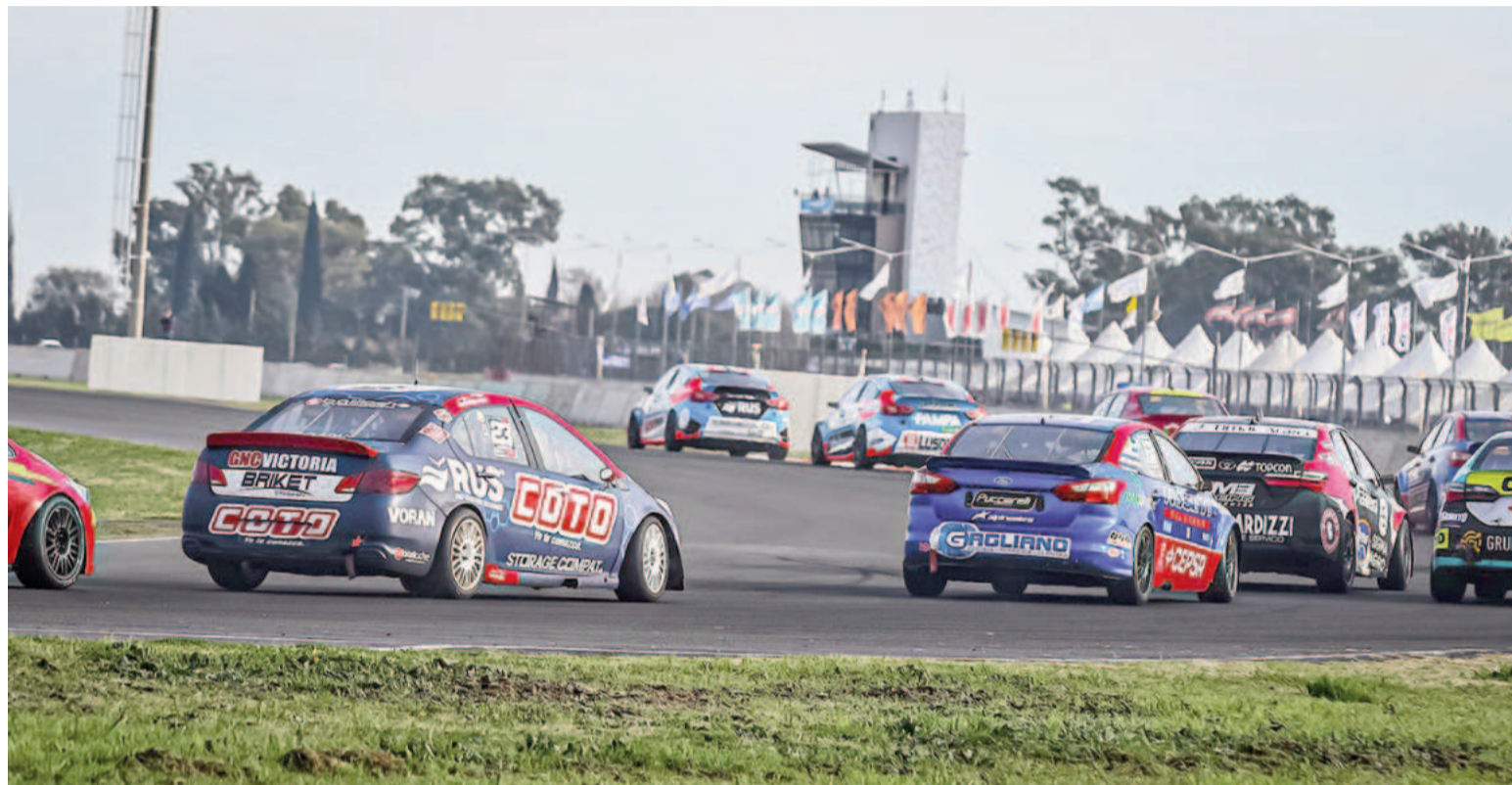
El Turismo Nacional llega a San Nicolás por quinta vez con sus interesantes espectáculos y la pasión de sus seguidores.

Stefano Domenicali, CEO de la F1, resaltó el éxito del formato sprint, señalando su impacto positivo en la audiencia y la asistencia de aficionados. "El sprint ha sido un gran éxito para la Fórmula 1, aportando más acción y competencia en la pista. Mientras nos preparamos para celebrar nuestro 75 aniversario en 2025, siempre honraremos nuestra increíble historia, pero debemos innovar y mejorar para ofrecer lo mejor a nuestra creciente y diversa base de aficionados", comentó Domenicali.