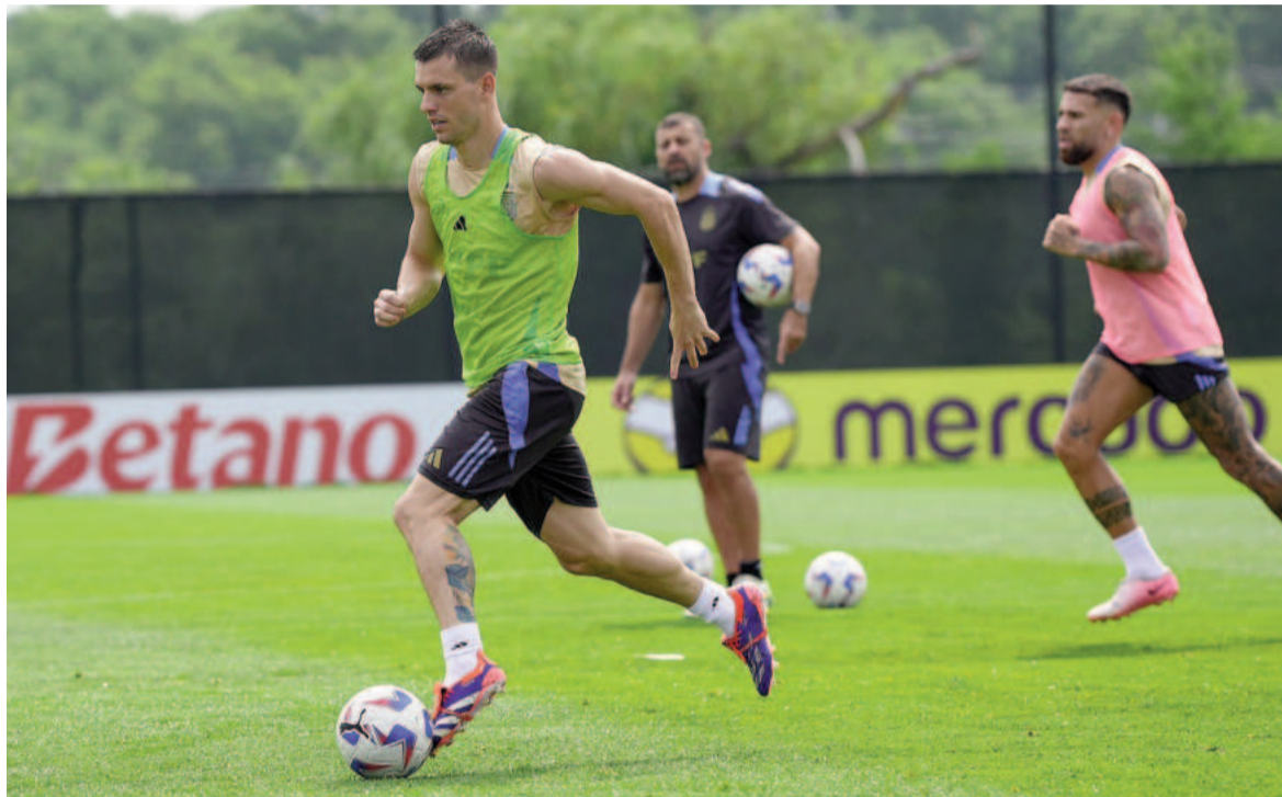
La Selección disputará su séptima final en los últimos diez años. Irá por su cuarto título en esta seguidilla histórica.

El ensayo en Miami se basó en trabajos de coordinación, tácticos y