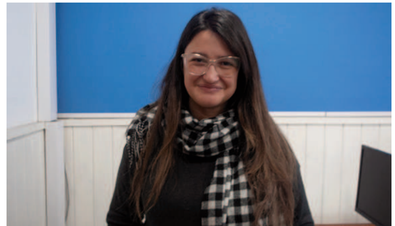
Los nuevos proyectos se iniciarán luego del receso invernal.

ordenanza vigente con recursos afectados que no se estaría cumpliendo", sostuvo la edil, quien no descarta realizar una denuncia si correspondiese. "Si hay algo que me llama la atención de esta conformación del Concejo Deliberante, es el desconocimiento total del reglamento. Prefiero creer que sea desconocimiento, ignorancia en cuanto al reglamento, a la Ley Orgánica de las Municipalidades también, más que un gesto de no querer otorgar las herramientas necesarias para poder legislar", afirmó. Mientras tanto, el bloque oficialista redobló la apuesta y presentó un proyecto de ordenanza "facultando al Departamento Ejecutivo Municipal a utilizar y afectar fondos del Fomae en programas de apoyo, fortalecimiento y promoción de políticas educativas a implementarse a través del Centro Universitario de Ramallo".