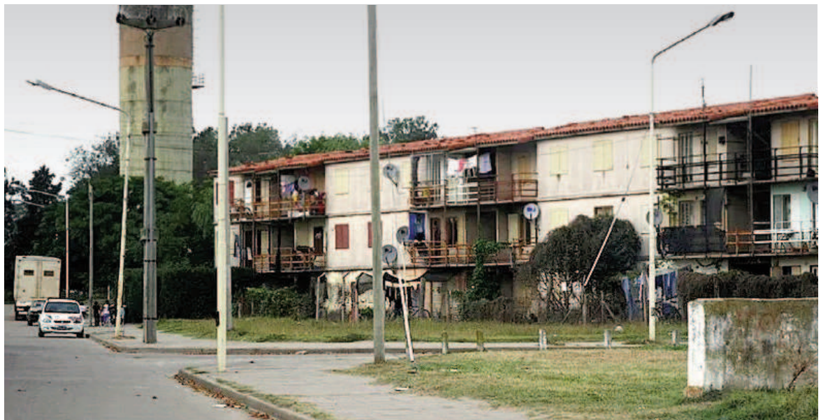
El agresor de 17 años se movilizaba en una moto junto con una jovencita de 16 y abordaron a la víctima, de 15 años.

La comunidad del complejo habitacional Virgen de Guadalupe se encuentra conmocionada por el incidente y exige justicia para la joven víctima.