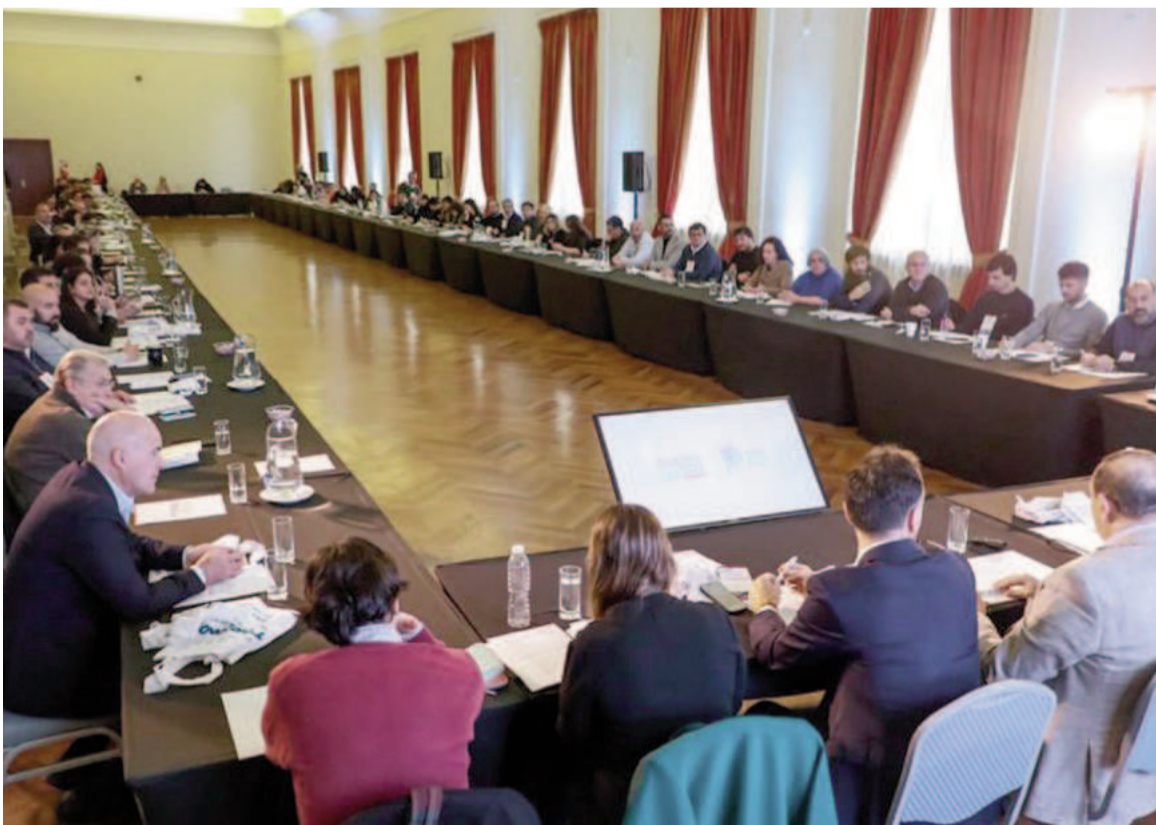
27° asamblea del Consejo Provincial del Turismo (CoProTur).

En colaboración con Banco Provincia, se anunciaron los beneficios