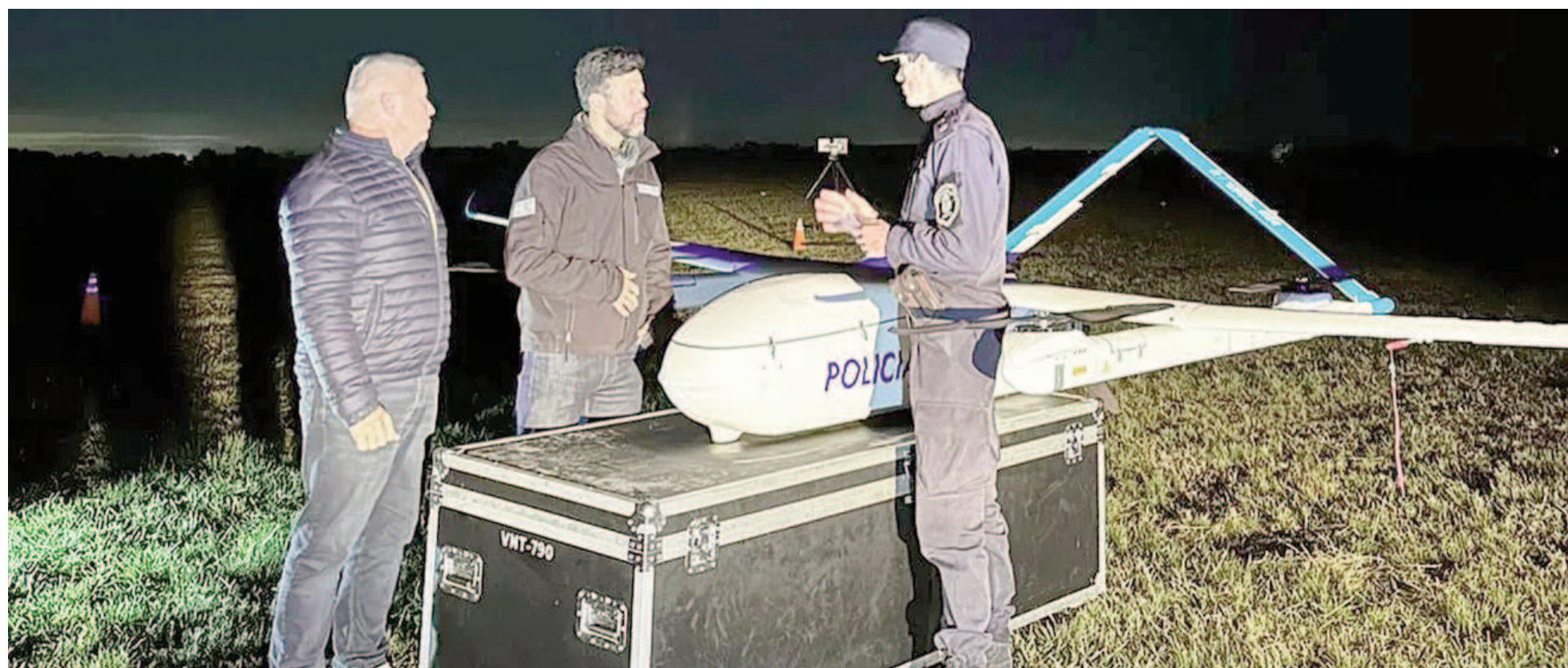
La policía trabaja con drones para identificar a los delincuentes.