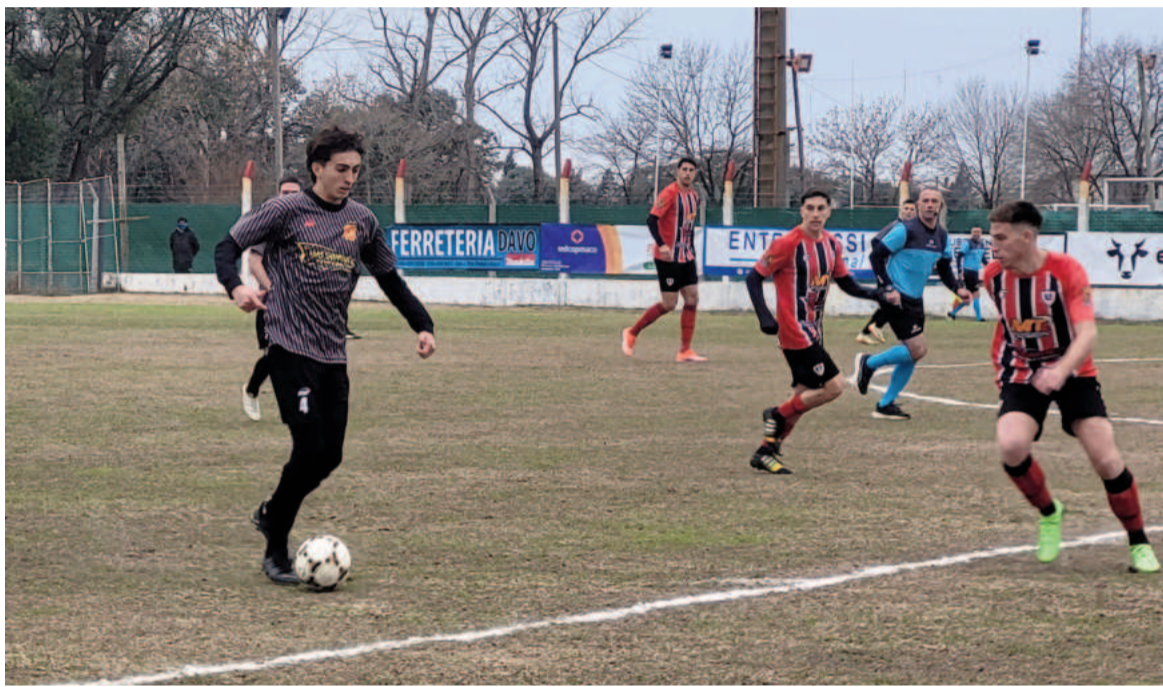
Belgrano logró una gran victoria como local ante el último campeón.