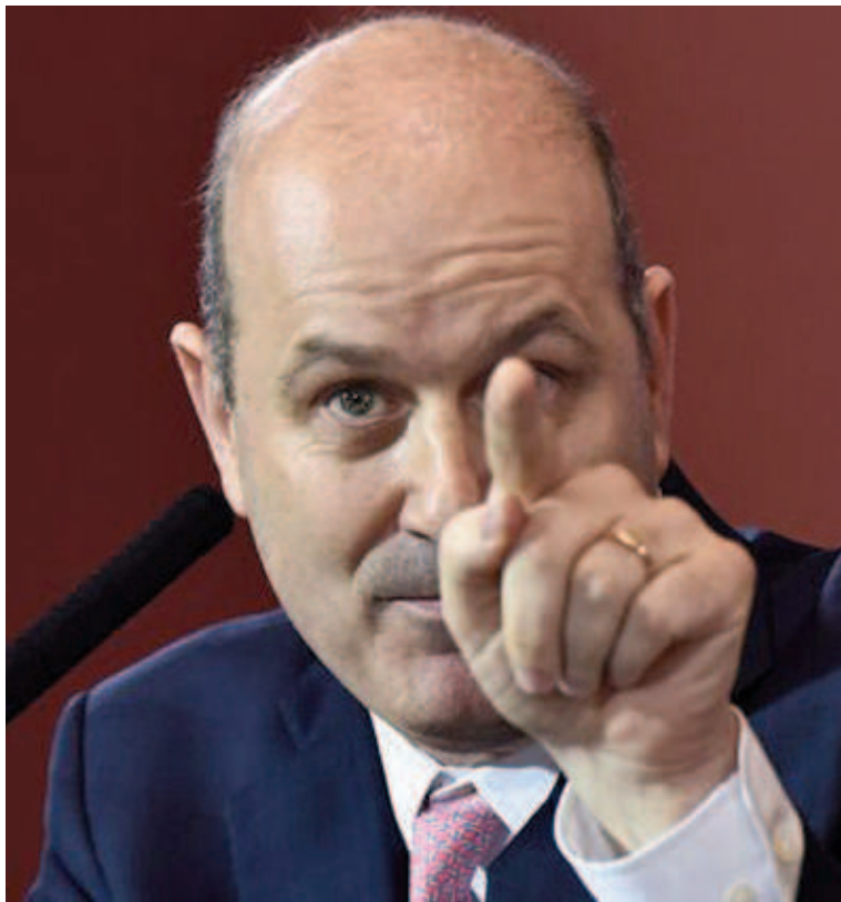
El ministro Sturzenegger quiere examen de ingreso para trabajar en el Estado.

En su hilo, Sturzenegger destacó que desarrollará una "agenda de transformación" para poner en marcha una reforma del Estado "usando las facultades de la Ley Bases", las que fueron otorgadas al Poder Ejecutivo. Esa agenda se compone de "decretos, reglamentos y resoluciones que solo le ponen el pie encima a la producción. Vamos a necesitar de mucha ayuda del sector privado para identificar estos costos ocultos y poder ayudar a eliminarlos", explicó.