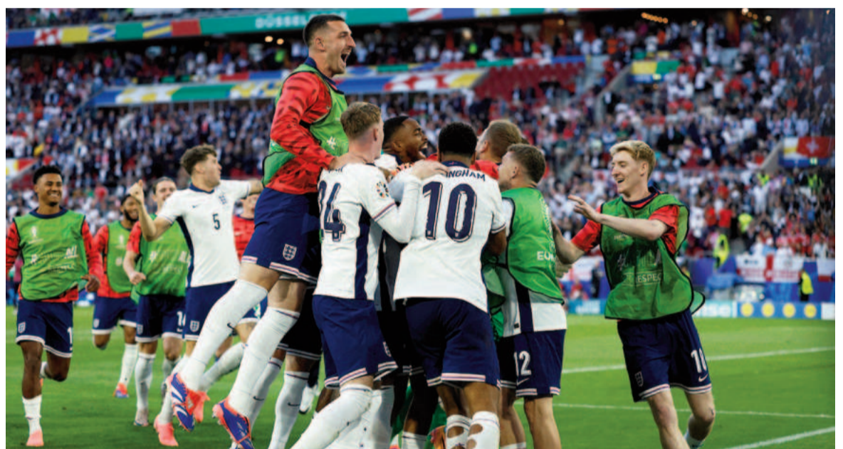
El seleccionado inglés sigue sin convencer, pero ya está entre los cuatro mejores. NA

Por su parte Países Bajos puso la camiseta sobre la mesa y venció a Turquía por 2-1, gracias a los goles de Stefan De Vrij y Cody Gakpo -tras un desvío en la anatomía de Mert Müldür-, en los