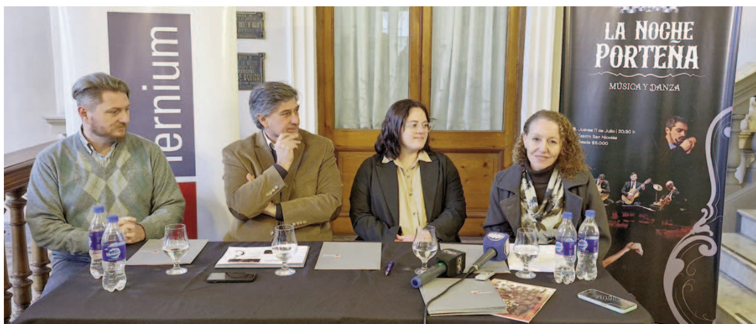
Todo listo: responsables de la nueva edición de Cultura de Estación brindaron detalles de la presentación de este jueves.