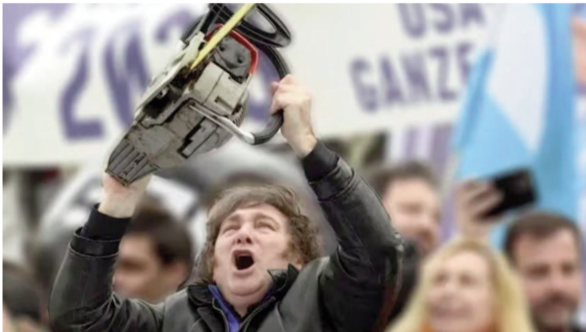
El ajuste fiscal impulsado por Javier Milei en el primer semestre del 2024 es el mayor en 64 años.

Al referirse al motor que sustentó este resultado a diferencia de lo sucedido en otros periodos, la entidad dirigida por el ex titular de la ANSES, Osvaldo Giordano, señaló que "lo que hace más notorio el ajuste del primer semestre es que toda la mejora en el resultado financiero se debe adjudicar a una baja del gasto público, cuando en 1985, año en que también se registró una fuerte