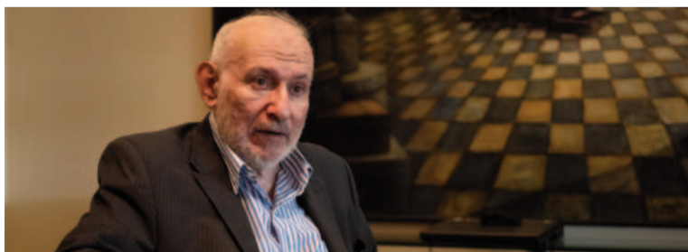
Mario Blejer, economista y ex presidente del BCRA.

Blejer subrayó que la volatilidad internacional se debe a un aumento de los riesgos globales, influenciados por conflictos como los de Medio Oriente, Ucrania y Taiwán, así como por la incertidumbre política en Estados Unidos ante las próximas elecciones. Según el economista, aunque estos factores no son nuevos, su con-