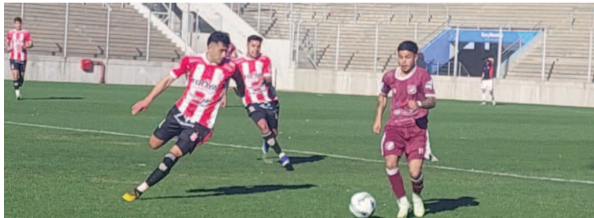
El Granate empató los dos partidos que jugó como local en esta segunda fase.

Era un partido muy importante para el Granate, que no salió a jugarlo como tenía que hacerlo. El visitante fue dueño del trámite durante los primeros 25 minutos, presionó en el medio, recuperó