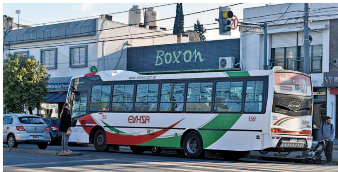
“A igual tarea, igual remuneración”: el gremio de los colectiveros busca acordar para el interior los mismos salarios que ya se pagan en el AMBA.

En ese ámbito, el gremio de los colectiveros viene bregando por sellar para los trabajadores del interior del país el mismo acuerdo ya cerrado con otras entidades empresarias para los trabajadores del Área Metropolitana de Buenos Aires (AMBA). Del otro lado de la mesa de negociación se sientan representantes de la Fatap, que es la federación empresaria integrada por prestatarias que operan servicios fuera del AMBA, en el interior. La audiencia con la entidad estaba prevista para el jueves de la semana pasada, pero fue suspendida y reprogramada para el próximo jueves, 15 de agosto. En el marco de la actual negociación para el interior, el gremio ya dejó asentada su pretensión salarial en una de las últimas