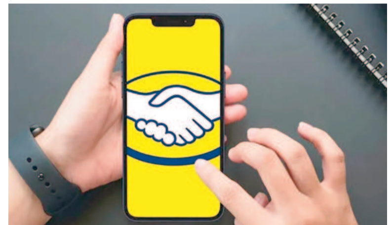
Mercado Libre cargó contra los bancos.

Es por la operación de MODO, la billetera digital que compite con Mercado Pago. El unicornio fundado por Marcos Galperin argumenta que la crearon para no competir entre ellos y obstaculizar el crecimiento de empresas Fintech.