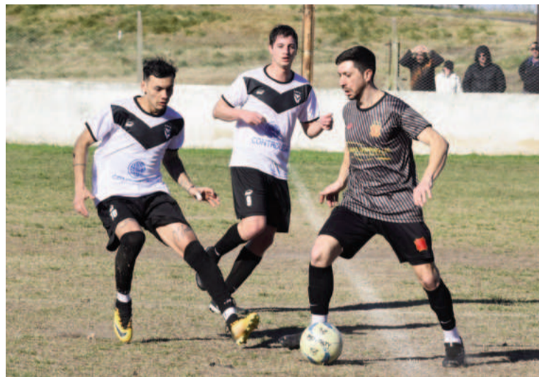
Belgrano al vencer a El Fortín es líder en su grupo.