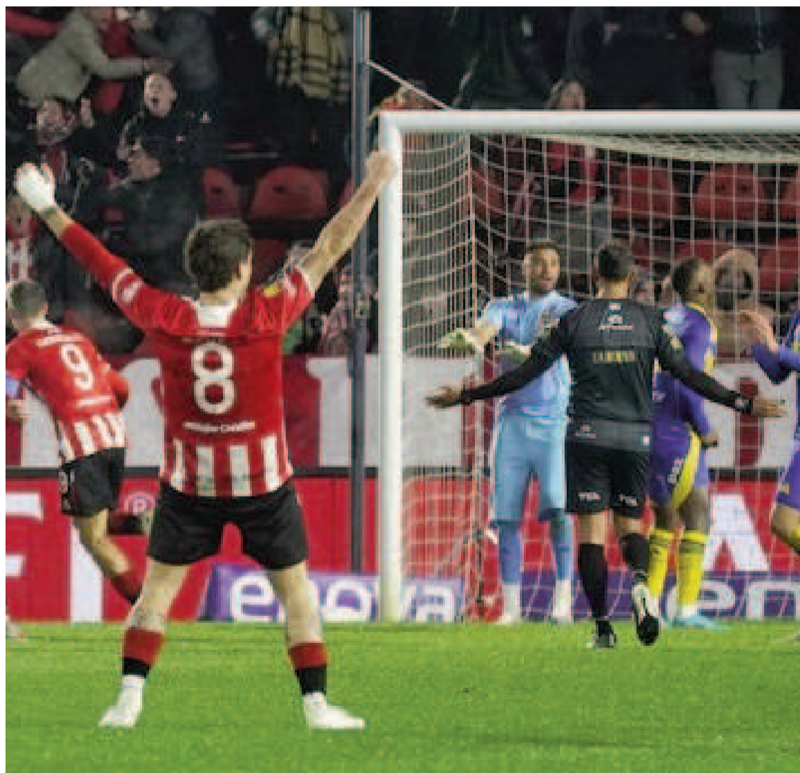
Estudiantes logró empatarle a Boca en el estadio Uno.

El Xeneize superaba al Pincha en La Plata con gol de Milton Giménez (expulsado en el final), pero lo empató Cetré. El VAR le anuló el segundo al Pincha en el descuento..