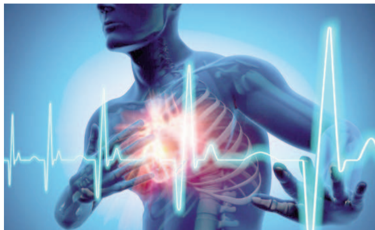
Aún existe falta de consciencia sobre riesgos de arritmias para la vida de las personas. ILUSTRACIÓN

También tener la tensión arterial alta sin control, un índice de masa cor-