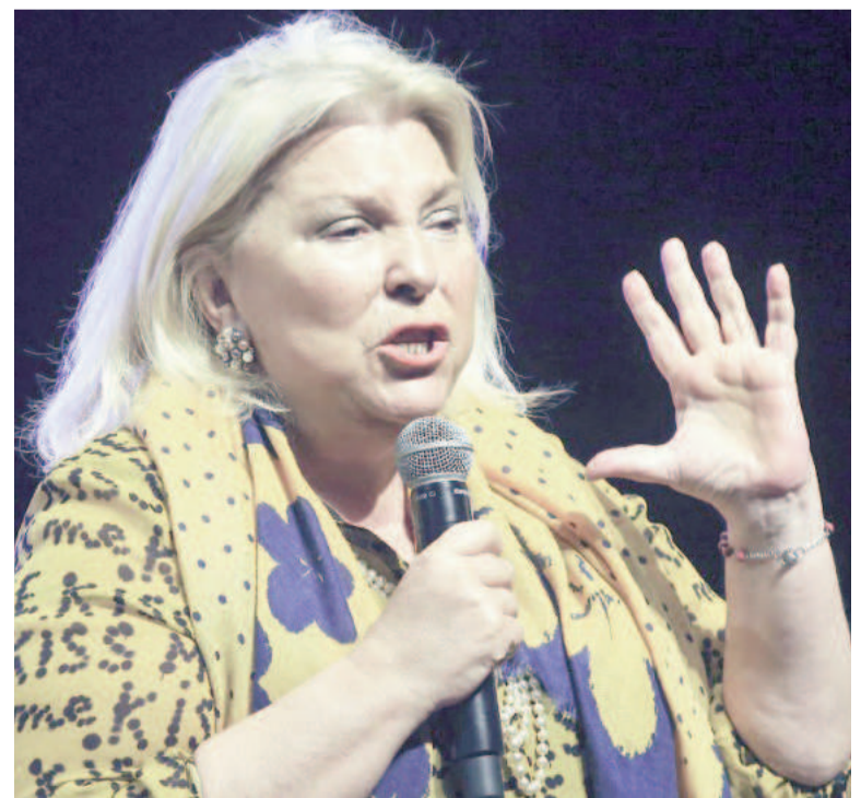
Elisa Carrió, líder de la Coalición Cívica, fustigó a Milei por el veto.

“Gracias Javier y Mauricio. Dejen de Mentir. Un beso. Lilita”, cerró Carrió con sarcasmo al referirse a Milei y Macri. El pasado jueves, el Senado convirtió en ley la reforma de movilidad jubilatoria con 61 votos a favor y apenas ocho rechazos. Luego Milei ratificó que usará la facultad del veto presidencial, porque no contemplaba dejarles “pasar un milímetro a los degenerados fiscales”.