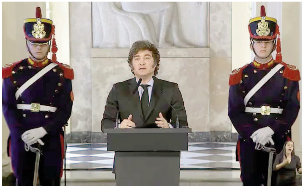
Javier Milei aseguró que vetará la ley de jubilaciones.

que sancionó la semana pasada el Senado, las autoridades nacionales entienden que la norma no tiene validez, aunque si tampoco se con-