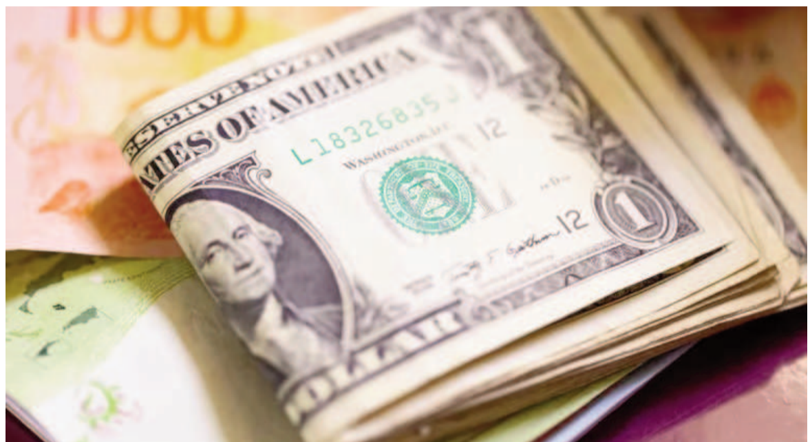
Todo apunta a que el BCRA podrá concluir el mes con saldo a favor a cuatro ruedas operativas del cierre.

Con la vigencia del nuevo esquema monetario anunciado el 13 de julio, el Banco Central pasó a una expansión neta $69.290 millones desde el lunes 15 de julio. Esto obliga a la reventa de divisas en el mercado de valores a la cotización del "contado con liqui" para el cumplimiento del estricto del esquema de "emisión cero" al que se comprometió el Gobierno. Complementario a esto, el Gobierno anunció la esterilización de pesos emitidos por la compra de reservas en el MLC desde el 30 de abril ($2,4 billones).