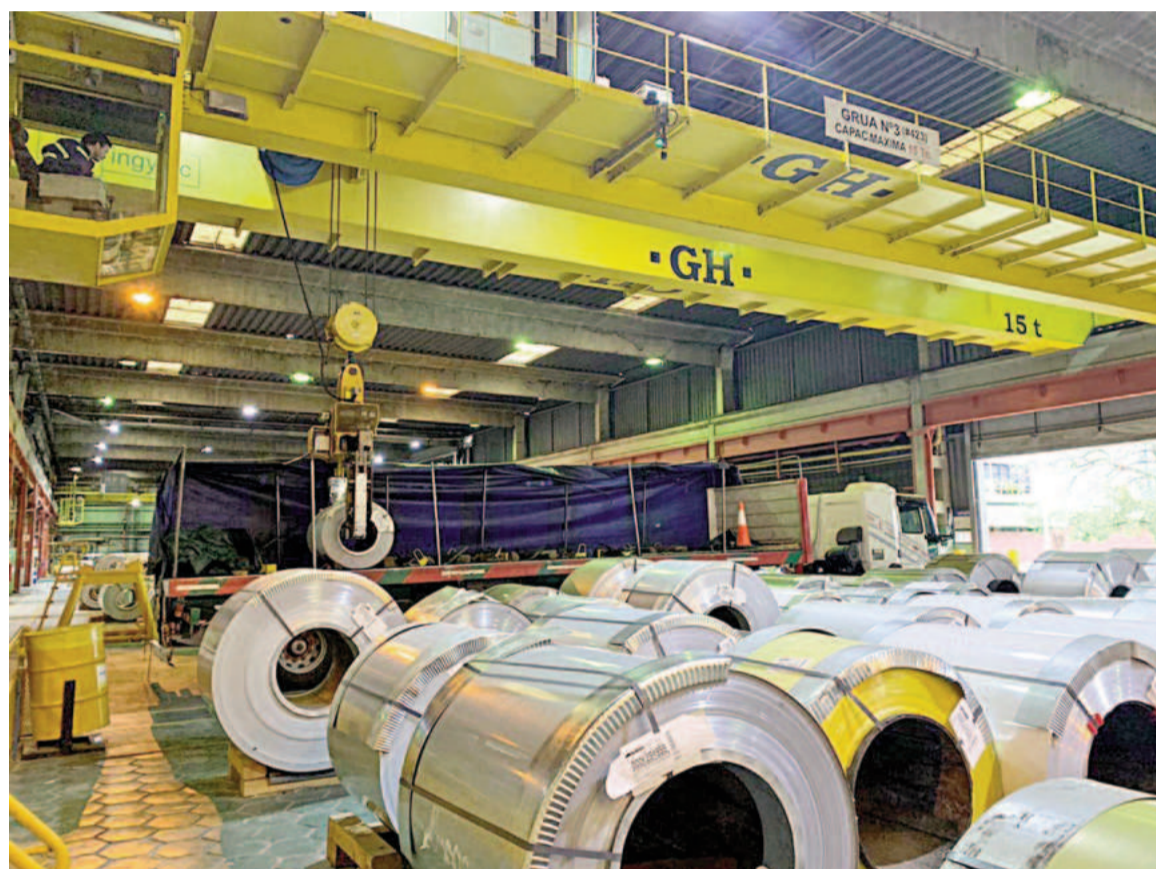
La producción de acero crudo en julio fue de 313.900 toneladas, resultando 14,2% mayor con respecto a los valores de junio (274.800 toneladas).

La Cámara observó que "comienzan a verse algunos signos de reactivación en los sectores vinculados a la cadena de valor metal-mecánica". En tal sentido, el informe consignó que el sector automotor "repunta de la mano del mercado local y la exportación a Brasil". Y que, junto con la construcción y