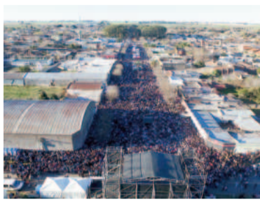
Gran cantidad de asistentes tuvo la celebración.