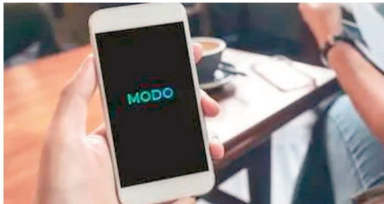
MODO salió a responder la denuncia de cartelización por parte de Mercado Libre.

Asimismo, los bancos sostienen que "esta nueva denuncia sólo bus-