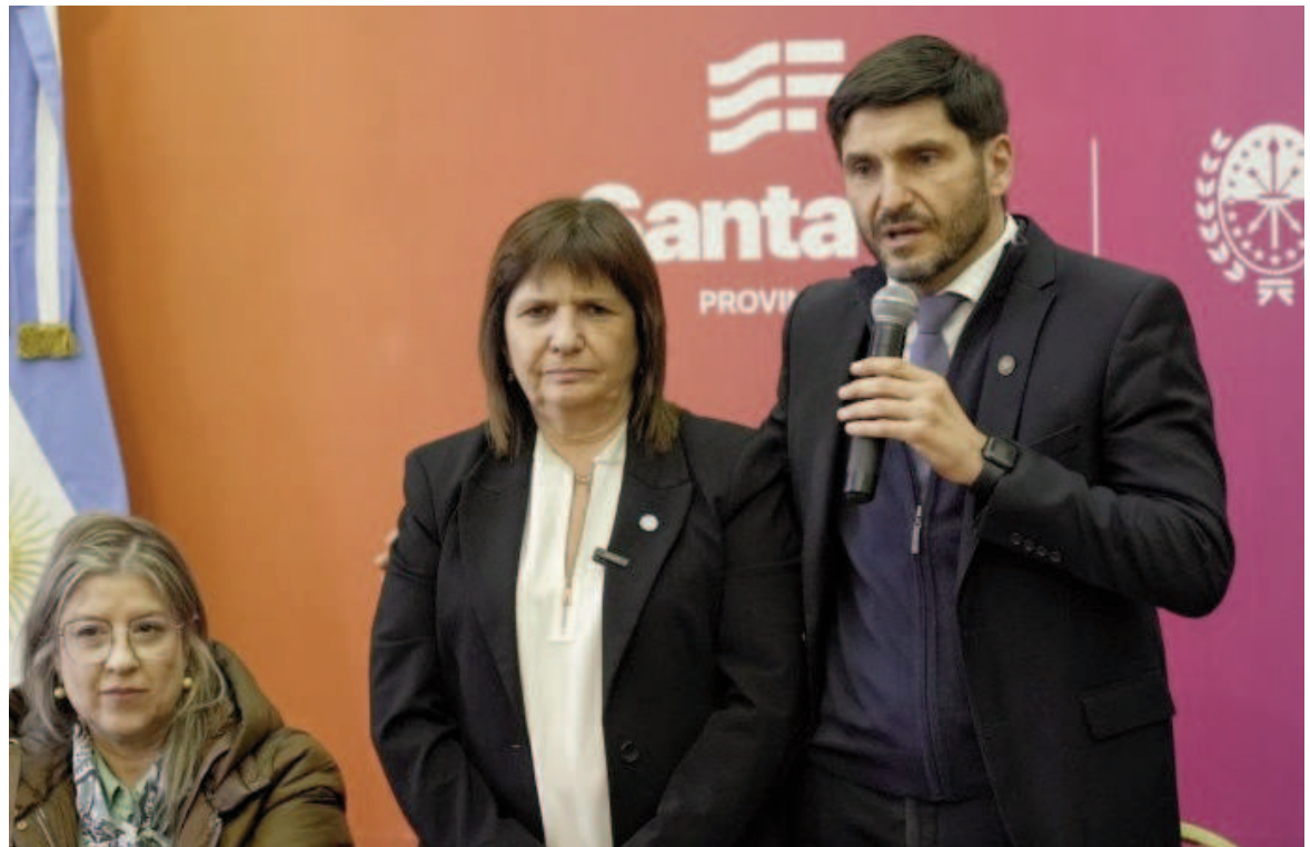
Patricia Bullrich se reunió en Rosario con el gobernador Maximiliano Pullaro para analizar resultados del Plan Bandera.

Bullrich señaló que al comienzo de la gestión su equipo se planteó el objetivo de que “el fenómeno Rosario” no se extendiera a otras partes del país. «En Río Cuarto, en San Nicolás, estaban preocupados porque el fenómeno iba a ir a otros lugares. Hemos logrado el control territorial, el encapsulamiento del problema. Las bandas no fueron a otros lugares. Trabajamos fuerte para retomar el control territorial; que la ley y la Constitución estén por encima de la ley narco que había”, enfatizó. “La baja del 70 por ciento en las zonas más conflictivas marcan un número inédito. El gobernador me marcaba que los números son los más importantes de los últimos 17 años. Nunca hubo un número tan bajo en homicidios y balaceras. La Policía está desplegada por toda la ciudad, tiene manejo del 911 y las fuerzas federales tienen una responsabilidad en los barrios donde había mayor incidencia de las bandas”, amplió Bullrich.