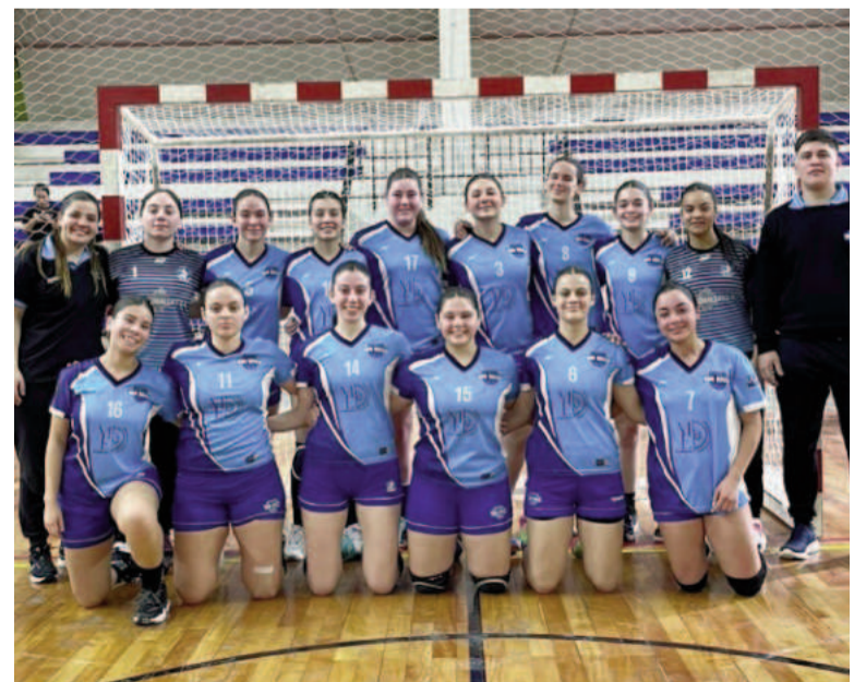
Don Bosco debutó con triunfo.