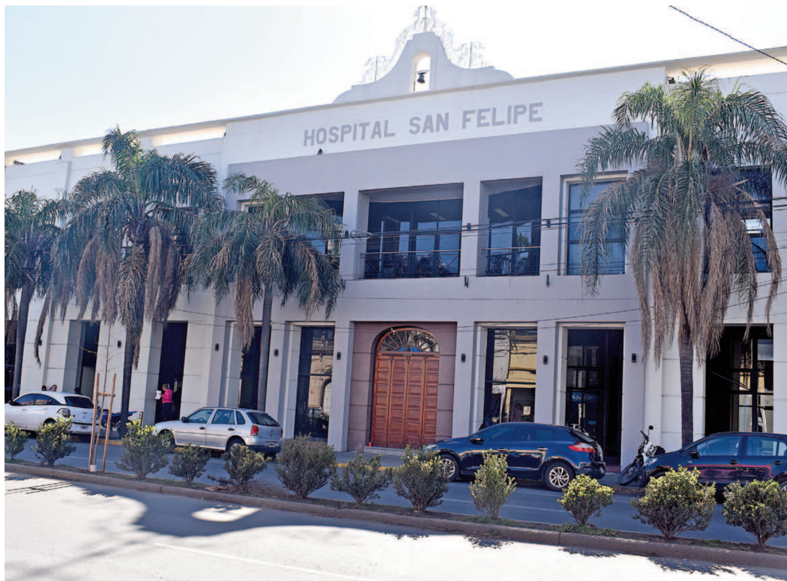
Luego de ocho a os, el directorio del hospital San Felipe volvi  ahora a un formato de cuatro miembros: un director m dico ejecutivo y tres asociados.