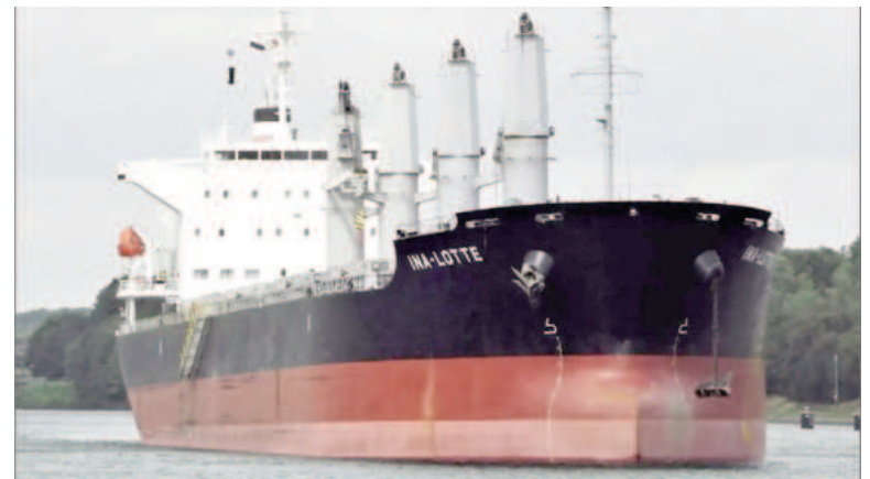
El buque con bandera de Liberia que movilizó a autoridades sanitarias.

En concordancia, desde Prefectura Naval de San Nicolás confirmaron que no hubo tal procedimiento. Mientras que, desde el Sanatorio UOM San Nicolás, también negaron tal afirmación sobre la posibilidad de que el infectado haya descendido a tierra nicoleña, fuentes aseguran que «no lo dejaron bajar del buque».