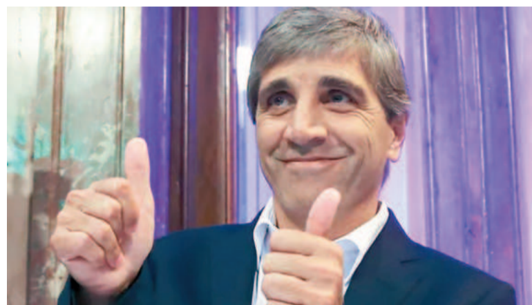
El ministro de Economía en busca de inversiones con el RIGI.

Este grupo ve en la Argentina una oportunidad para diversificar sus inversiones, tradicionalmente concentradas en hidrocarburos. No obstante, la misión en Riad (capital del país) no incluirá la negociación de un paquete de financiamiento directo bilateral, sino que se centrará en presentar el nuevo régimen inversor y explorar oportunidades para proyectos conjuntos.