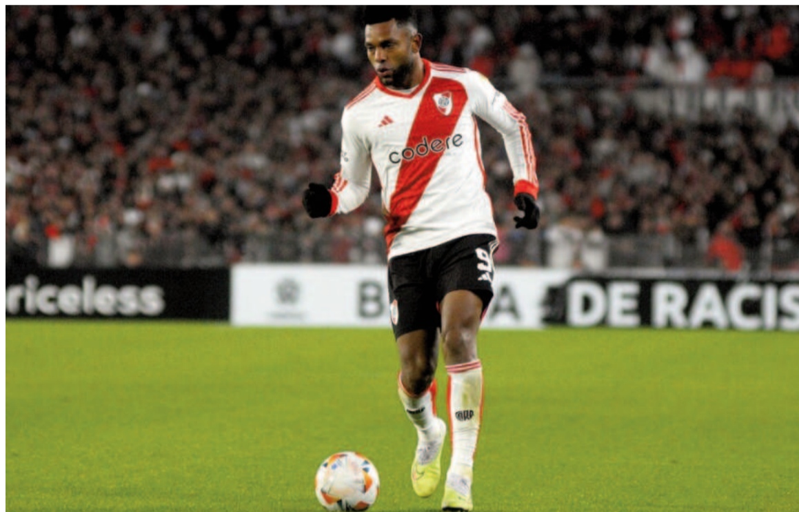
El millonario buscará avanzar a cuartos de final ante la T. WEB

El conjunto de Núñez se impuso por 1 a 0 en el partido de ida y buscará hacerse fuerte de local para avanzar a los cuartos de final de la Libertadores. Se iniciará a las 21.30.