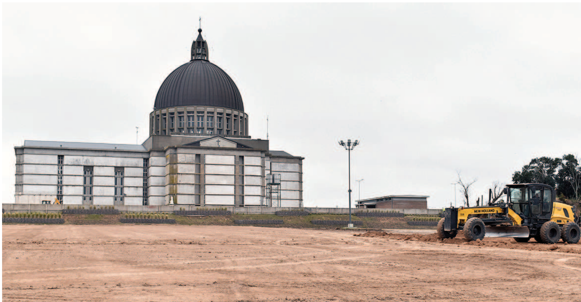
En estos momentos, los trabajos se centran en el movimiento de tierra y acomodamiento del terreno.