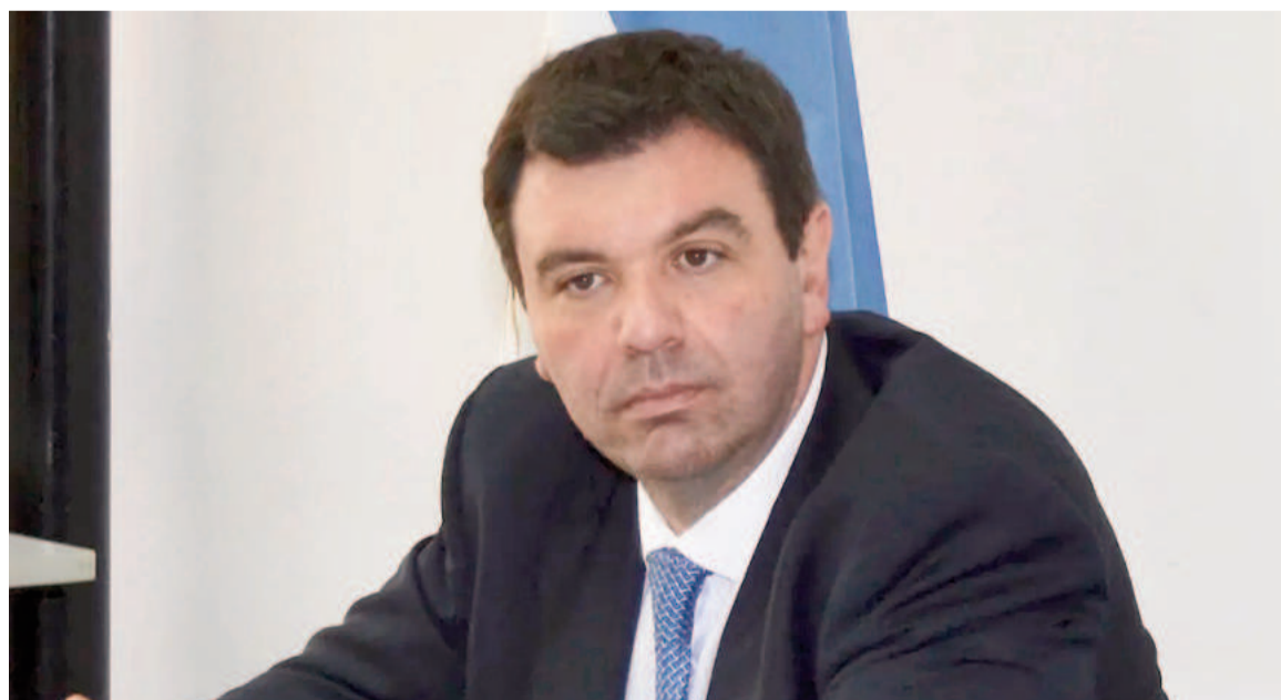
Villarruel no quiere a Lijo en la Corte Suprema de Justicia.

«Es un juez controversial que no contaría con los pergaminos necesarios para ser juez de la Corte