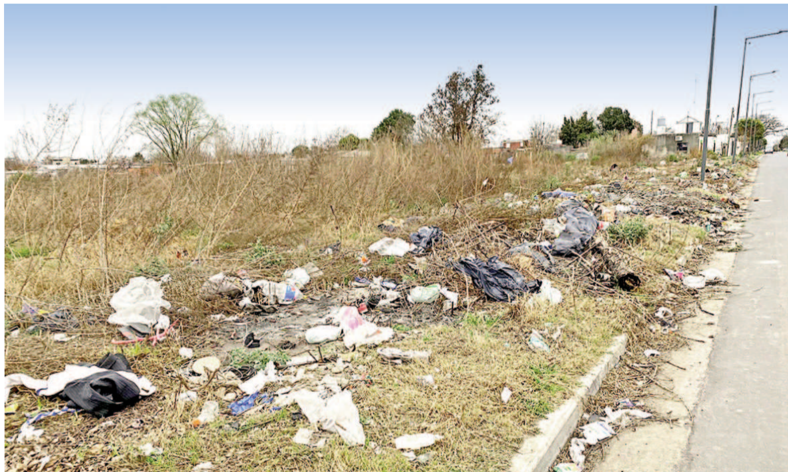
La toma de conciencia es crucial para frenar definitivamente la creación de estos focos de contaminación.

Código de Convivencia y Faltas, actualizado en el 2021 y que ayuda a generar costumbres de buenas conductas. La intención del mismo es poder lograr un buen trato entre vecinos. El artículo 123 del Código, establece las penas por arrojar basura donde no corresponda,