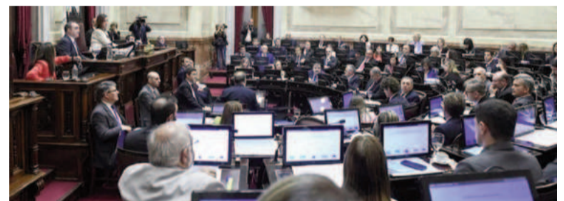
Los senadores renunciaron al aumento de sus dietas.

El presidente fue uno de los primeros en pronunciarse en contra de esta decisión, calificándola como «una burla» y «una traición al pueblo argentino». El mandatario señaló que mientras los sueldos del Poder Ejecutivo permanecen congelados desde diciembre, los senadores parecen desconectados de la realidad económica del país. Además, compartió en sus redes sociales mensajes de usuarios que expresaban su indignación y agradecían al diputado Martín Menem por desenganchar a los diputados de este tipo de aumentos. La presidenta del Senado, Victoria Villarruel, también intentó distanciarse de la medida adoptada por los legisladores. «Solo decido sobre las paritarias de los empleados», afirmó, subrayando que la decisión de desengancharse de los aumentos salariales de los trabajadores legislativos es competencia exclusiva de los senadores.