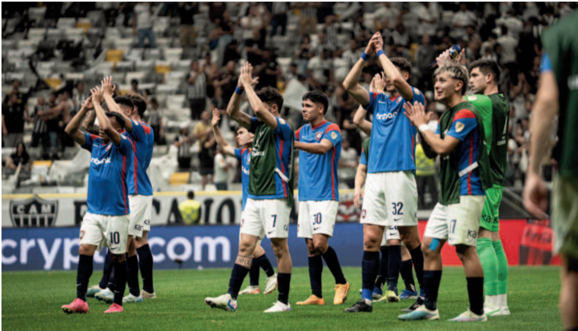
El Ciclón perdió en Brasil y quedó fuera de carrera. WEB

En Belo Horizonte, los Gauchos de Boedo cayeron 1-0 con el Galo y quedaron fuera del máximo torneo a nivel continental. El gol lo marcó el ex Huracán Rodrigo Battaglia.