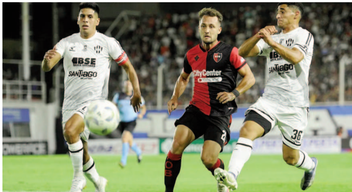
En su último enfrentamiento, los rosarinos ganaron en Santiago del Estero por la LPF.