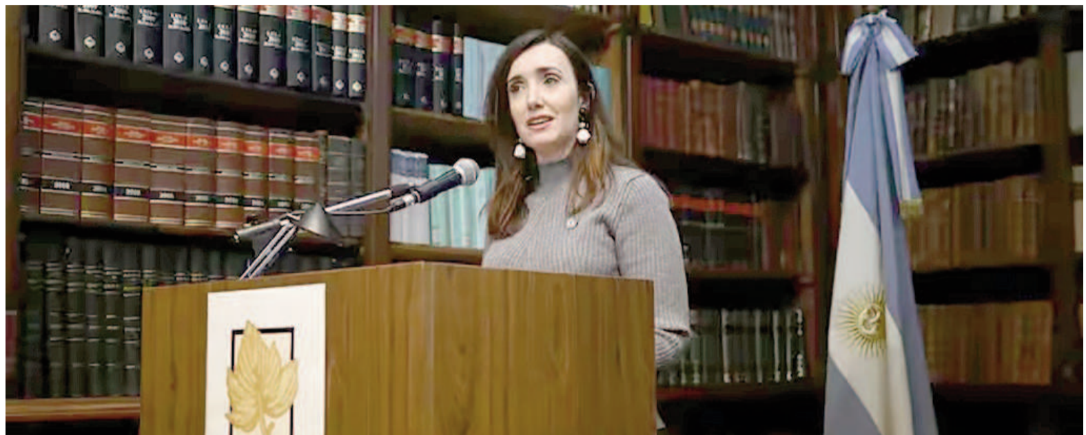
: Victoria Villarruel dijo que su apoyo y lealtad a Milei son totales.

Sobre el supuesto enfrentamiento con Javier Milei, la vicepresidenta dijo que lo que le preocupa de esta cuestión es “que se cree la idea de que hay un gobierno que está peleado en su seno. No, lo que hay es un gobierno que está viviendo su maduración -que la sociedad la conocía- mientras gobierna”.