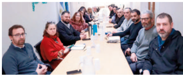
Los Judiciales también aceptaron la oferta salarial de provincia.

«Por amplísima mayoría los judiciales han valorado y decidido