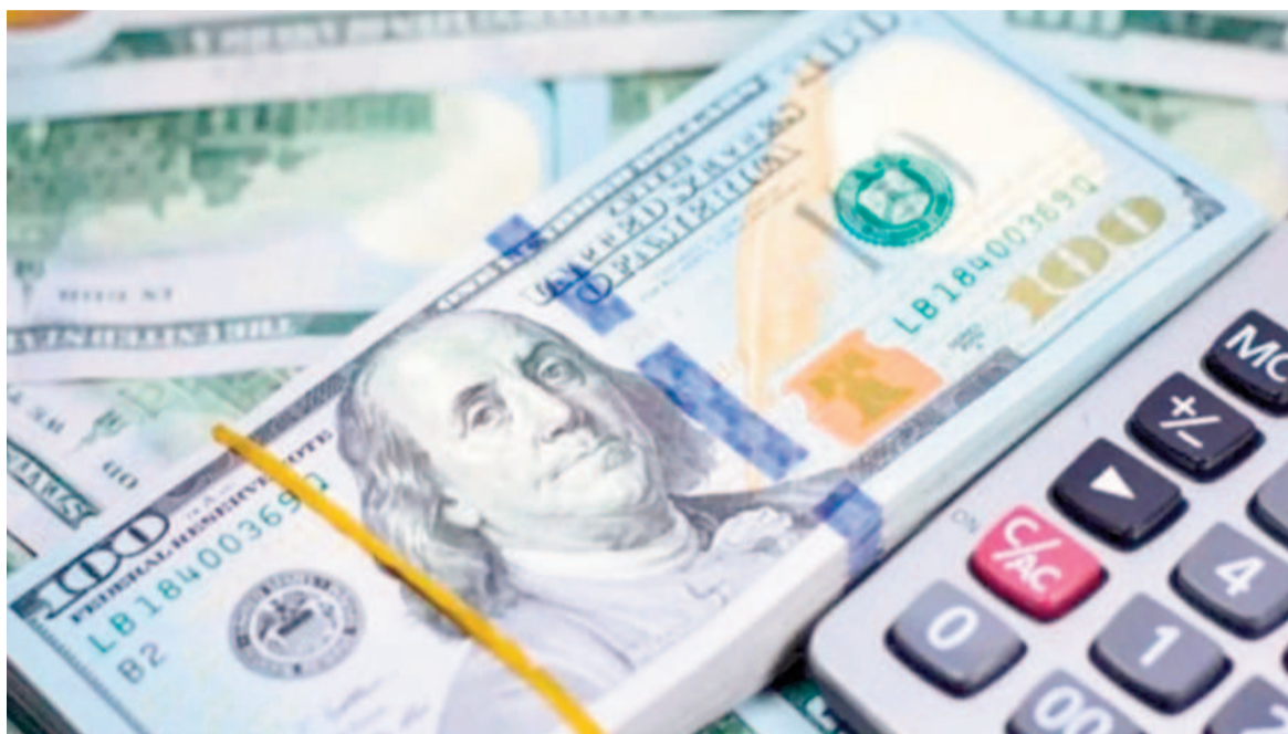
Argentina aumenta la calificación y crecen las inversiones.

«Con un peso estimado del 0,2% en los mercados emergentes, Argentina se situaría entre Colombia y Perú en el índice EM», dijo Diego Celedón, de JPMorgan. Sin embargo, este cambio en la clasificación de Argentina no será en el corto plazo, sino que habrá que esperar al menos hasta mediados de 2025. MSCI suele anunciar cambios en su categorización de países durante su Revisión de la Clasificación de Mercados, que suele programarse para junio y generalmente está precedido por un largo y detallado proceso de consulta con los inversores.