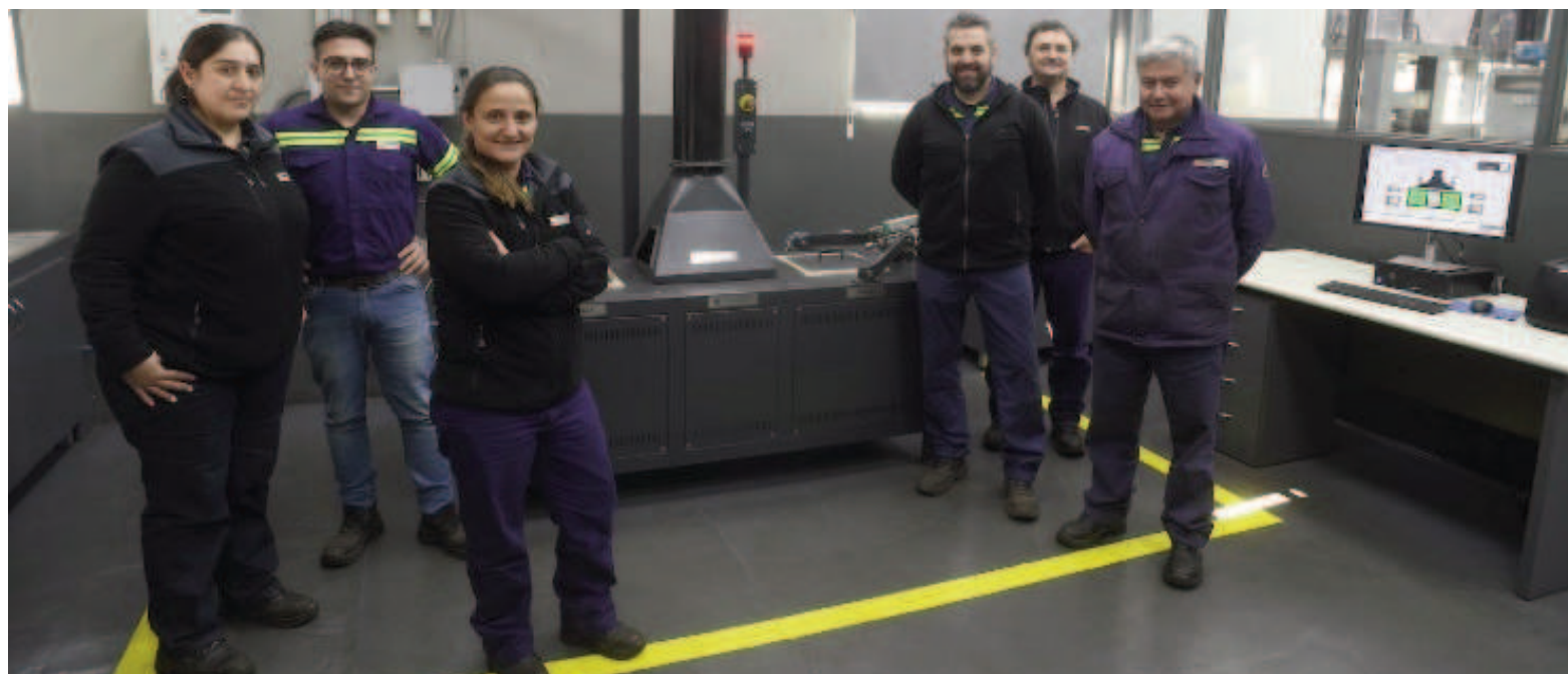
La instalación del nuevo equipo favorece el cuidado de las instalaciones y el proceso de Reducción en la planta General Savio.