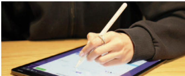
Amplian el uso de la firma digital.

Según el Ejecutivo, de lo contrario «se corre el riesgo de no aprovechar las posibilidades que ofrecen dichas tecnologías para el tratamiento de la información y la simplificación de las comunicaciones».