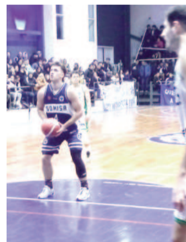
Belgrano se trajo una valiosa victoria de Villa Ramallo.