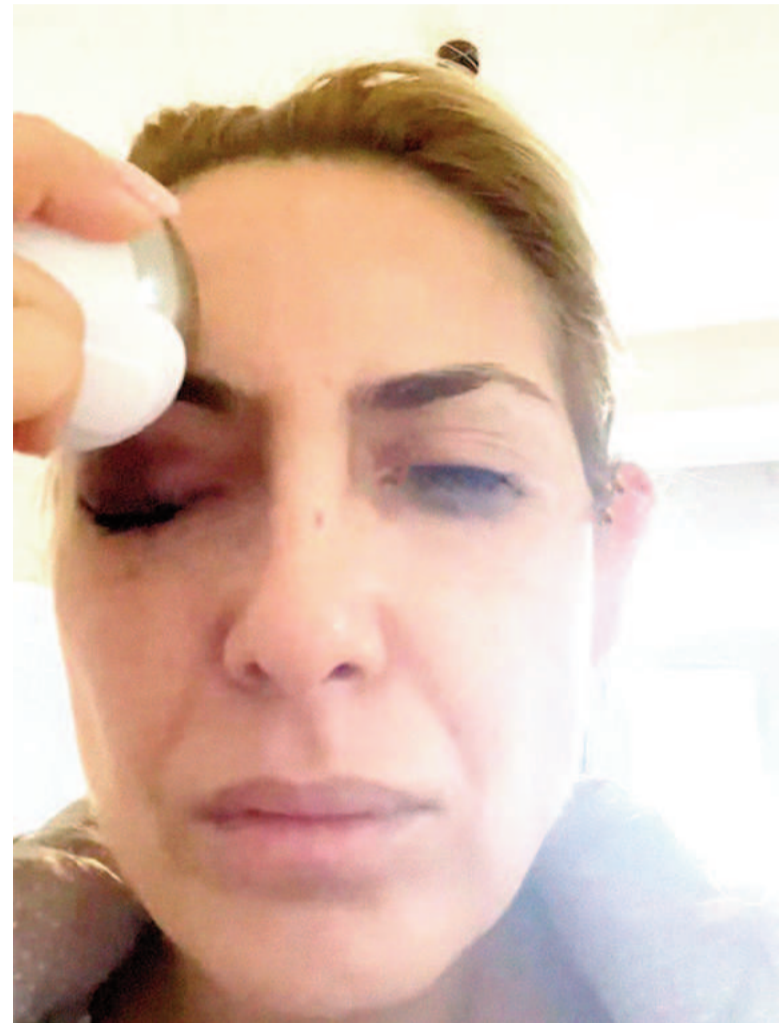
Fabiola Yañez, ex primera dama durante la presidencia de Alberto Fernández.