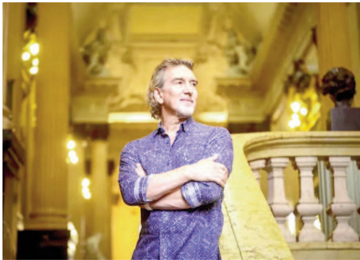
Julio Bocca regresa al Colón, esta vez como su principal responsable.

Luego de que el director saliente anunciara su desvinculación, el Ministerio de Cultura porteño anticipó un nuevo plan para el gran coliseo argentino de la lírica y el ballet.