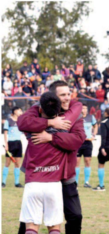
Defensores visitará a Social en su debut.