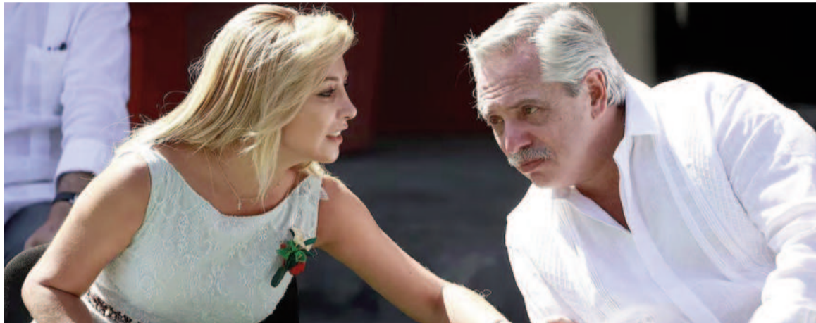
Fabiola Yañez y Alberto Fernández.