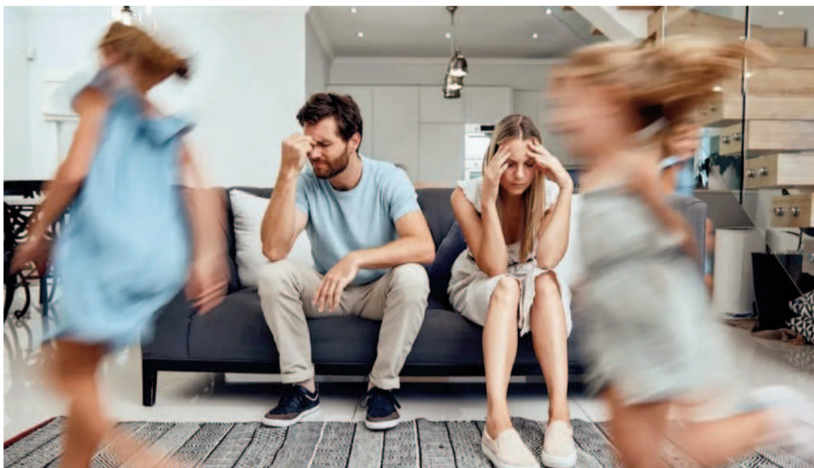
"El estrés parental es una realidad epocal poco estudiada pero con mucha presencia clínica y también en las calles", según los especialistas.

Será por eso que el director de sanidad de Estados Unidos, doctor Vivek Murthy, declaró que el estrés parental es un tema urgente de salud pública, y reconoció que los niveles de agotamiento físico y mental que experimentan los padres hoy puede deteriorar su salud y bienestar, y, en consecuencia, afectar negativamente a sus hijos.