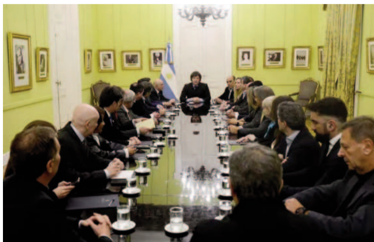
La reunión de Milei con los legisladores afines.