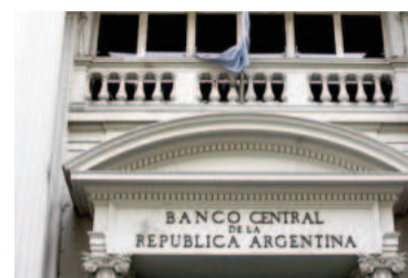
Las reservas cayeron más de USD 1.000 millones en la última rueda operativa de agosto.

La entidad monetaria concluyó agosto con compras netas en el mercado por USD 381 millones, luego de dos meses de ventas netas en junio y julio. Por los motivos mencionados -ventas de contado, pagos de deuda y giros de los bancos por cuestiones contables- las reservas internacio-