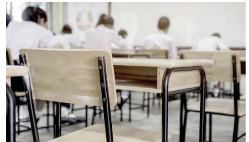
Nuevo aumento en la cuota de los colegios privados.

El Gobierno bonaerense autorizó un nuevo aumento en las cuotas de los colegios privados subsidiados total o parcialmente por el Estado para septiembre, tras el pedido realizado por la Asociación de Institutos de Enseñanza Privada de la provincia de Buenos Aires (Aiepba). También el ajuste llegará para las instituciones de la Ciudad de Buenos Aires.