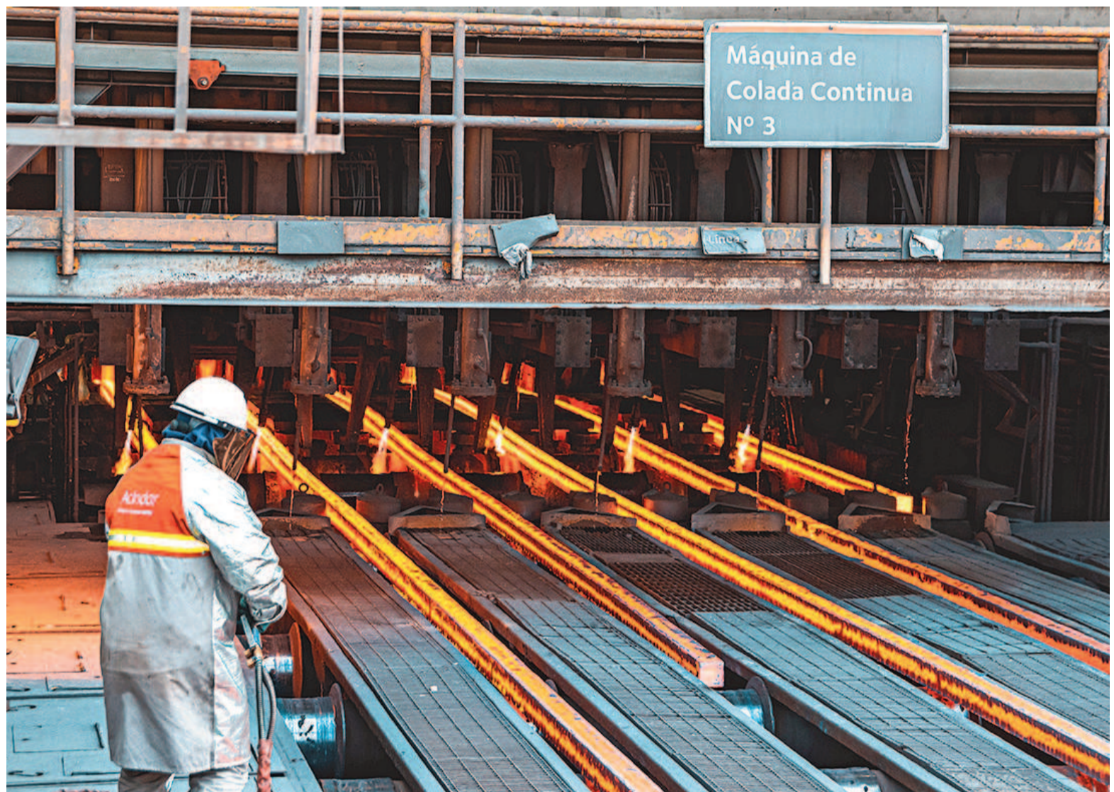
A través de la Cámara Argentina del Acero, las siderúrgicas mantendrán un encuentro con funcionarios del Ministerio de Economía.