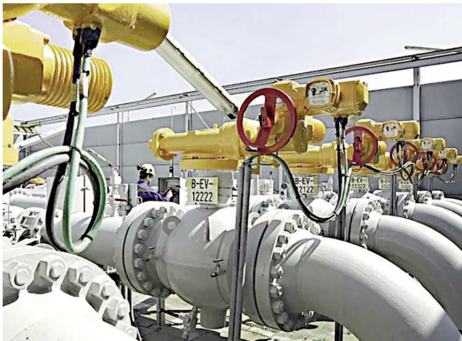
El mes de julio de este año fue el segundo más frío desde que la empresa Litoral Gas tiene registros (1992).

El desabastecimiento, que afectó en territorio bonaerense a los usuarios de GNC, se produjo por un aumento en la demanda debido a bajas temperaturas que no fueron previstas a tiempo por el Gobierno nacional, quien no tomó medidas complementarias para abastecer la demanda de GNL. Ante la emergencia, pidieron asistencia a la empresa brasileña Petrobras, pero hubo un problema con los pagos que demoró el desembarco del bu-