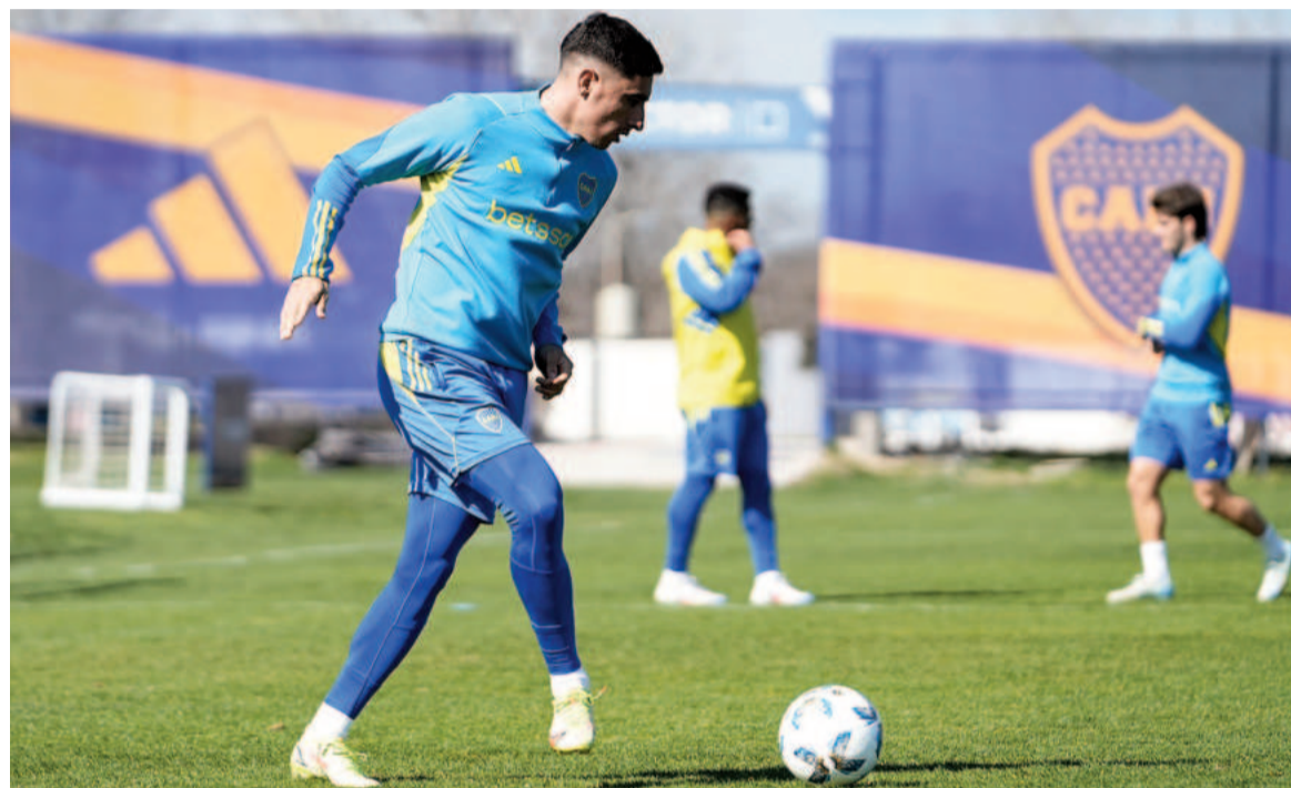
El Xeneize, de irregular presente, quiere subir en la tabla. WEB

El Xeneize, octavo en la tabla, recibirá al Canalla con la necesidad de ganar como local para meterse en la pelea por un lugar en la Libertadores del año que viene.