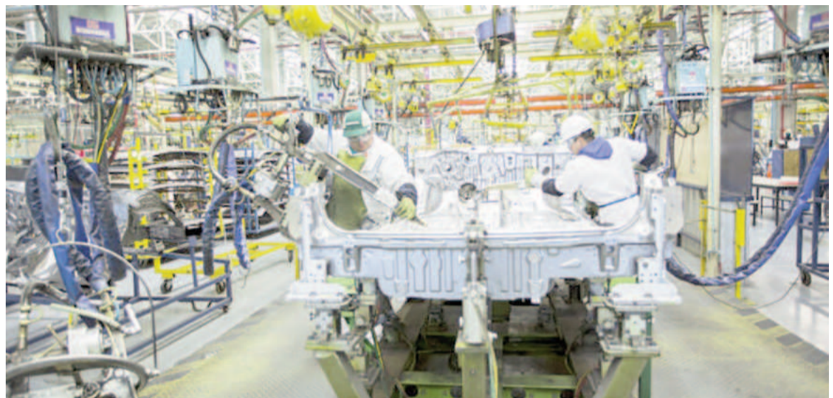
La industria lleva 13 meses de caída, no obstante, los datos anticipados de julio indican mejoras.

En virtud de la evolución de diferentes factores -como el contexto macroeconómico, los costos y la competitividad industrial-, se estima que el tercer trimestre podría exhibir