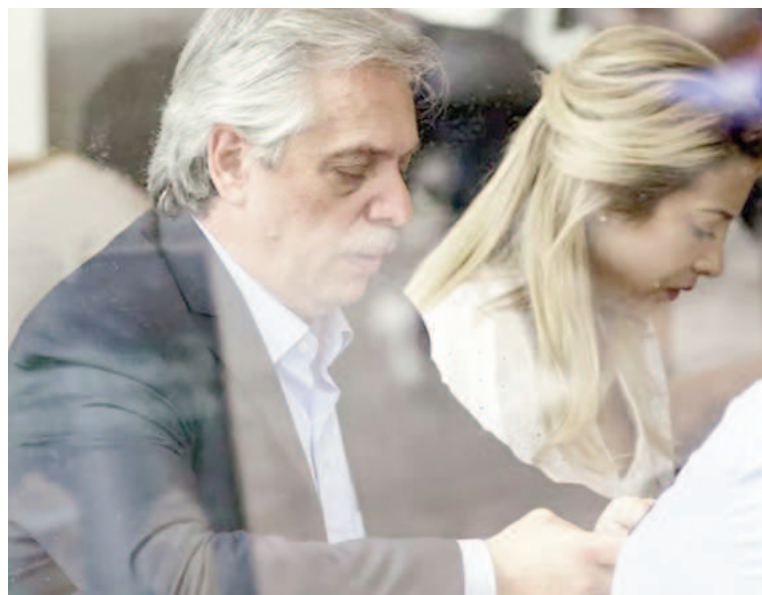
La denuncia por violencia de género de Yañez a Fernández disparó las consultas.

Si bien la ley Olimpia (Ley 27.736 que modificó la Ley 26.485 e incorporó como finalidad de la misma la protección y garantías de los derechos y bienes digitales de las mujeres, así como su desenvolvimiento y permanencia en el espacio digital) incluye este hostigamiento como una modalidad de violencia digital, aún