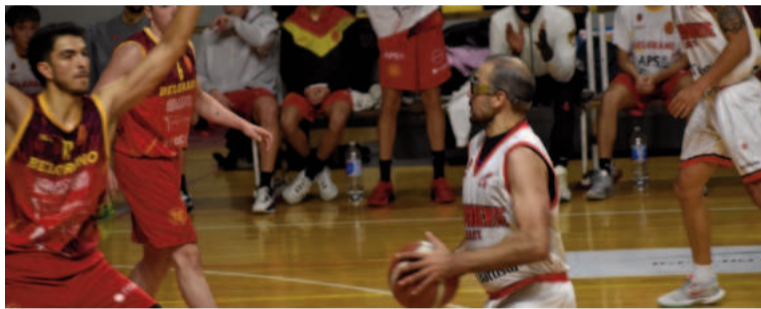
En una semana se iniciará el Prefederal, con Belgrano e Independiente de Zárate como dos de sus 32 participantes.

a) La clasificación de los equipos se establecerá de acuerdo a su historial de victorias y derrotas, otorgando dos