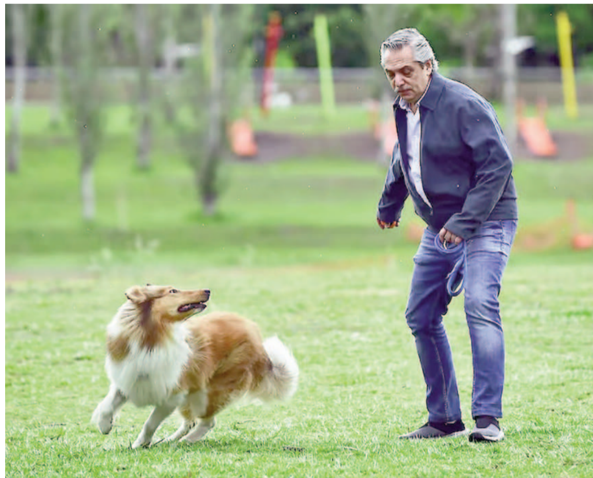
Alberto Fernández con Dylan en tiempos felices de candidato.