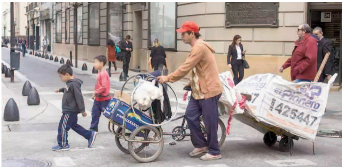
Las cifras actuales son las más altas desde el 2010.

"Esta es la cifra más alta desde el 2010", afirmaron desde la UCA y añadieron que "desde el 2020, las transferencias de ingresos no contributivas, entre la que se en-