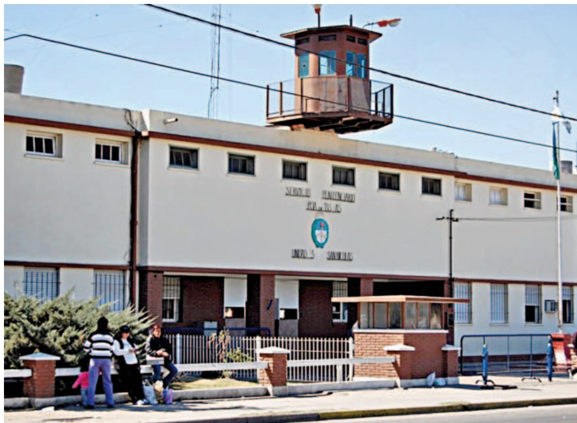
La Unidad Penitenciaria N° 3 de nuestra ciudad supera ampliamente la media provincial.

El servicio público bonaerense cuenta con 54 cárceles, cuatro alcaidías penitenciarias, 15 alcaidías departamentales y una unidad de tránsito conformando un total de 74 establecimientos, organizados en 12 complejos penitenciarios. Hay seis establecimientos destinados exclusivamente a mujeres, 13 a mujeres y varones y tres a varones y mujeres trans. Distribuidas entre todos ellos fueron contabilizadas 58.669 personas privadas de libertad en el mes de julio de 2024. De ese total, 885 internos, entre mujeres y varones, se encuentran en la penitenciaría de San Nicolás cuyo cupo es de 358 personas, lo que representa un exceso de población ubicado en el orden del