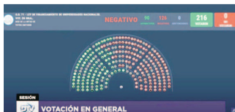
La universidad pública en el eje de la discusión.

Sobre la necesidad de recomponer el poder adquisitivo de do-