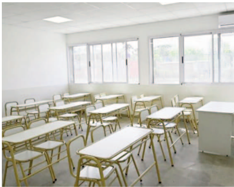
Aulas sin alumnos los días de paro, por ahora.

A partir del tercer día, ya sea continuo o discontinuo, deberá estar el