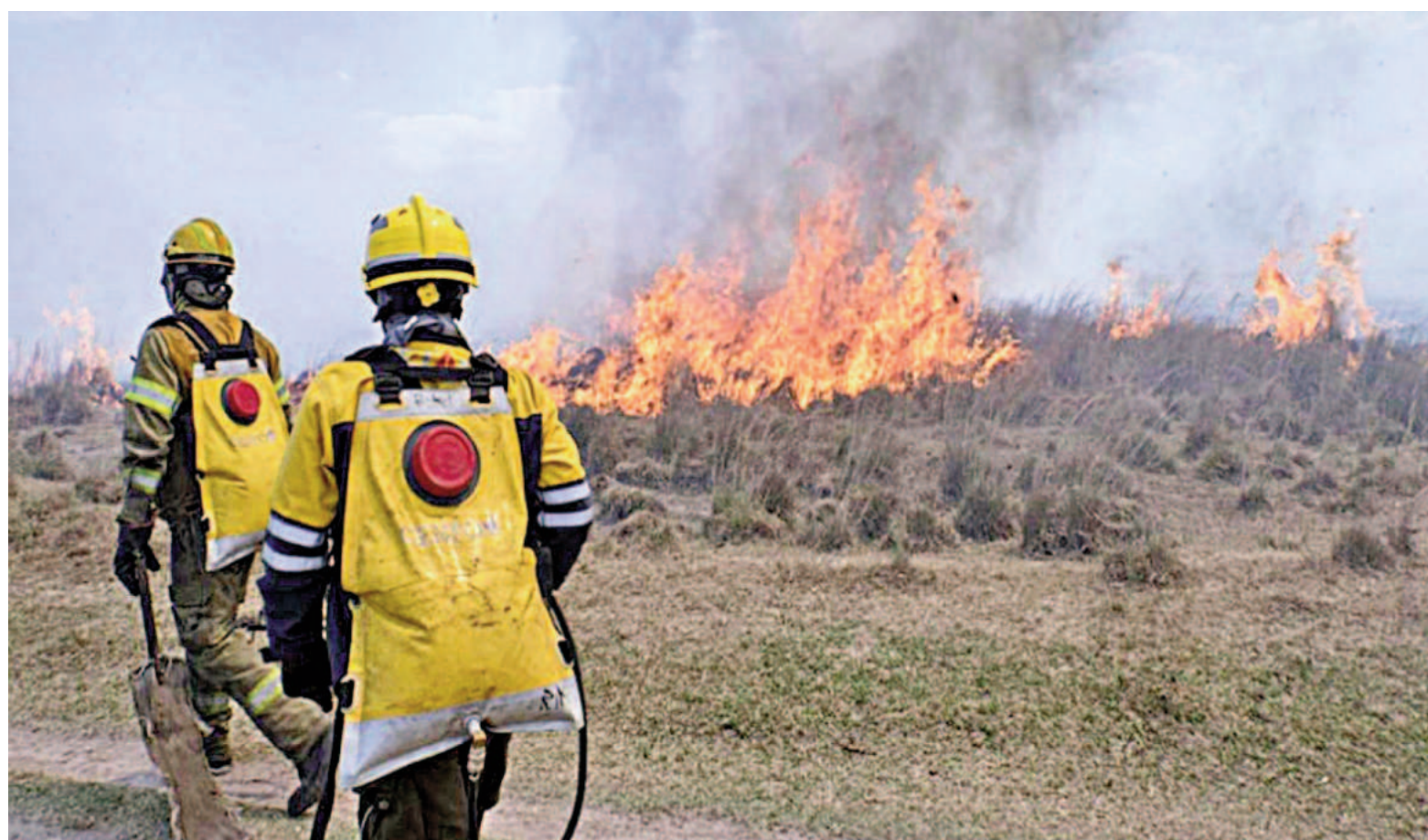
Esta semana, cuando se reportaron quemadas de pastizales en la zona de islas, se encendió nuevamente la preocupación de los vecinos en la región.

Esta semana, cuando se reportaron quemadas de pastizales en la zona de islas, se encendió también la preocupación de los vecinos en la región, sobre todo en el caso de personas con dificultades respiratorias. El hu-