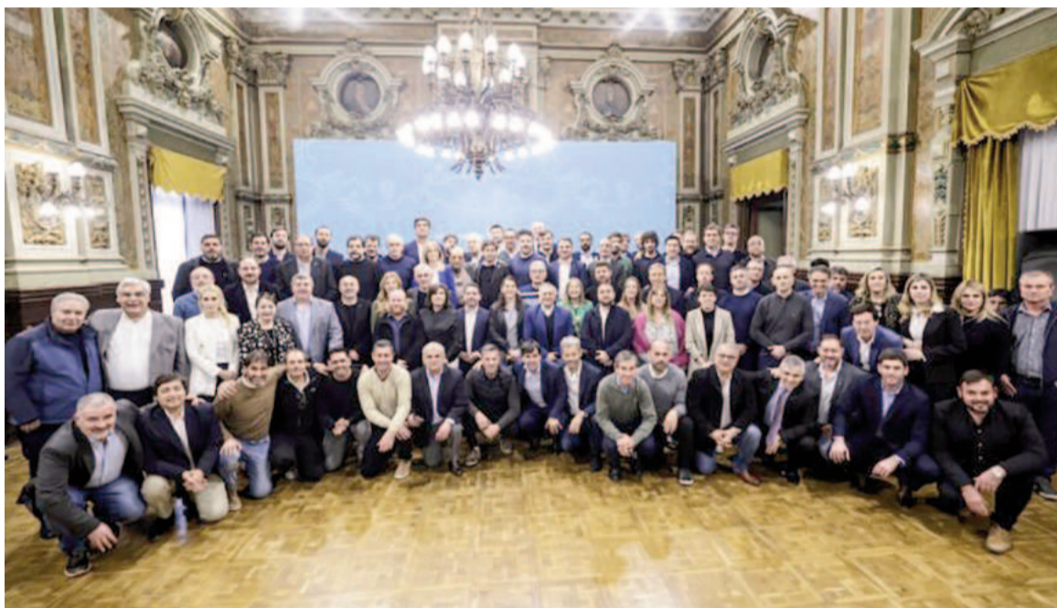
Decena de intendentes acompañaron la entrega de fondos.

El Fondo de Fortalecimiento Fiscal fue aprobado mediante una ley de la Legislatura aprobada a fin de año pasado y se gira en cuatro cuotas de $38.106 pesos cada una que terminan de pagarse en octubre. Kicillof en-