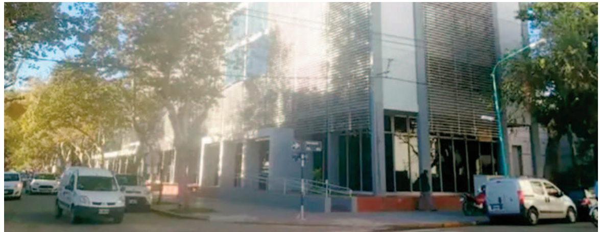
Zapata fue condenado por abuso sexual en un juicio oral realizado en los Tribunales de Rafaela.

Por los abusos cometidos en perjuicio de la niña, Zapata fue condenado por los delitos de “abuso sexual gravemente ultrajante por las circunstancias de su realización reiterado y agravado por haber