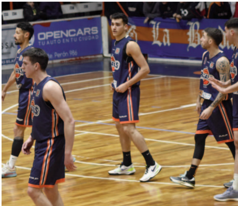
Regatas debuta esta noche en el torneo visitando a Independiente de Zárate.