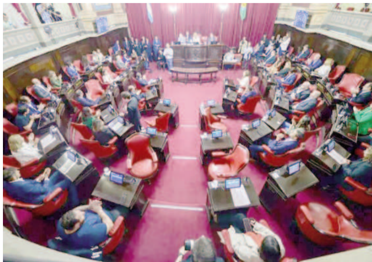
El Senado bonaerense espera el nuevo pliego judicial.

Desde la Cámara Alta comentaron que "todavía no tenemos confirmación de eso, aunque sí escuchamos los comentarios. De entrar