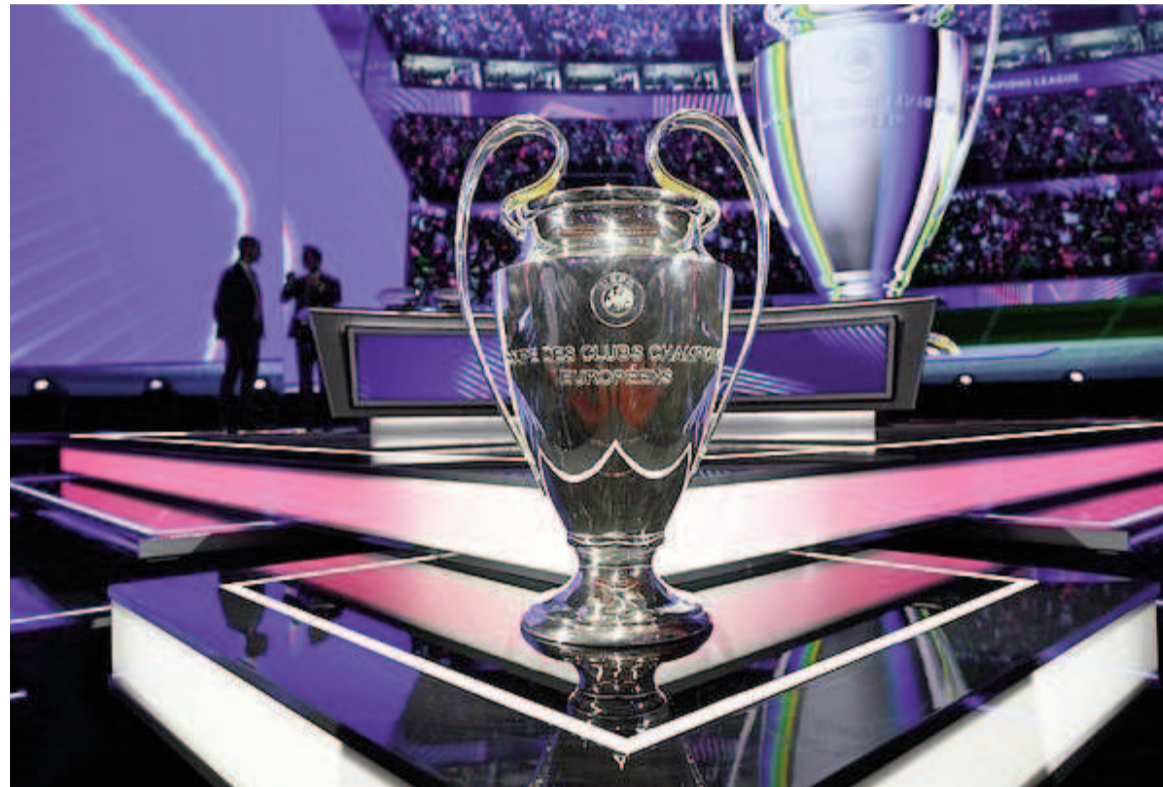
La Champions cambió su forma de disputa y desconcertó a los fanáticos.

El torneo más importante de clubes de Europa se jugará de una manera diferente a partir de este año: son 36 equipos en una fase de liga y hay cruces importantes desde el arranque.