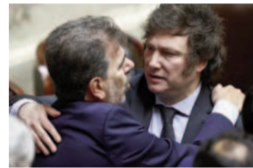
Javier Milei y Cristian Ritondo

A ese escenario adverso se sumó la crisis en la bancada oficialista que culminó con la expulsión de la diputada Lourdes Arrieta del espacio luego de las sucesivas denuncias contra sus pares por la visita al Penal de Ezeiza donde se reunieron con ex represores, entre ellos Alfredo Astiz.