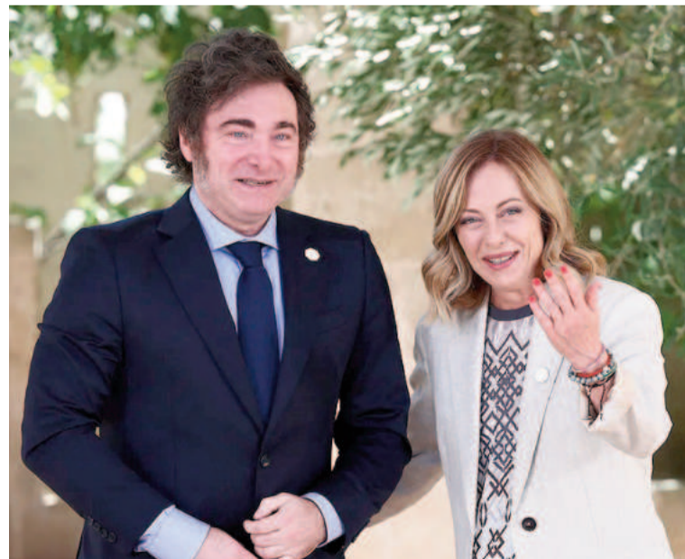
Meloni junto al presidente Javier Milei.