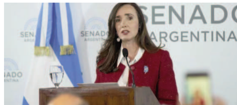
Victoria Villarruel no acompañó la expulsión de Paoltroni.

tular de la Cámara Alta para "solicitar la expulsión del bloque" del senador formoseño. Es por eso que desde el despacho presidencial respondieron que "es improcedente" porque no está dentro de las facultades de la titularidad de la Cámara la conformación de los bloques y mucho menos las expulsiones. "Si lo quieren echar, que lo hagan ellos", explicaron fuentes relacionadas a la decisión. El punto, además, es que Villarruel no está de acuerdo con la decisión. Días atrás, cuando comenzó a trascender la idea de los libertarios de expulsar al senador, la vicepresidenta de la Nación se había mostrada contraria a la idea. "Paoltroni es un senador que defiende sus convicciones. Siempre expresa sus disidencias de frente, no se alía con nadie que no sea de LLA, ¿por qué ha-