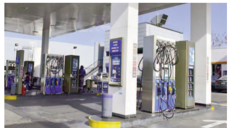
Es el décimo aumento en lo que va de la nueva gestión presidencial.

Por otro lado, resta la actualización de impuestos pendientes por hasta $ 135 en la nafta y $ 87 en el gasoil,