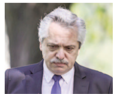
El expresidente Alberto Fernández.

Estos nuevos documentos que ingresaron a la investigación podrían cotejarse con la historia clínica de Fabiola Yañez solicitada a la clínica INECO (Instituto de Neurología Cognitiva) donde la exprimera dama hizo un tratamiento. Además, no es menor señalar que fueron presentados luego