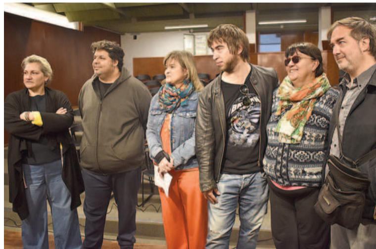
Para el ciclo fueron convocadas las realizaciones audiovisuales locales más destacadas de los últimos años.

2014 con duración 65 minutos. Cuenta la historia de un caserío humilde, de gente sencilla; es la historia de un pueblo ilusionado, ante un giro del destino.