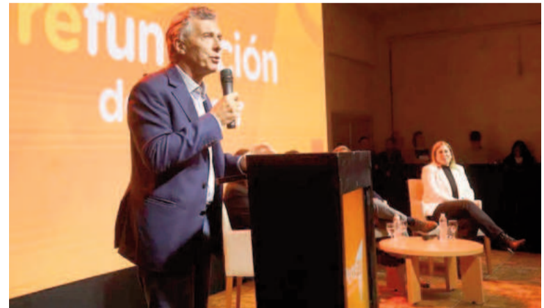
El expresidente Mauricio Macri relanzó la Fundación Pensar.

El puntapié inicial del encuentro de Pensar lo dio a las 16 el anfitrión Frigerio; acompañado por la vi-