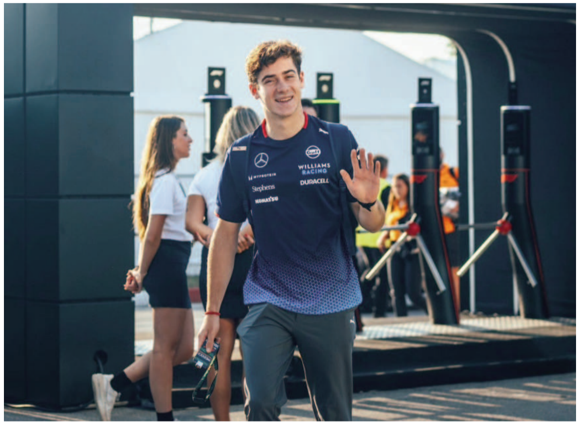
El debut del argentino genera enorme expectativa en nuestro país. WEB

La final del Gran Premios se llevará a cabo este domingo a partir de las 10 de la mañana de nuestro país, aunque su primer contacto con la veloz pista italiana será hoy a las 8:30, cuando se desarrolle la primera tanda de entrenamientos. Un rato más tarde, a partir de las 12, será el turno de la segunda tanda. Ya el sábado, la tercera práctica libre está prevista para las 7:30, mientras que a partir de las 11 será el momento de salir a clasificar. En la Q1 necesita quedar entre los 15