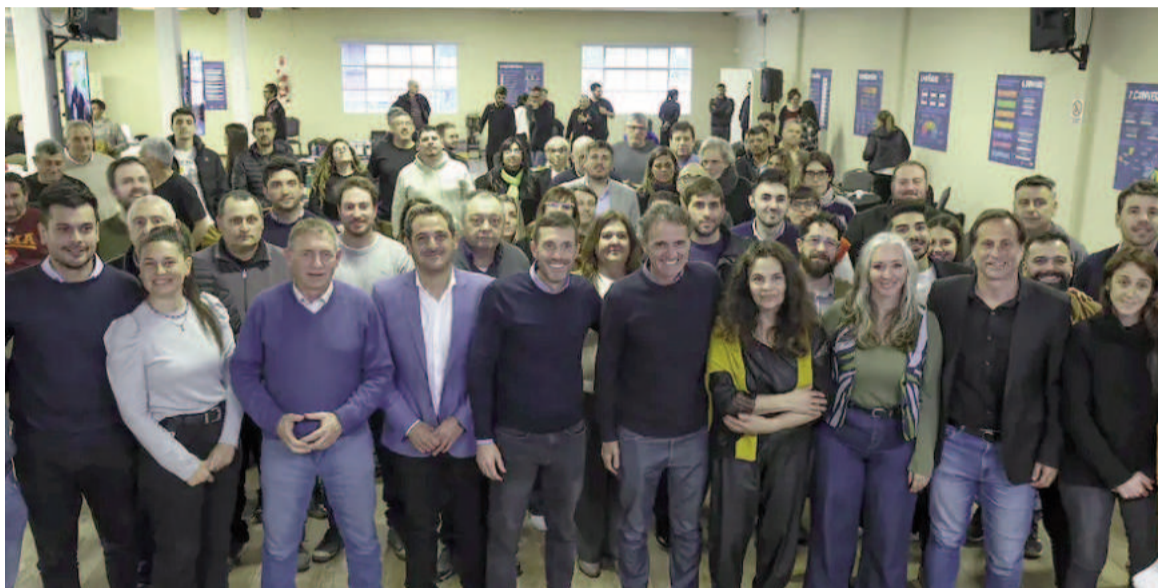
El titular del Ministerio de Infraestructura y Servicios Públicos salió a recorrer la provincia.