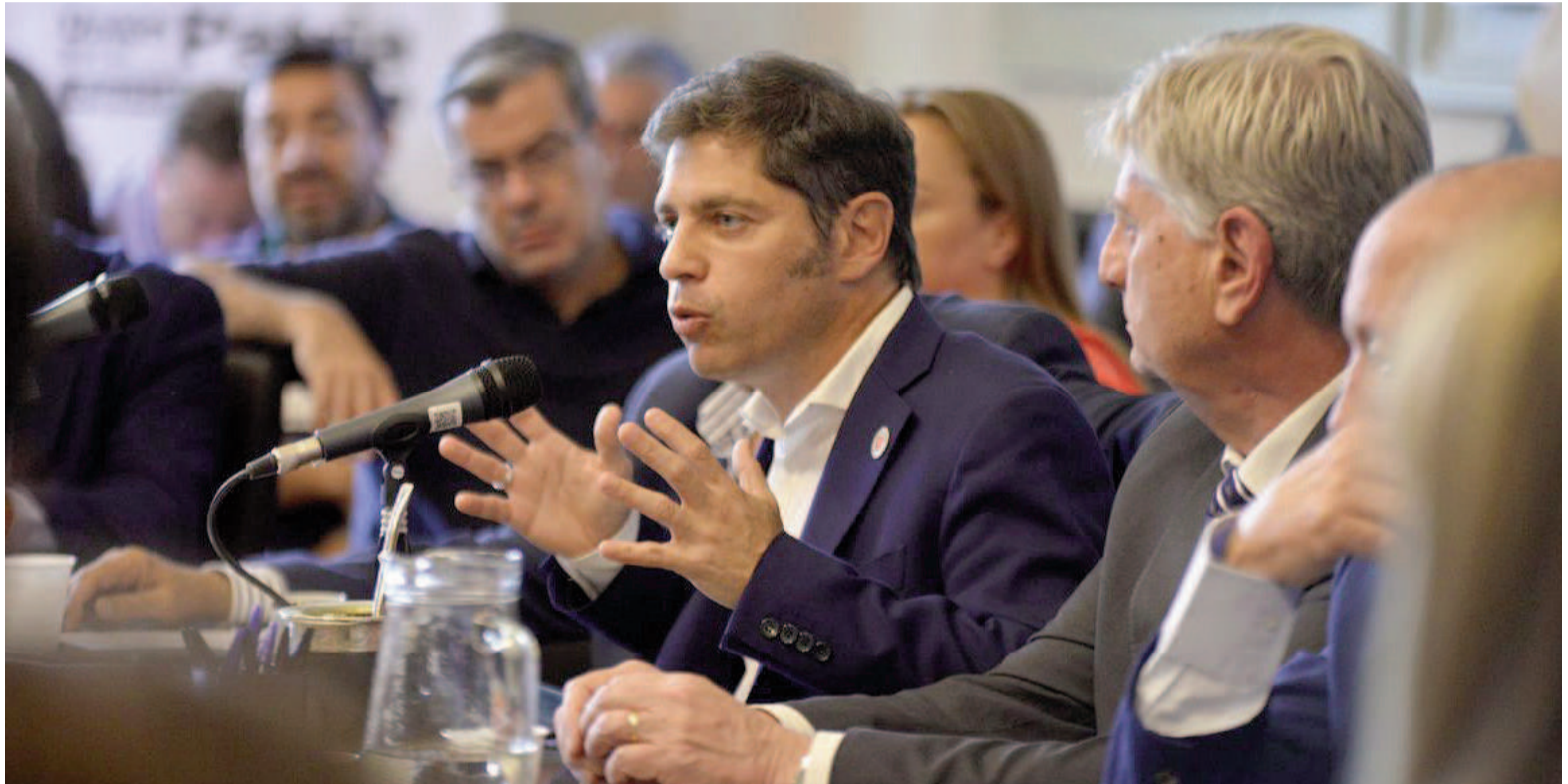
Los gobernadores peronistas unen fuerzas de cara al Presupuesto 2025.

La idea es buscar consensos para actuar alineados contra las políticas