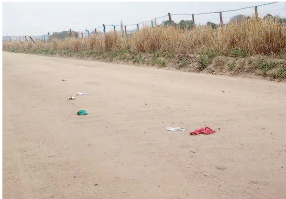
El misterio de las prendas íntimas sobre una de las rutas.

En las afueras de Colonia Caroya aparecieron varias prendas femeninas esparcidas a lo largo de un camino rural. "No hubo una denuncia judicial ni hay cámaras de seguridad en la zona para saber el origen de esto", afirmó el comisario departamental.