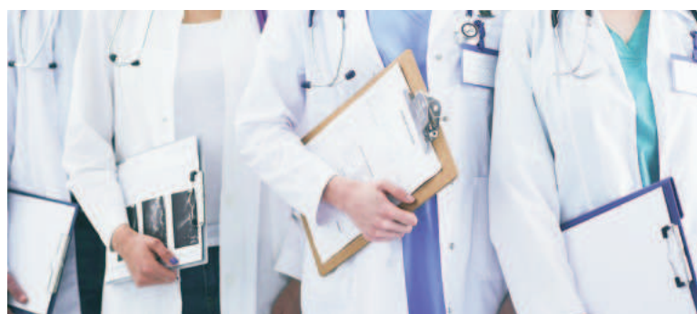
El San Felipe cuenta con un total de 16 residencias activas. ILUSTRACIÓN

Cabe recordar que el San Felipe cuenta con un total de 16 residencias