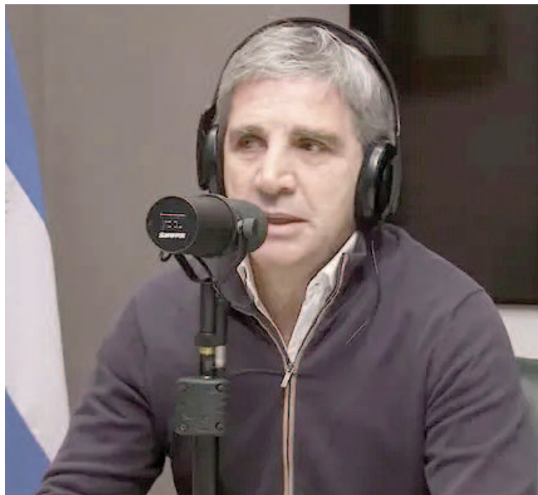
Caputo estrenó el nuevo canal de stream del Ministerio de Economía.

Con las aclaraciones y anuncios de Caputo, el Gobierno avanza con uno de sus objetivos centrales para la reactivación de la economía: que los dólares que tienen los argen-