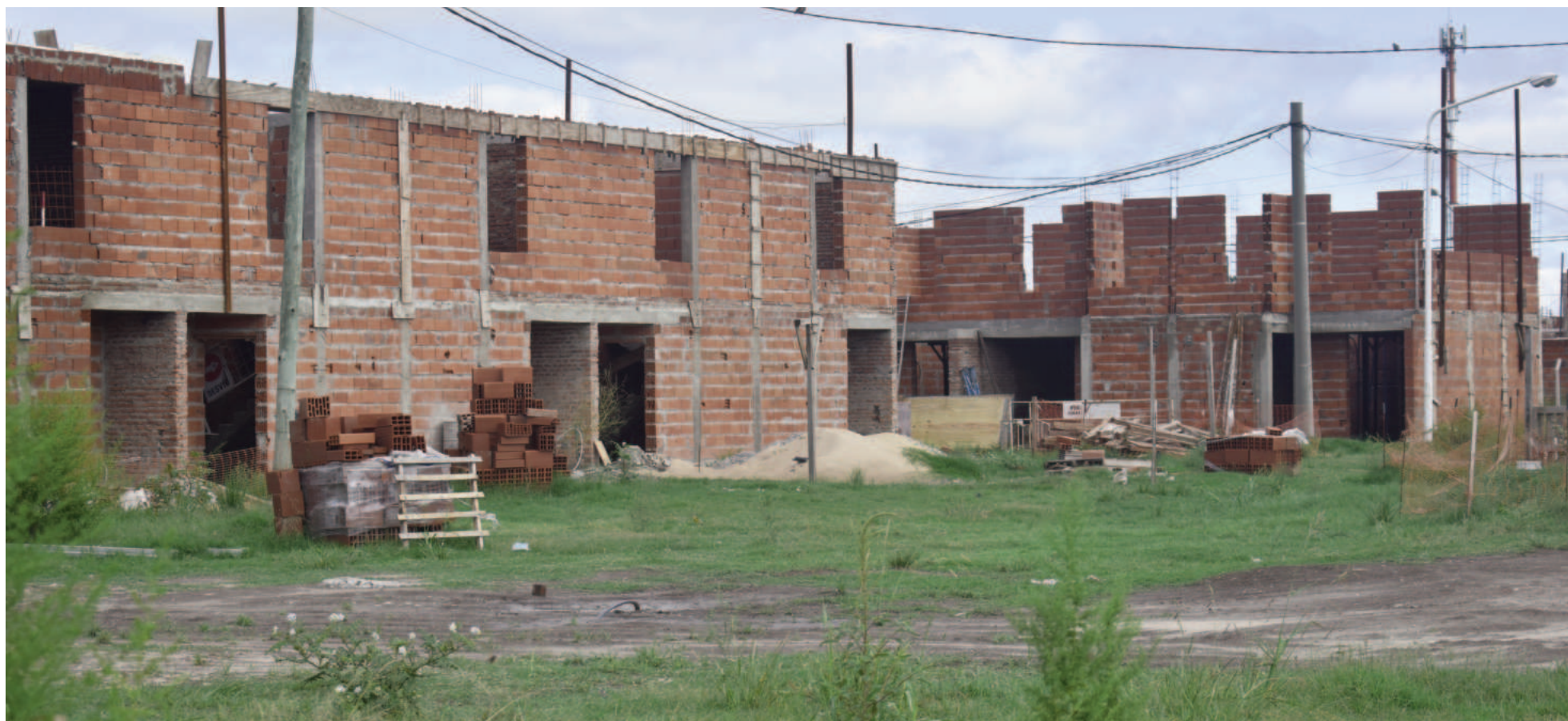
El freno a la construcción de viviendas del Procrear dejó una importante cantidad de mano de obra desocupada en la Uocra San Nicolás.