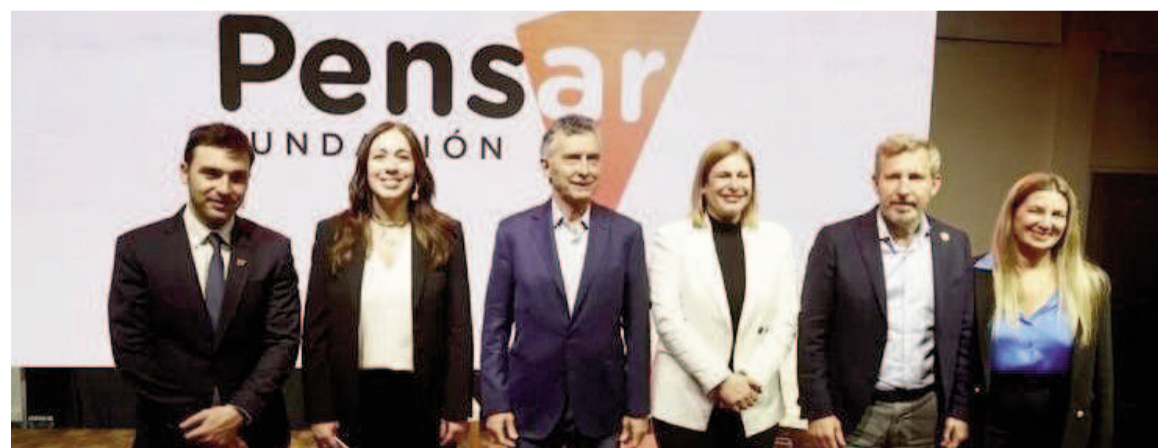
Figuras del PRO en la presentación de la Fundación Pensar.

"Se comprometió a dar un Presupuesto y que sea de déficit cero. No se puede gastar más de lo que