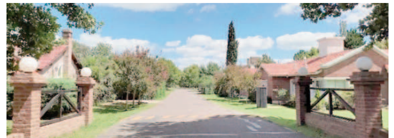
En el complejo habitacional Las Marías asaltaron a los moradores de una casa.

Los detectives de la DDI Pergamino se encargaron de la investigación reconstruyendo el recorrido previo y posterior al atraco para obtener imágenes de la zona aledaña que hayan utilizado para acercarse y luego escapar.