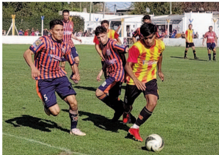
El conjunto azul naranja buscará su primera victoria.

El "Náutico", subcampeón del Apertura, debutó con un magro empate frente a 12 de Octubre en Soler y América. Mostró déficit en la zona de generación y escaso poder ofensivo, por lo que le costó llegar al arco