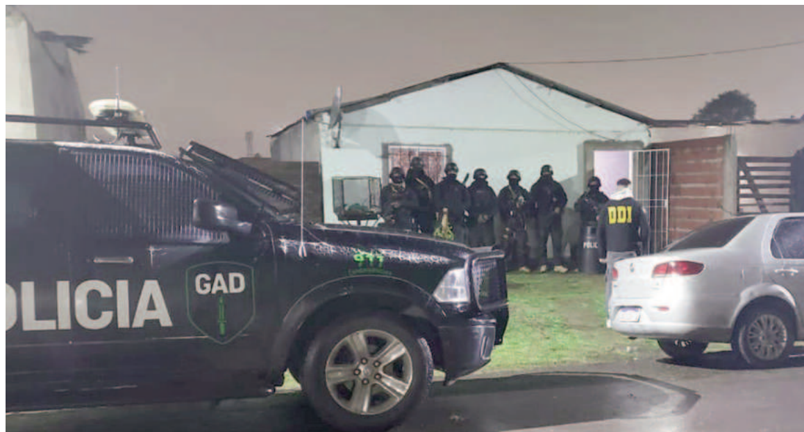
En la madrugada de este sábado detuvieron al hombre prófugo de la Justicia.