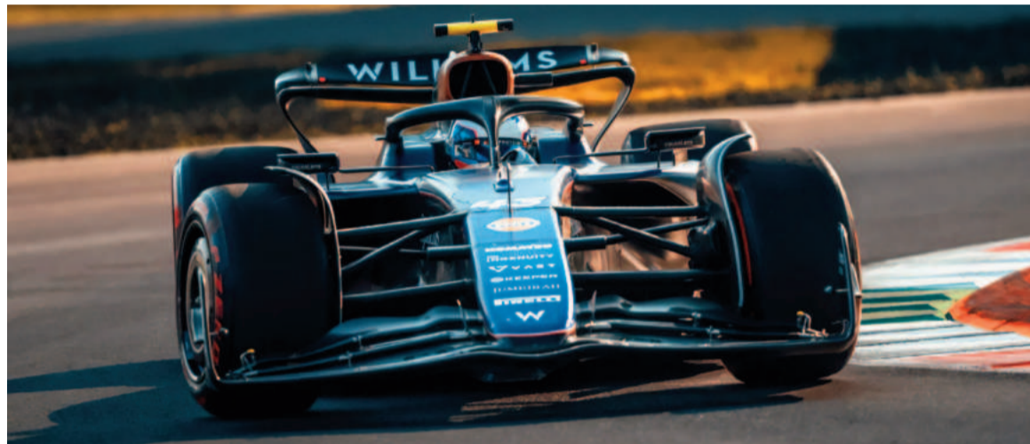
“Sé que teníamos para más”, reconoció Franco tras la clasificación.

Luego de terminar la clasificación, Colapinto declaró que está contento porque «es un momento importante», pero que «no estoy contento con el resultado final porque sé que teníamos