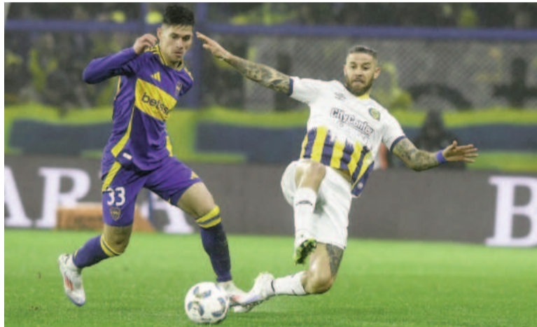
El Xeneize pegó primero y ganó.