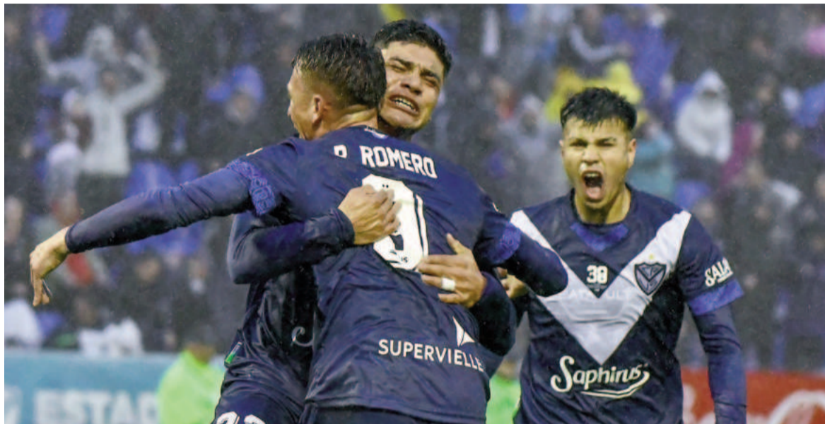
El Fortín está imparabile en la Liga Profesional.