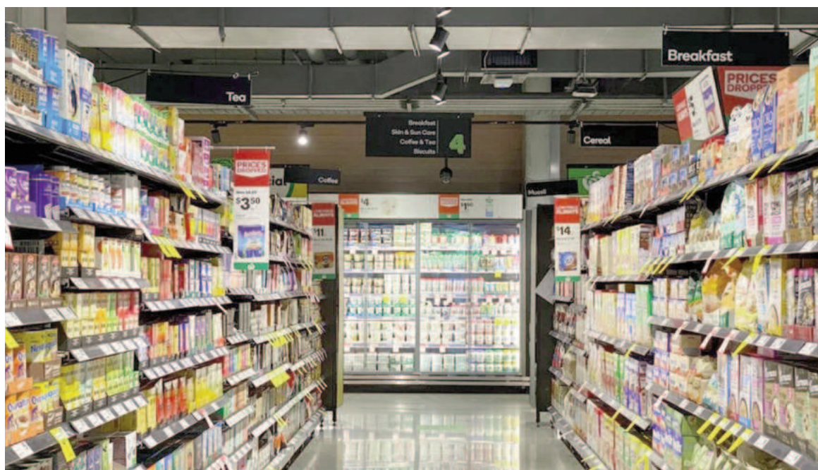
Supermercados se quejan por las tasas que les cobran algunos municipios.

"Tenemos un ejemplo palmario de ello en Lanús, provincia de Buenos Aires, donde la Tasa de Seguridad e Higiene ha pasado injustificadamente a tributar con una alícuota de 6% de la facturación (superior a la de Ingresos Brutos). No es un hecho ais-