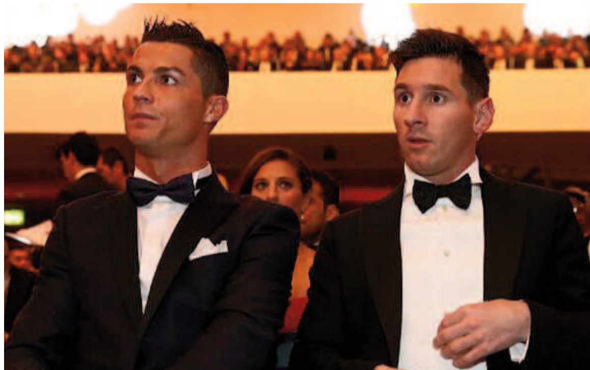
Cristiano y Messi en las épocas en las que peleaban mano a mano por el Balón de Oro.

En lo que constituye un hecho histórico, ninguno de los dos futbolistas estará en la premiación que se realizará el 28 de octubre en París, algo que no sucedía desde 2023. El argentino tiene ocho galardones y el portugués cinco.