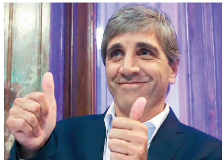
El ministro de Economía, Luis Caputo, y su optimismo en la tarea desarrollada.

Y enumeró: La inflación va a bajar La economía va a recuperar Los impuestos van a bajar Las regulaciones van a colapsar El crédito privado va a explotar La demanda de dinero va a aumentar Los pesos van a faltar Los dólares van a sobrar El dólar financiero va a converger al dólar oficial Los salarios van a recuperar La pobreza va a bajar Una suerte de decálogo optimista en el que viene insistiendo desde hace meses.