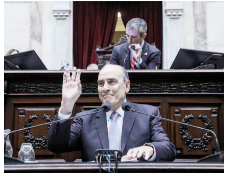
Guillermo Francos, jefe de Gabinete, brindó su informe en Diputados.

El jefe de Gabinete detalló que entre el 2020 y el 2023 “las jubilaciones sufrieron una caída del 45%