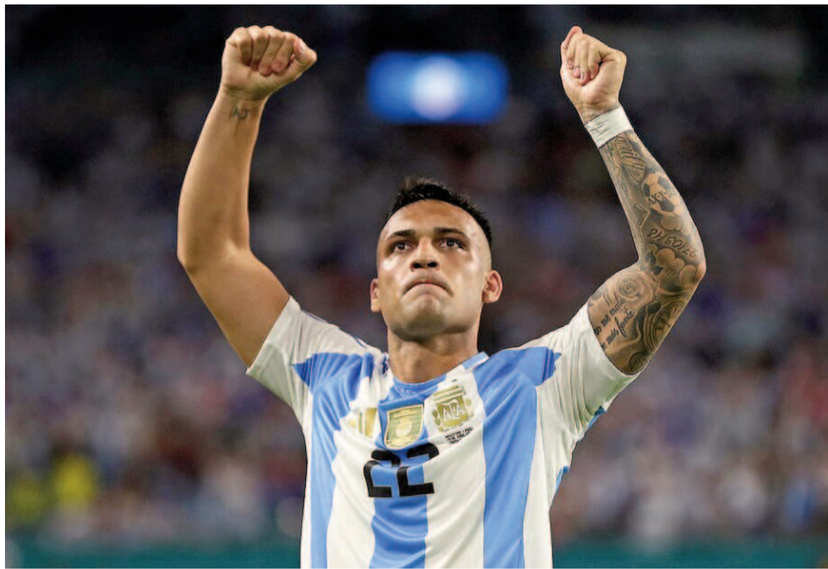
La selección albiceleste buscará un triunfo ante la roja.

De esta manera, la defensa estaría conformada por Nahuel Molina, Cris-