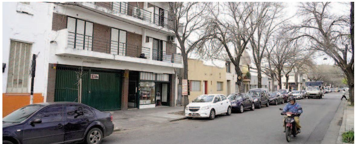
Mitre al 2300, lugar donde sucedió el hecho.

“La chica se sintió amenazada porque el papá de la nena que iba a