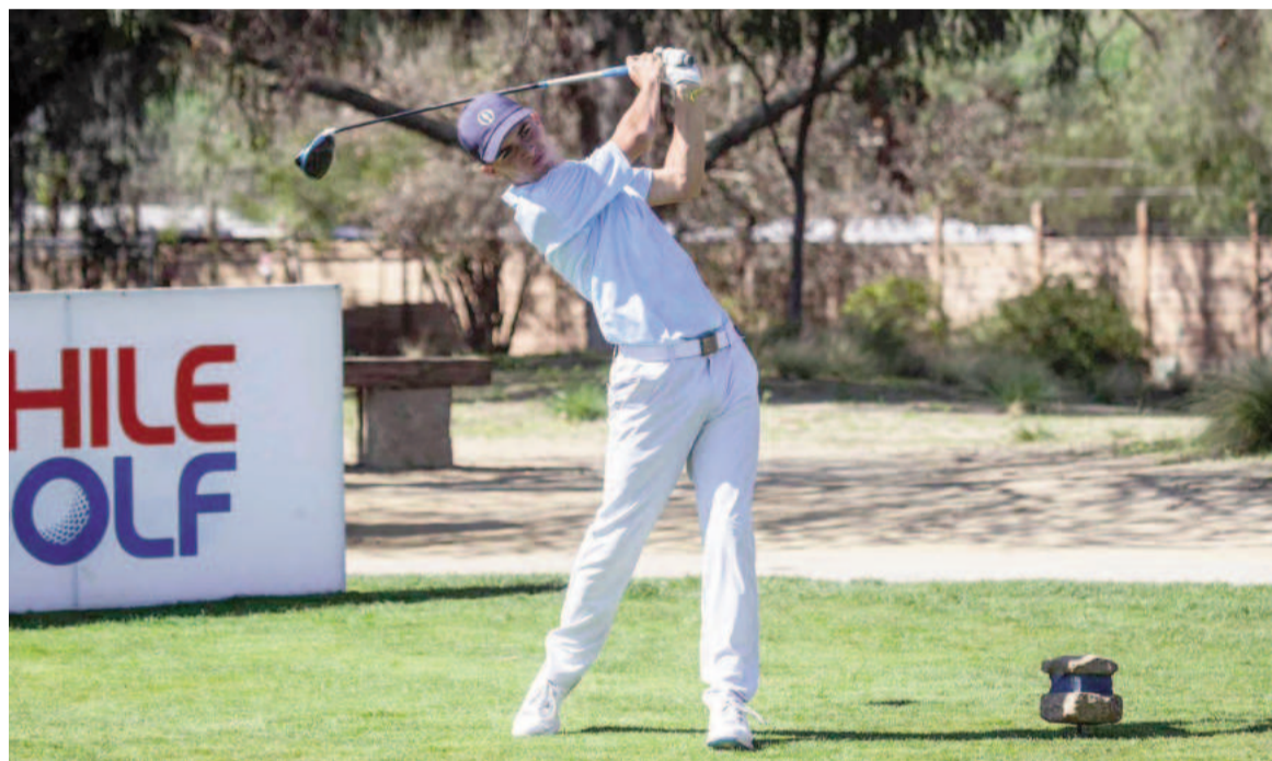
El nicoleño en el Abierto Juvenil de Chile, apenas unos días atrás.