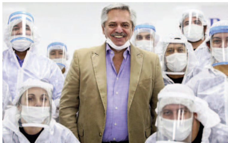
Alberto Fernández sigue sumando causas en su contra.