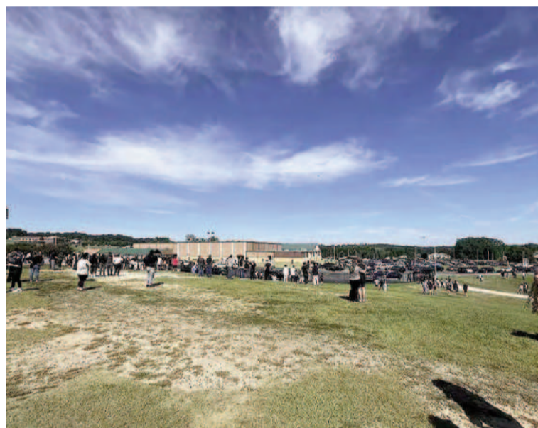
Estudiantes evacuados de la escuela, que tiene unos 1900 alumnos.

Imágenes capturadas en el lugar muestran al menos cinco ambulancias