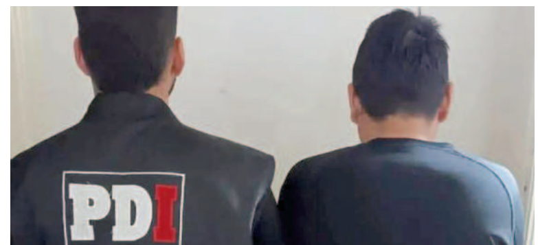
El sospechoso, de 29 años, tenía pedido de captura.