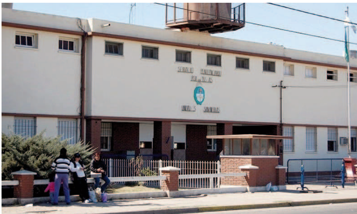
El acusado llegó al juicio bajo prisión preventiva alojado en la Unidad Penal N° 3.

Los hechos investigados y llevados a juicio habrían ocurrido en-