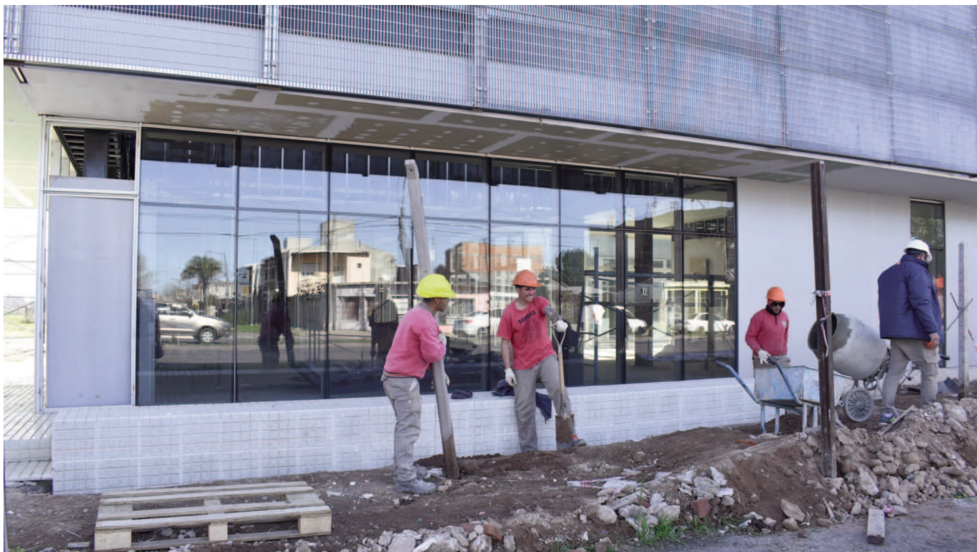
Pese a la paralización de la obra pública nacional, la construcción del hospital de zona sur se financia con recursos municipales.