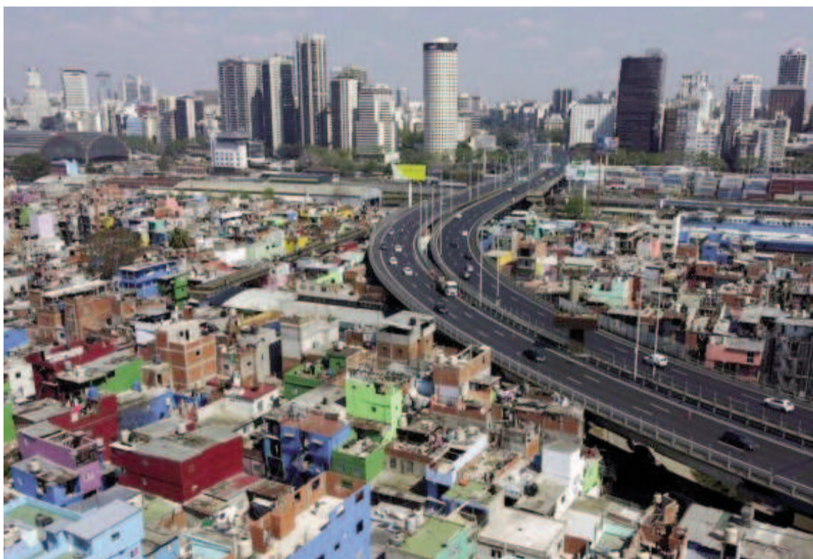
Desde la UCA no creen que en el corto plazo se logre volver a los niveles de pobreza e indigencia del 2023.

Según el sondeo de la UCA, 24,9 millones, residentes en áreas urbanas del país habrían estado en situación de pobreza por debajo de la Canasta Básica Total (CBT) que en junio alcanzaba a $ 873.168, para una pareja con dos niños de