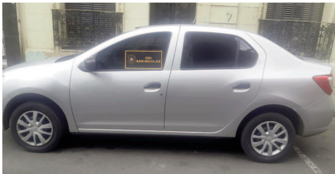
Además de la detención del sospechoso, se incautó un automóvil Renault Logan, seis teléfonos celulares, una tablet, la suma de 700.000 pesos y 1000 dólares en efectivo.

El otro cómplice había sido aprehendido el 22 de agosto pasado luego de que efectivos de la Dirección Departamental de Investigaciones lograran identificarlo y detenerlo en Rosario. La investigación se había iniciado tras dos denuncias presentadas en nuestra ciudad. El último ilícito perpetrado en el mes de abril había sido cometido en perjuicio de un hombre domiciliado