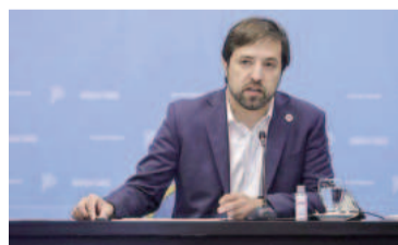
El ministro Kreplak habló respecto al conflicto IOMA - Femeba.

Y siguió: "Lo que sí nos llegaban eran las denuncias sobre cobros indebidos, sobre cobros excesivos a los afiliados del IOMA". Por eso, el funcionario sostuvo que tomaron esa decisión "luego de negociar y buscar alternativas, de hablar con