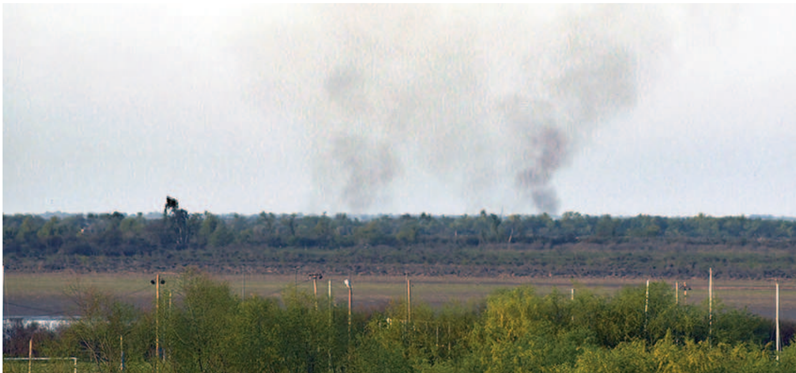
Tal como ocurriera en 2020, 2021 y 2022, ayer se pudo observar desde la costa nicoleña un foco de humo proveniente del sector de islas. EL NORTE

Frente al inminente regreso del fenómeno La Niña, una de las alertas