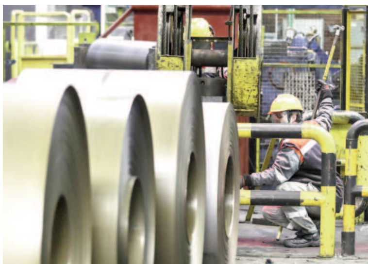
En el actual capítulo paritario, la UOM busca mejorar los salarios de julio, agosto, septiembre y octubre.

«La pretensión de la UOM para el primer tramo de la Paritaria 2024/2025 consiste en fijar incrementos para el cuatrimestre comprendido entre julio y octubre de 2024, en forma acumulativa y sujetos a una revisión a establecer sobre su modalidad y oportunidad en dicho periodo. Entendiendo que esos incrementos para ser tales, y no meramente recomposición de los niveles salariales erosionados como consecuencia de la depreciación de la moneda y del constante aumento de precios de bienes y servicios, exige que cuanto menos contemplen los efectos inflacionarios que menoscaban los ingresos de las y los tra-