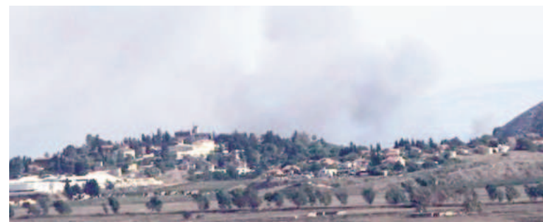
La incursión israelí dejó un lesionado y un sofocado.

Las tensiones en la frontera entre Líbano e Israel se agravaron el 8 de octubre de 2023 después de una serie de cohetes lanzados por Hezbolá contra Israel en solidaridad con el ataque de Hamas a Israel realizado un día antes. Israel respondió después con intensos ataques de artillería contra el sureste de Líbano.