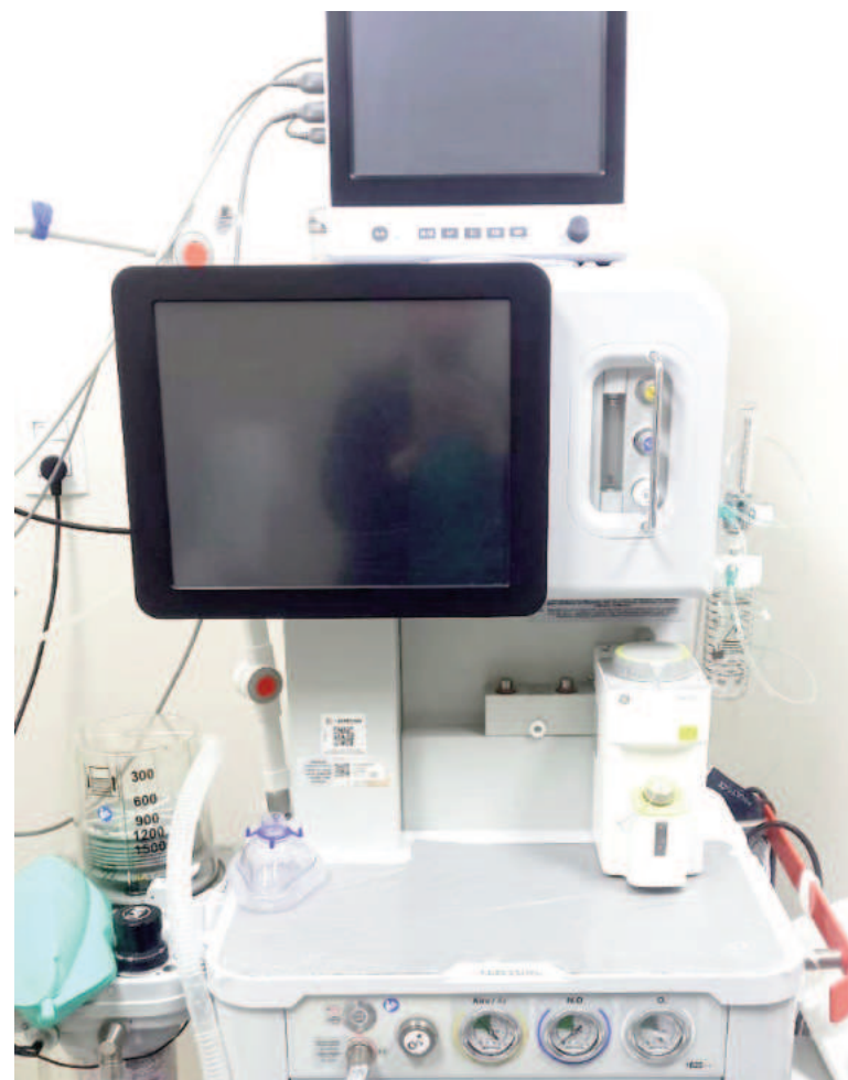
Se sumaron siete nuevas mesas de anestesia y monitores, para una mejor atención a pacientes sometidos a cirugías.

máximas instituciones de salud del país, orgullo de los metalúrgicos, a disposición de la comunidad, referente del norte de la provincia de Buenos Aires y sur de Santa Fe".