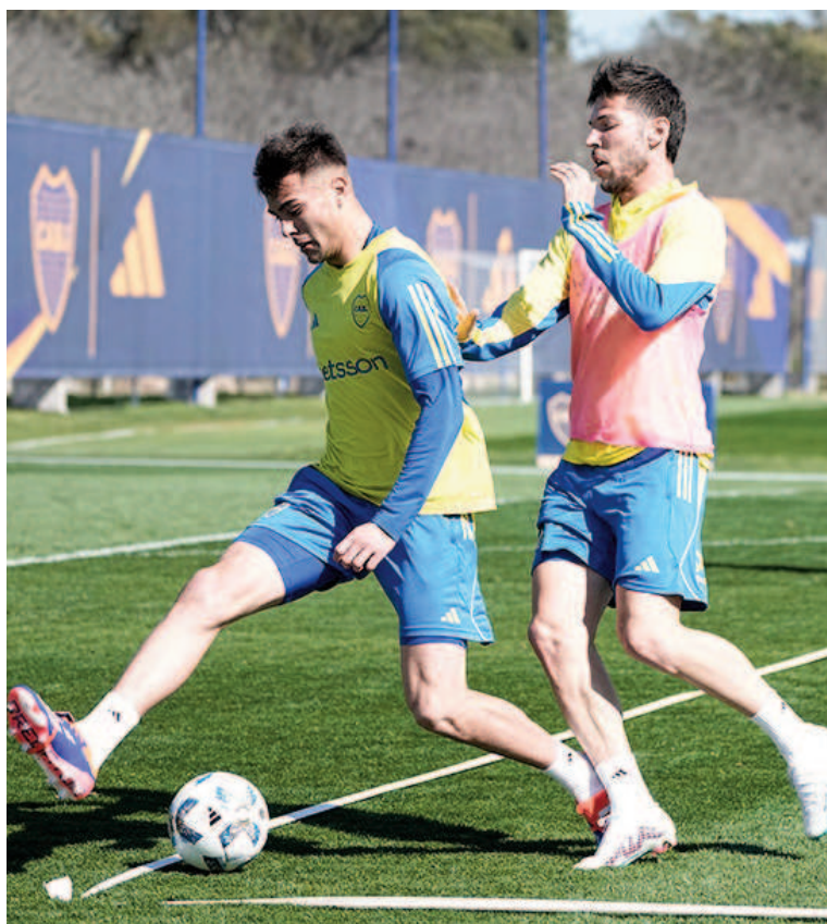
Boca no la tendrá sencilla hoy en Mendoza frente a Talleres.