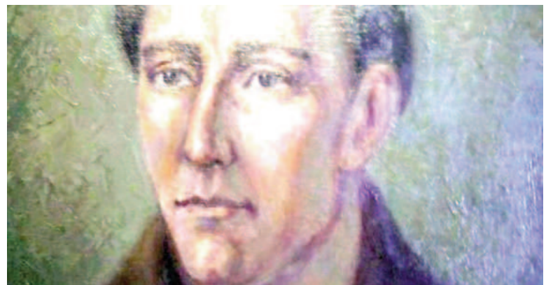
Fray Luis Beltrán murió el 8 de diciembre de 1827.

De hecho, inventó "las zorras", carros angostos de cuatro ruedas tirados por caballos con los cuales cruzó los cañones