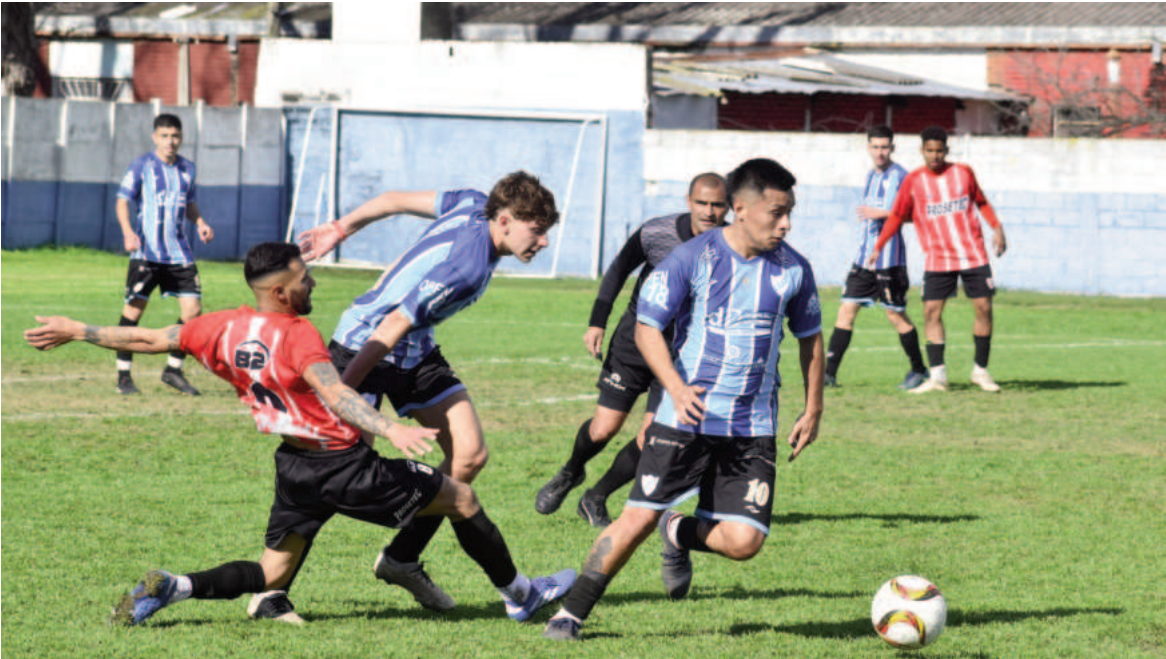
Paraná viene de golear a Fútbol San Nicolás y es líder de su grupo. EL NORTE

Social, por su parte, le ganó a Fútbol San Nicolás en el arranque y