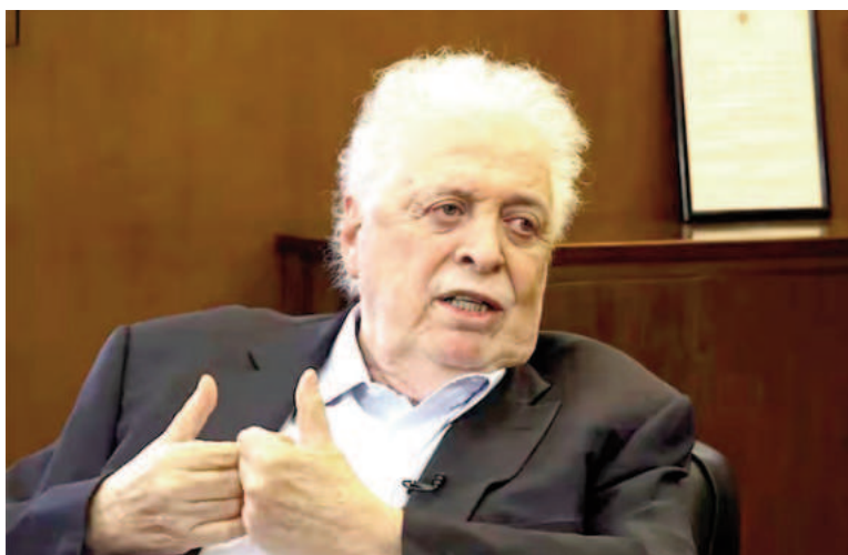
Ginés González García

Por este lado, Ginés señaló a la prensa como la que insiste en la cuarentena prolongada y expresó: «Fue el menor de Latinoamérica. Obviamente a uno no le gusta cosas del medioevo como el aislamiento, pero bueno, habíamos evitado la primera