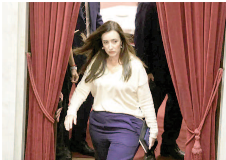
La vicepresidenta Victoria Villarruel reaccionó con dureza contra el excomandante montonero.

A sus 76 años, Firmenich vive en España desde fines de los 90, luego