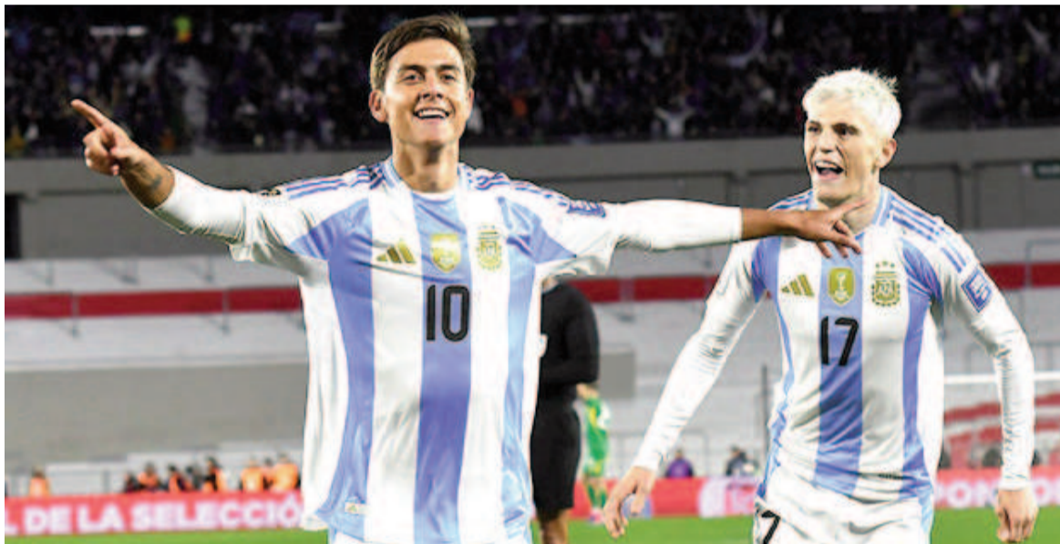
La Scaloneta brilló en el Monumental y se impuso por goleada.

La Selección Albiceleste fue netamente superior al conjunto trasandino y se impuso por 3 a 0 con goles convertidos en el complemento por Mac Allister, Julián Álvarez y Dybala. Con este triunfo se consolidó como único líder.