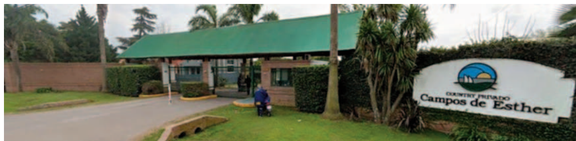
La entrada al barrio de Pueblo Esther donde ocurrió el robo.

Cuando la dueña de la casa se dio cita, constató que faltaba una caja fuerte portátil, la cual contenía una suma de diez mil dólares, además de alhajas, cheques y documentos.