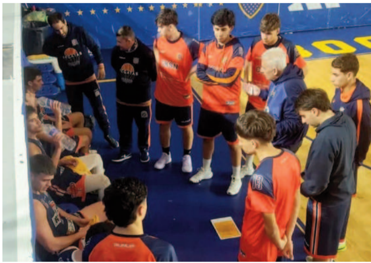
Regatas ya está entre los 16 mejores del torneo.

Cabe recordar que Regatas viene de sortear dos rondas clasificatorias en la Capital Federal. En la primera avanzó junto a Ferro, dejando atrás a Belgrano de nuestra ciudad y a Defensores de Villa Ramallo. Y poste-