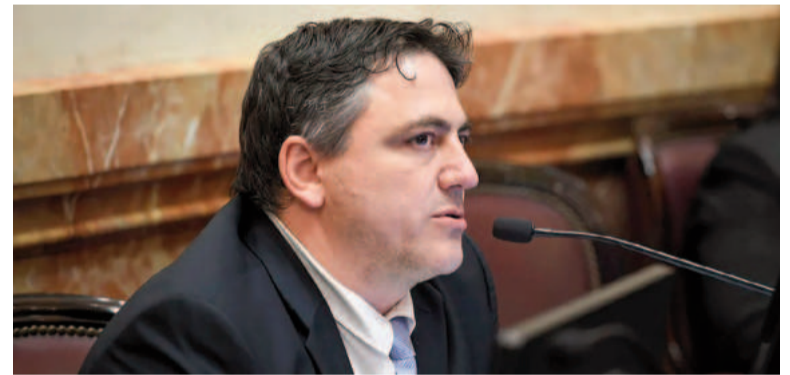
Senador Francisco Paoltroni, crítico contra Milei.