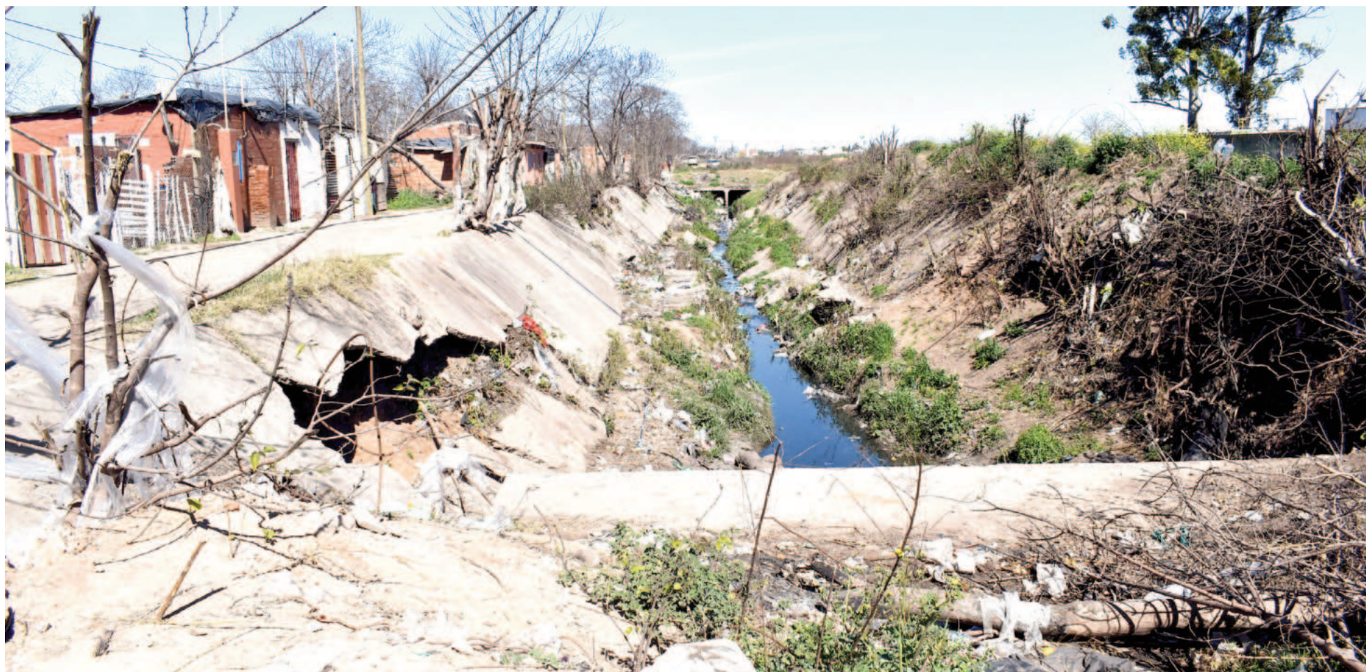
La obra, que fuera adjudicada a la empresa Luciano S.A., quedó paralizada a fines de 2019 cuando se produjo el cambio de gobierno provincial.