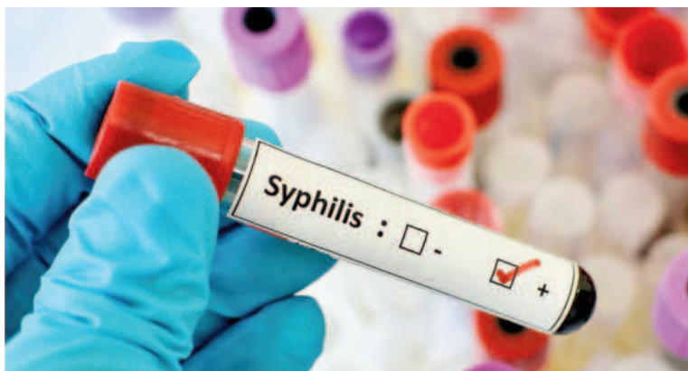
La Argentina registra un incremento sin precedentes en los casos de sífilis, alcanzando un pico histórico en 2023. ILUSTRACIÓN

Se transmite a través de relaciones sexuales (vaginales, anales u orales) sin preservativo con una persona que tenga sífilis, a través del contacto con las lesiones de la piel o de las mucosas, ya sean chancro o sífilides.