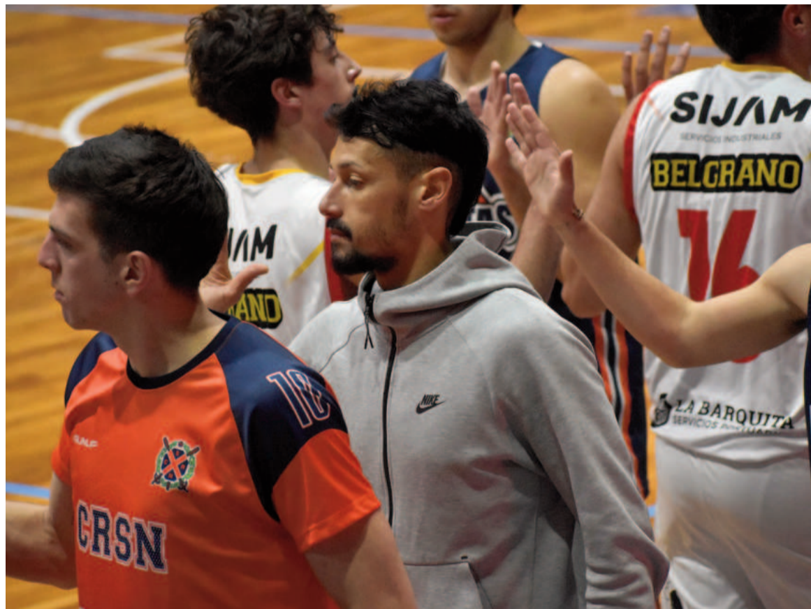
Regatas jugará por primera vez de local; Belgrano se presentará en Campana.