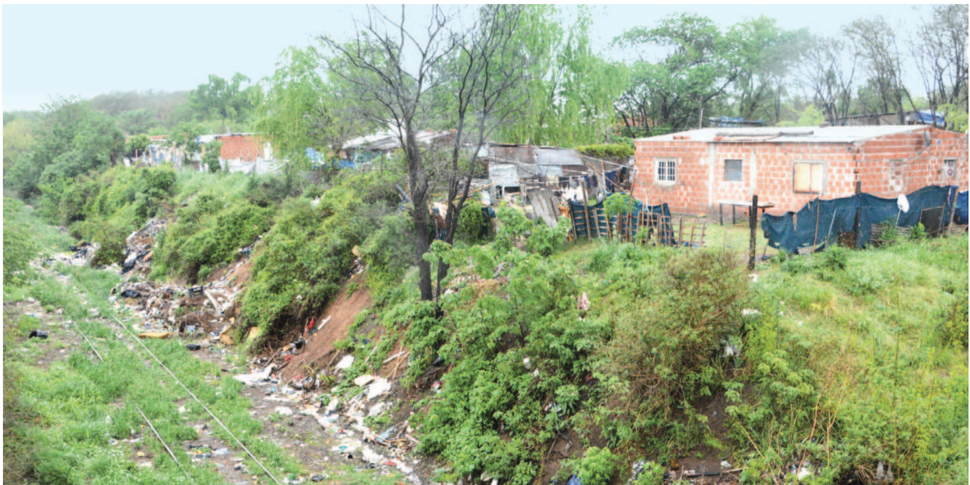
La expectativa ahora se centra en los resultados del informe actualizado que publicará el Indec.

El dato surge como resultado del cálculo del informe publicado por el Indec correspondiente al segundo semestre de 2023 en comparación con el que diera a conocer la UCA referido al primer semestre de 2024. Ambos organismos elaboran sus estadísticas a partir de la Encuesta Permanente de Hogares (EPH). El jueves 26 de este mes el Indec publicará los datos de los primeros seis meses del año.