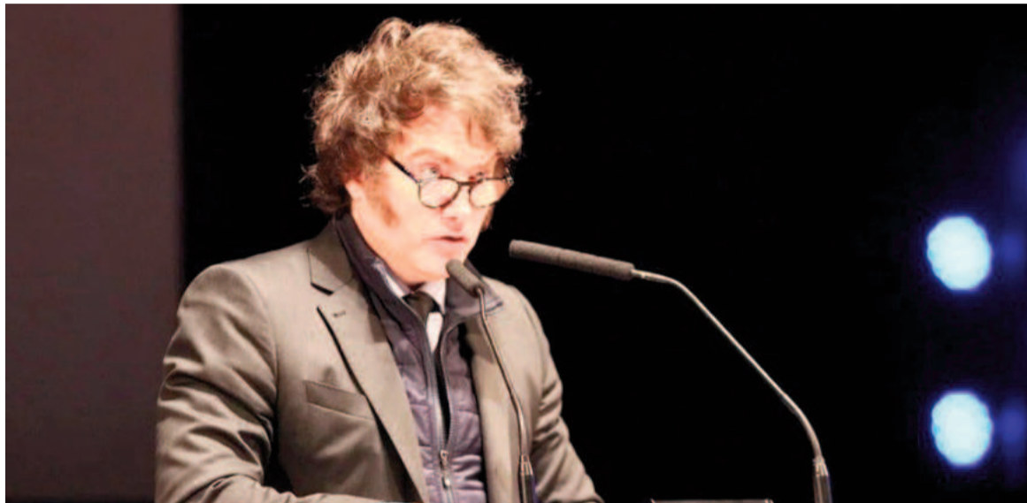
Milei participó del III Encuentro Regional de Foro de Madrid - Río de la Plata 2024 en el Centro Cultural Kirchner.

“No nos podemos dar el lujo de la dispersión y de las peleas intestinas, solo estando juntos podemos ser fuertes, solo siendo leales, de militante a militante, y ayudándonos entre nosotros, podemos defender