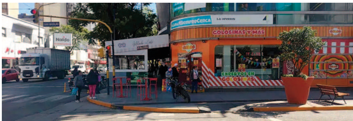
La víctima buscó refugio de los agresores en el interior de un local comercial.

El muchacho buscó refugio en ese comercio, donde irrumpieron las personas que lo venían corriendo.