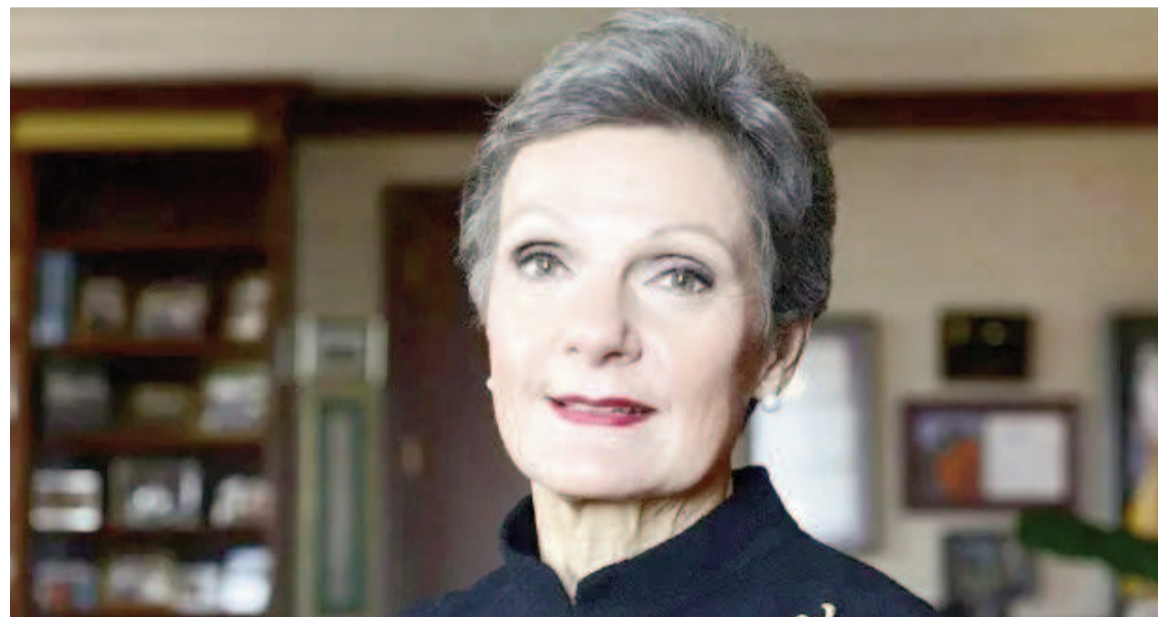
La jueza federal de Nueva York Loretta Preska.

Busca probar que el país manejó el precio de los combustibles. La orden salió del tribunal del Segundo Distrito Sur de Nueva York, donde ya se condenó a la Argentina a pagar 16.100 millones de dólares a los fondos Burford Capital y Eton Park.