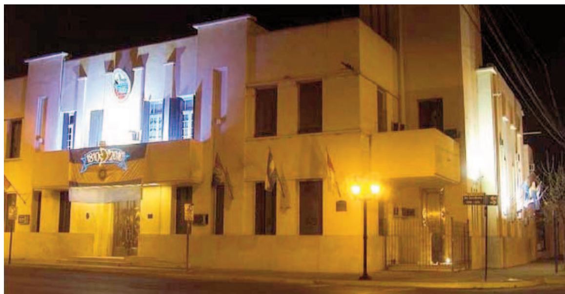
Comienzan a producirse cambios en la plantilla municipal.

Alejandro Longo formaba parte del gabinete municipal desde 2017,