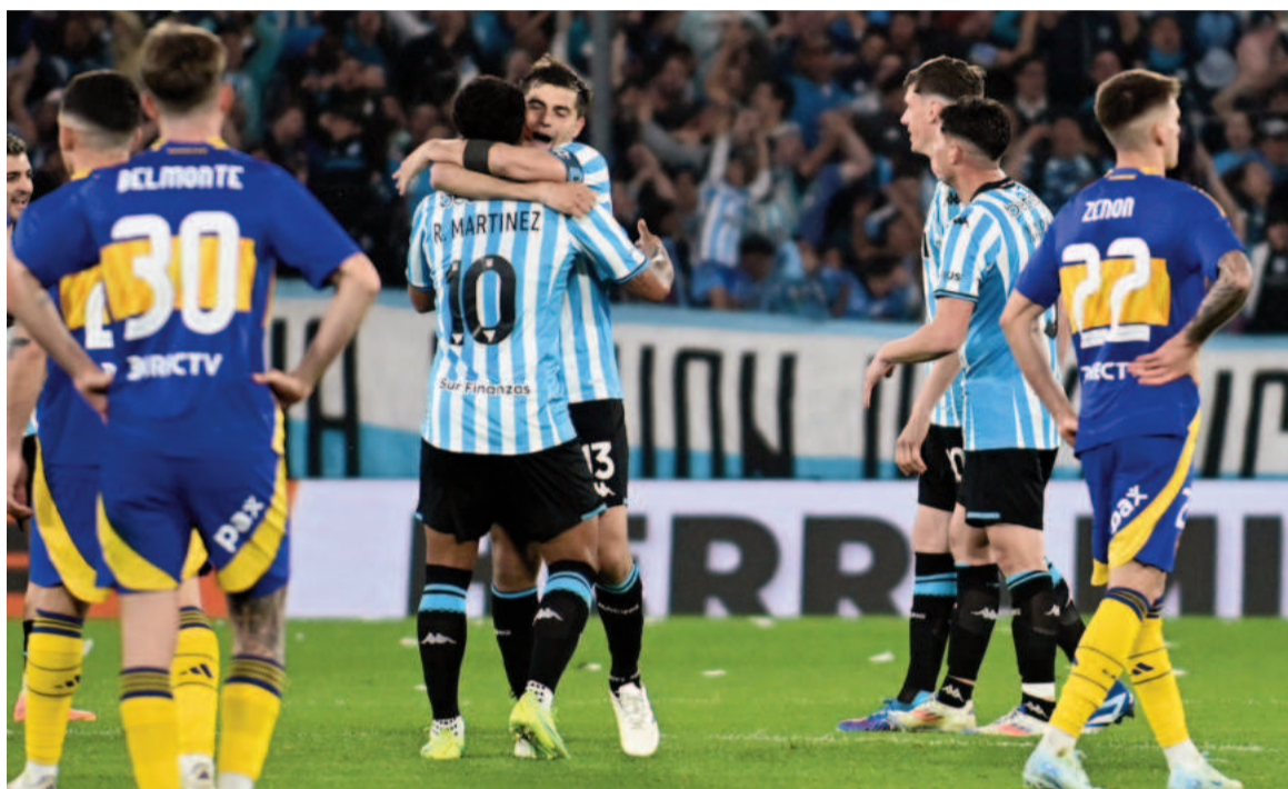
La Academia volvió a sonreír y no pierde la ilusión de pelear por el título.

Fue 2 a 1 en Avellaneda. El Xeneize había comenzado arriba gracias a Milton Giménez, pero una mala salida de Romero puso en partido a Racing con el empate de Nardoni. En el segundo tiempo, Roger Martínez le dio la victoria a la Academia.