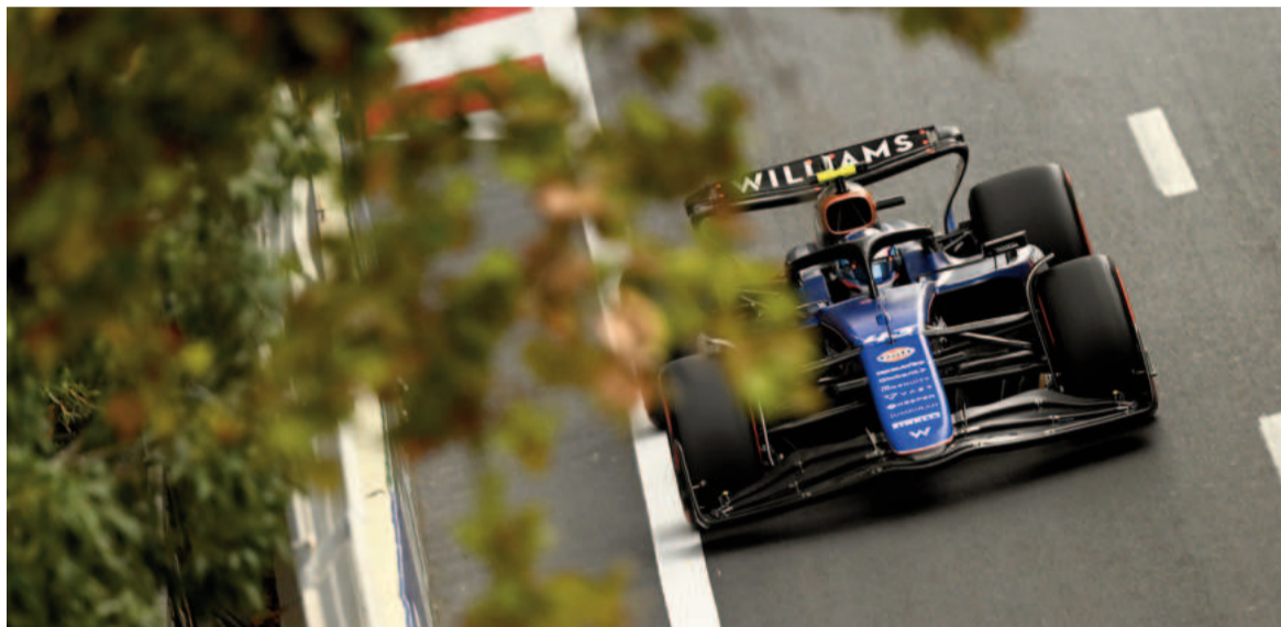
Con Colapinto, Argentina volverá a tener a un representante entre los primeros diez en la largada tras 42 años.

Pero a partir de allí mejoró cada vez más sus tiempos, para demostrar que está para pelear por los puntos.