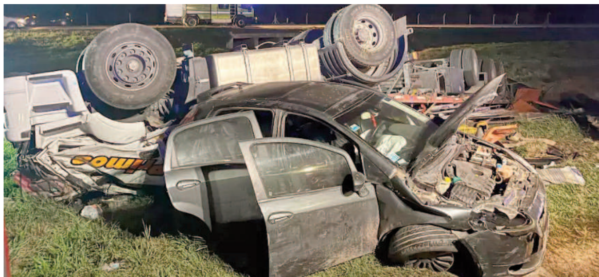
Trágico siniestro dejó un saldo de un muerto.

Este accidente conmociona a la comunidad de Villa Constitución, que hoy lamenta la pérdida de un trabajador reconocido en la zona.