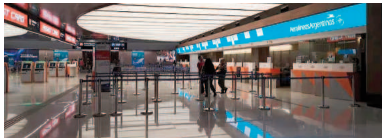
El piquete salvaje de Aerolíneas Argentinas dejó vacías las instalaciones.

ministro de Desregulación y Transformación del Estado, Federico Sturzenegger, criticó con dureza a los sindicalistas y aseguró que el piquete se debía a que no les habían dado "asientos en business" a los pilotos. También señaló que la empresa no generaba ganancias y que el aumento que podía ofrecer el Gobierno Nacional era del 0%. Desde la aerolínea low cost Flybondi confirmaron a Infobae que continúan operando desde el aeropuerto de Ezeiza. Esta decisión, sostuvieron, permitió que más de 15 mil personas pudieran viajar, sin embargo, el traslado de más de 60 vuelos -entre ayer y hoy- generó un "impacto económico y esfuerzo operativo" que "no es sostenible en el tiempo". Estiman que la operación desde y hacia Aeroparque se retomará a las 15 horas. Por su parte, el secretario de Transporte, Franco Mogetta, anunció que Biró será excluido del directorio de Aerolíneas Argentinas la próxima semana. Y amplió: