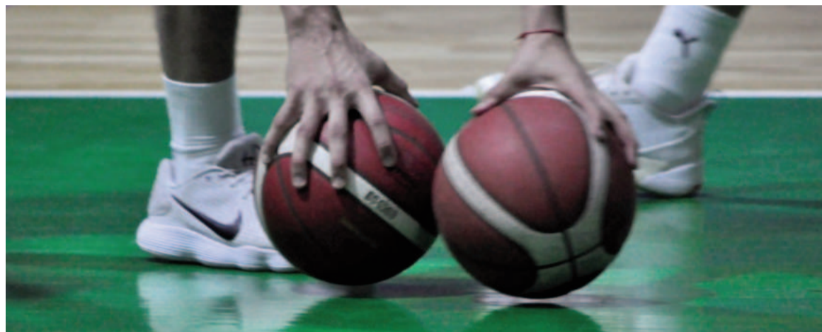
El básquet de San Nicolás transita por días movidos a la espera de la Asamblea.