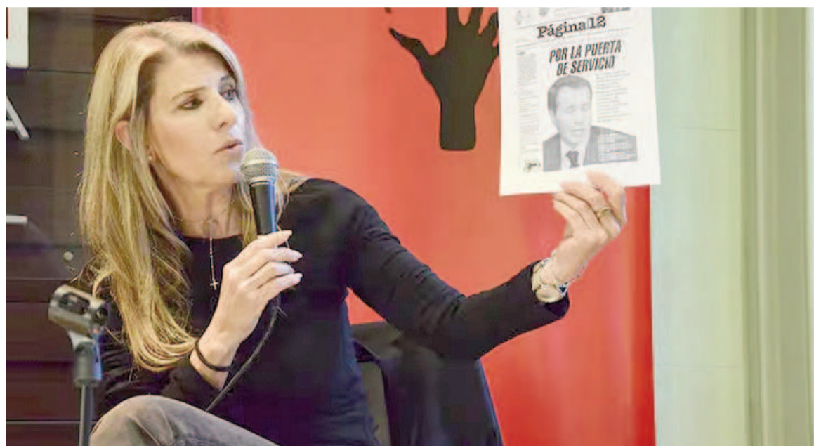
La jueza mostró la tapa del diario Página 12 con un título que, en su visión, ocultaba un mensaje.