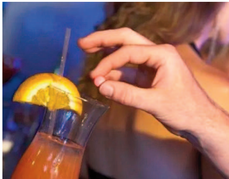
La burundanga impide que la persona afectada pueda oponerse a agresiones sexuales.

El relato de la agresión sufrida por esta mujer tiene que ver con una situación en la que la hizo tomar una burundanga para aprovecharse de la menor. El individuo invitó a la «sobrina» y a la hermana de la novia a hacer una «previa» antes de ir al boliche. Al llegar tenía una conservadora donde guardaba bebidas alcohólicas.