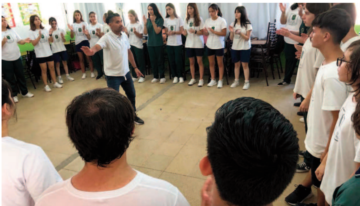
Colegio Los Aromos ofrece talleres especializados que guían a los estudiantes en la exploración de sus intereses y habilidades.

El Colegio Los Aromos de San Javier se destaca como un faro de excelencia educativa para jóvenes en su etapa secundaria. Esta institución, reconocida por su compromiso con el desarrollo integral de sus estudiantes, ofrece un entorno académico y extracurricular que prepara a los adolescentes para enfrentar con éxito los desafíos del siglo XXI. El establecimiento desarrolla un estilo pedagógico que promueve valores humanos trascendentes como libertad responsable, perseverancia, empatía, respeto y autonomía. Buscando desarrollar en los alumnos habilidades blandas relacionadas con la inteligencia emocional, el pensamiento crítico, el liderazgo, la resiliencia o la gestión del cambio, que son claves para el desarrollo profesional. Por ello la institución no solo ofrece una formación académica sólida, sino también una amplia gama de actividades y talleres que hace brillar a cada uno de sus alumnos, brindándoles la posibilidad de desplegar sus potencialidades, a través de talleres o participando de olimpiadas, como por ejemplo, las Olimpiadas de Matemáticas, participación en Club TEDed y podcast (desarrollando capacidades para generar y comunicar ideas, potenciando la oratoria), Olimpiadas de Historia, participación en el programa Uniendo Metas (ONU); torneos deportivos locales y bonaerenses, entre otros. En estos días, alumnos del nivel secundario estarán viajando a representar al establecimiento