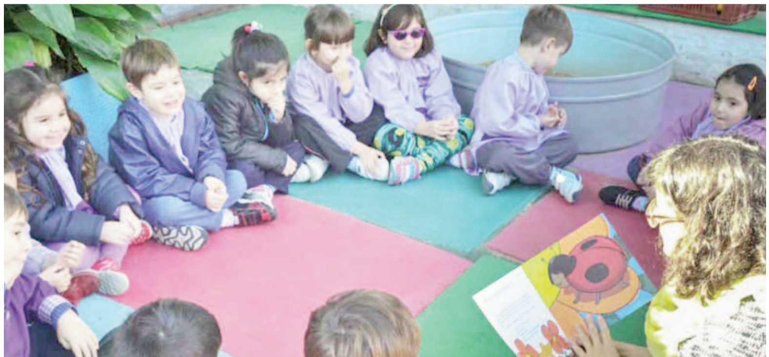
Este proyecto busca incrementar la cobertura educativa en territorio bonaerense, que ya se encuentra por encima de la media nacional.