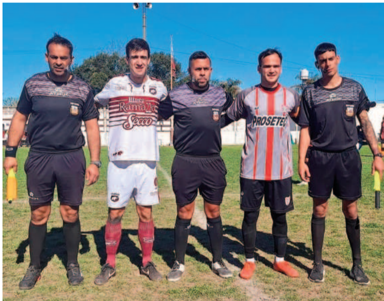
La cuarta fecha comenzó en el "Salomón Boeseldín" de Villa Ramallo. RADIO META RAMALLO

Por este grupo, hoy a las 15.30 Conesa recibirá a Social con arbitraje de Rodrigo Barra. La Academia, que viene de ganarle a Defensores, tiene 4 puntos y alcanzará a Paraná en la