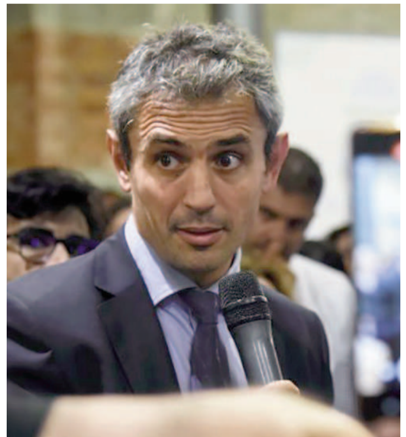
El presidente de la Cámara de Diputados, Martín Menem.

En tanto, sostuvo que los cinco diputados radicales que «se dieron vuelta» en el debate por la ley de jubilaciones porque «les compraron el voto, lisa, llana y literalmente» son los que «pegaron» al mandatario Javier Milei «con la casta».