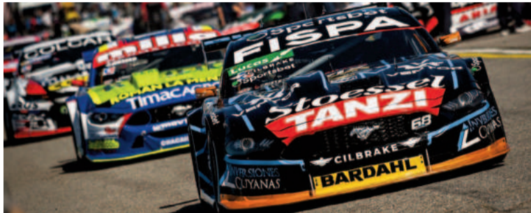
El Mustang de Santero fue el más veloz del sábado en San Luis. WEB

De la redacción de EL NORTE secciondeportes@yahoo.com.ar