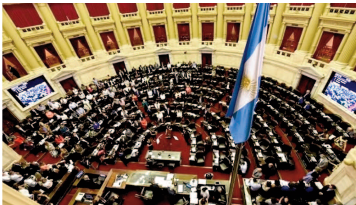
Milei hablará desde un atril como cuando encabezó la Asamblea Legislativa, en marzo.

Se trata del espacio que ocupa en cada sesión Unión por la Patria (UP), el bloque más numeroso (99 integrantes), presidido por el rosarino Germán Martínez. Definieron que sólo unos pocos legisladores kirchneristas estarán entre los asis-