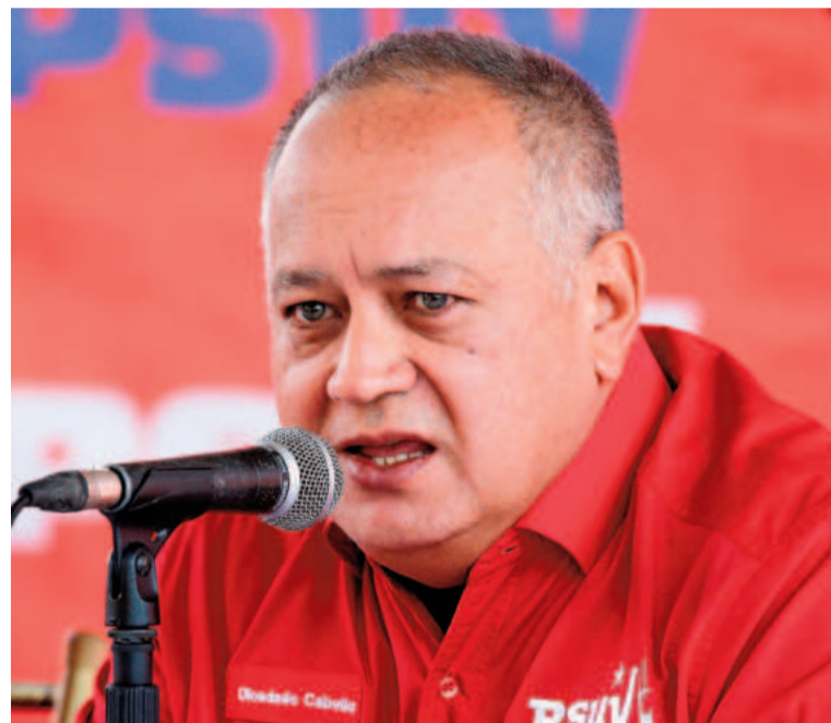
Diosdado Cabello, actual ministro del Interior y número dos del régimen.

Según el ministro, era uno de los planes contemplados en una operación “grande” con la que se pretendía meter en el país caribeño más de 400 armas “transportadas desde Estados Unidos” para llevar a cabo actos “terroristas”, entre