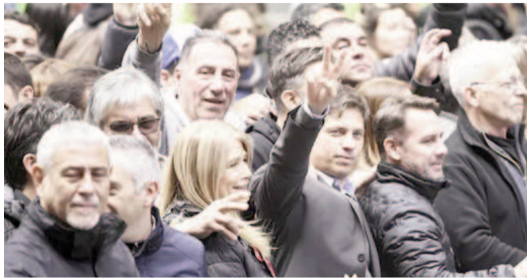
Kicillof marchó al Congreso para repudiar la ratificación del veto de Milei.

«La caída del poder adquisitivo de aquellos que están cobrando haberes jubilatorios de que llegó Milei ha sido muy fuerte, tiene un efecto sobre la vida de millones de jubilados y jubiladas de nuestra provincia», denunció. En ese sentido, apuntó contra el presidente por su responsabilidad: «hay que ser muy necio o tener ideas muy ridículas como las que a veces lleva adelante y reproduce el presidente para no darse cuenta que la caída de salarios y ju-