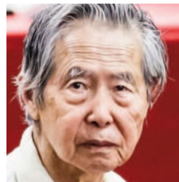
Alberto Fujimori tenía 86 años.

Luego de haber alcanzado la presidencia, a comienzos de la década