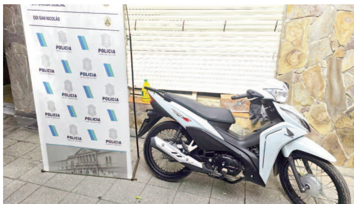
El operativo tuvo lugar en la madrugada de este miércoles.

El último de los ilícitos en perjuicio de la casa de cambios, ubicada en calle Mitre al 250, había sido denunciado el pasado 9 de julio en la Comisaría Primera por una de las encargadas de la entidad. La mujer relató que alrededor de las 13.45, cuando se encontraba en el interior del local en el sector de cajas, ingresó de manera violenta un hombre desconocido con un casco colocado que tenía una masa en la mano. Tras romper el vidrio de la caja N° 2 con la herramienta, sustrajo el dinero en efec-