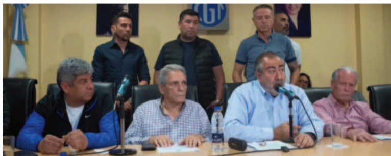
La CGT busca imponer nombres en el PJ nacional.

«Por último, se concluyó trabajar en este sentido, no con reuniones que pequen de ´sobre diagnósticos´ sino sobre la búsqueda de los caminos de concertación hacia un espacio de contención, amplitud y consolidación para una verdadera renovación generacional de voces e intérpretes para el momento que nos atraviesa», finalizaron.