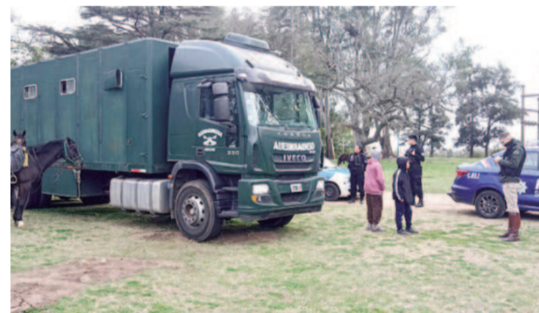
Gendarmería colaborará con sus diferentes divisiones.

“Estas son señales importantes a la hora de gestionar, escuchar y, fundamentalmente, de cuidar a nuestra ciudad”, cerró.