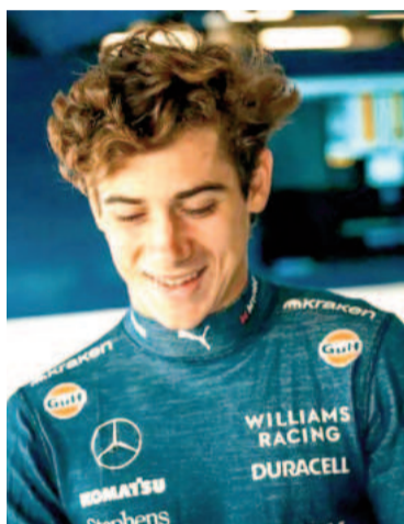
El pilarense correrá por primera vez en Azerbaiyán.