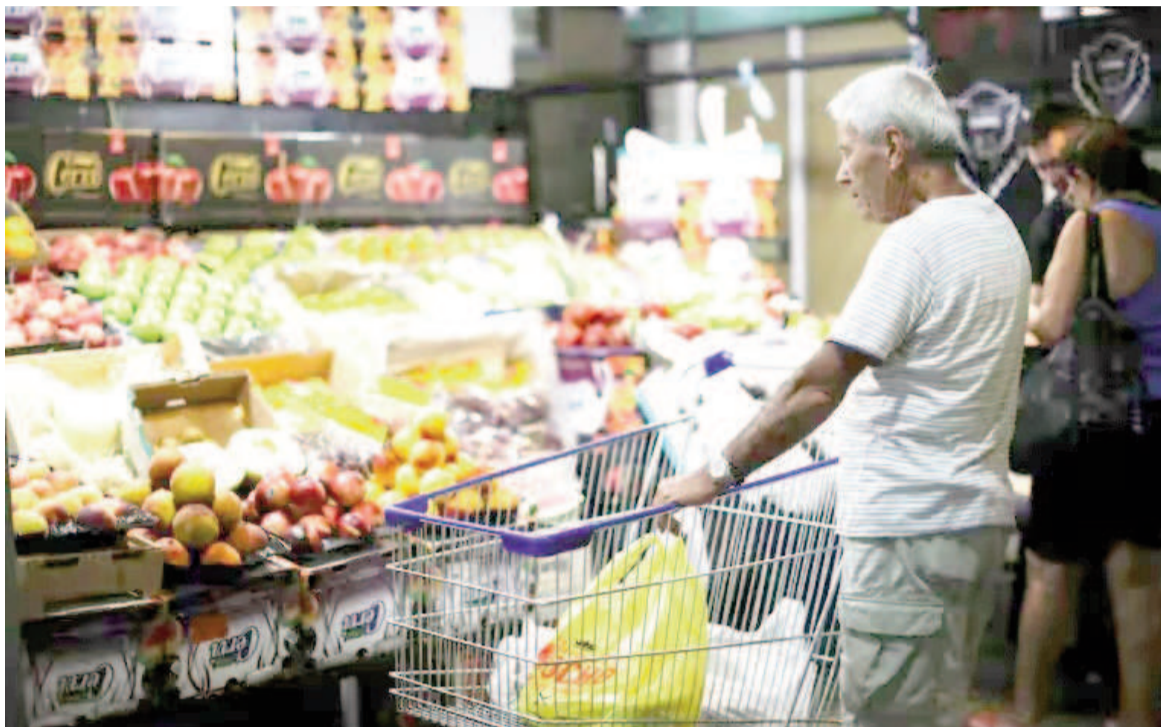
La expectativa para una desaceleración mayor del índice de precios está puesta en septiembre, por la baja del Impuesto PAIS.

“Para analizar la dinámica del proceso de desinflación y extraer tendencias más allá de la volatilidad de corto plazo, resulta útil analizar el comportamiento de las medias móviles de las variaciones del IPC. Este análisis es consistente con una continuidad en el proceso de desinflación, con la media móvil de 3 meses de la variación del IPC Nacional ubicándose, junto a la del mes anterior, en el menor nivel desde febrero de 2022, y la de 6 meses resultando la más baja desde marzo de 2023”, señalaron fuentes del mi-