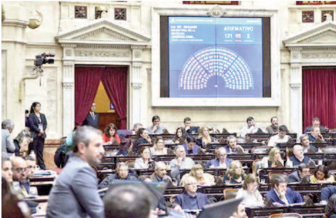
Diputados ratificó el veto de Milei a la reforma jubilatoria.

Una serie de incidentes se registraron e en las inmediateces del Congreso después de que la Cámara baja confirmara el veto presidencial