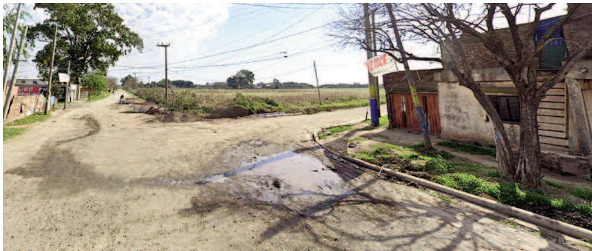
El joven recibió la muerte en su casa.

Su padre lo llevó en un auto particular hasta el Hospital Eva Perón. En estado crítico, lo ingresaron al quirófano pero no pudieron salvarle la vida. El agresor llegó hasta el domicilio de la víctima, en un asentamiento precario, gatilló una vez y escapó a pie.