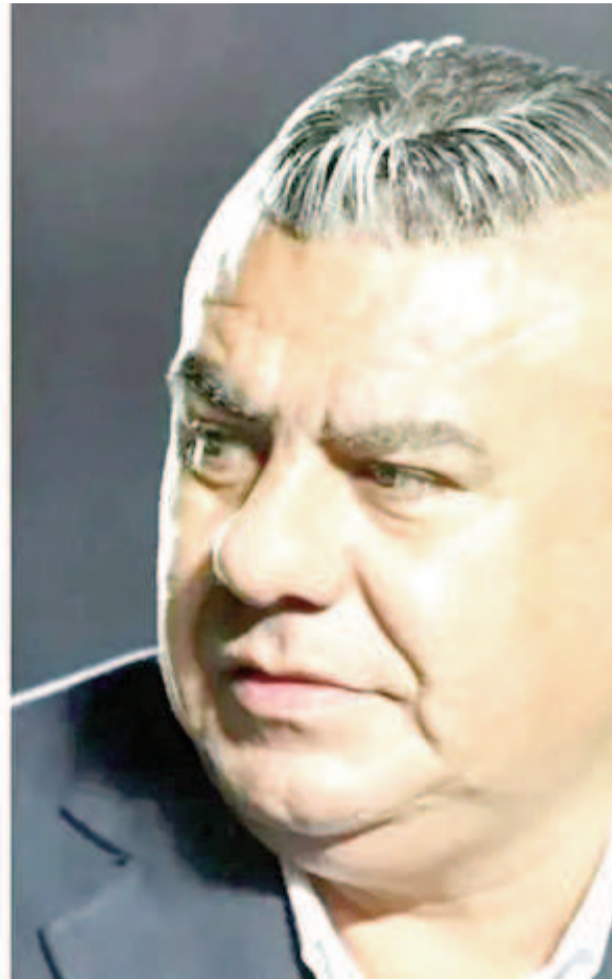
Javier Milei, presidente de la Nación – Claudio “Chiqui” Tapia, titular de AFA.

cibió el mundo del fútbol argentino, que fueron otorgados por la gestión anterior como parte de los compromisos electorales. Es una narrativa bélica que explica cómo el gobierno de Javier Milei tomó el rechazo de “Chiqui” Tapia a la puesta en marcha de las SAD: como una declaración de guerra.