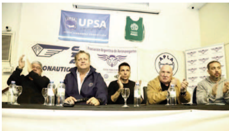
La Asociación Argentina de Aeronavegantes (AAA) y la Asociación de Pilotos de Líneas Aéreas (APLA) realizarán un paro de 24 horas.

Biró se quejó de que funcionarios y directivos de la aerolínea estatal “operan en la prensa para romper nuestras organizaciones”. “La traición viene de adentro, de lo propio”, consideró sin dar detalles, tras lo cual sostuvo que “es normal que compañeros tengan miedo de perder el trabajo” por las versiones periodísticas que circulan porque “la falta de miedo